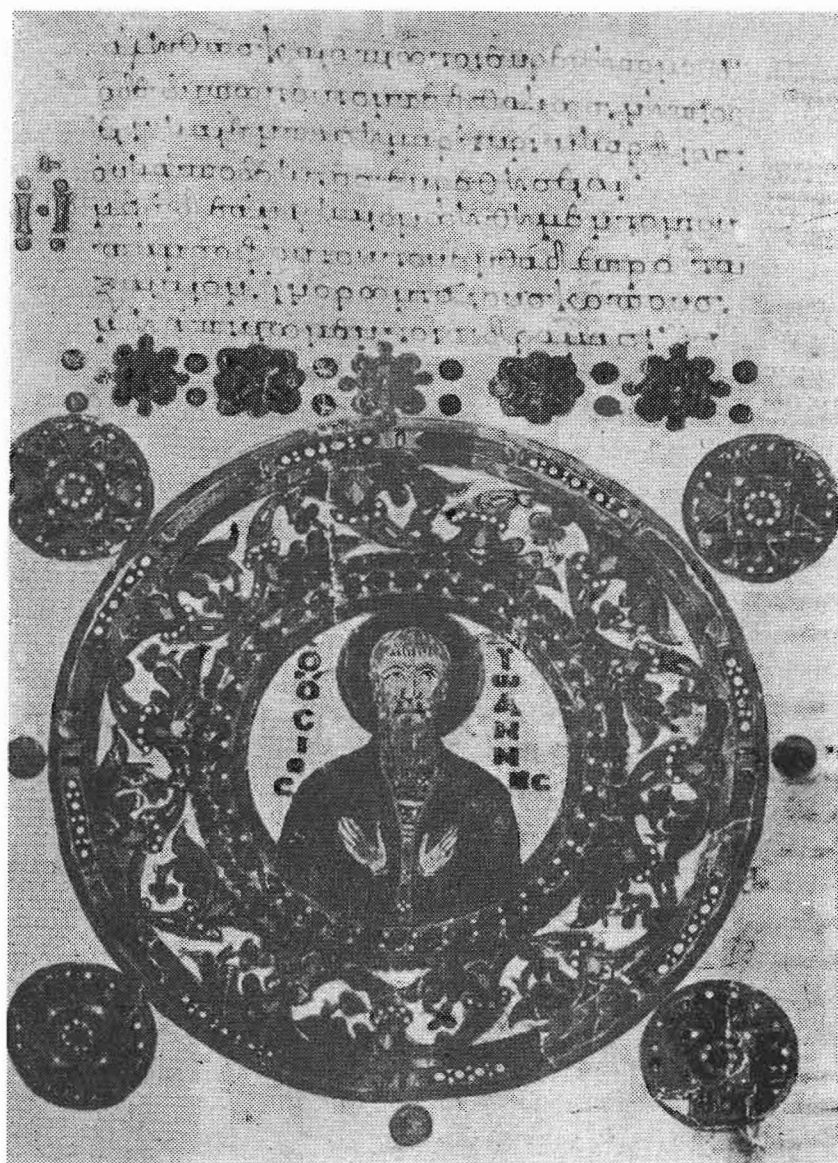
Ὁ ὅσιος πατὴρ ἡμῶν Ἰωάννης τῆς Κλίμακος, ὁ Σιναΐτης, ἐκ σιναΐτικοῦ χειρογράφου Πλου αἰῶνος.