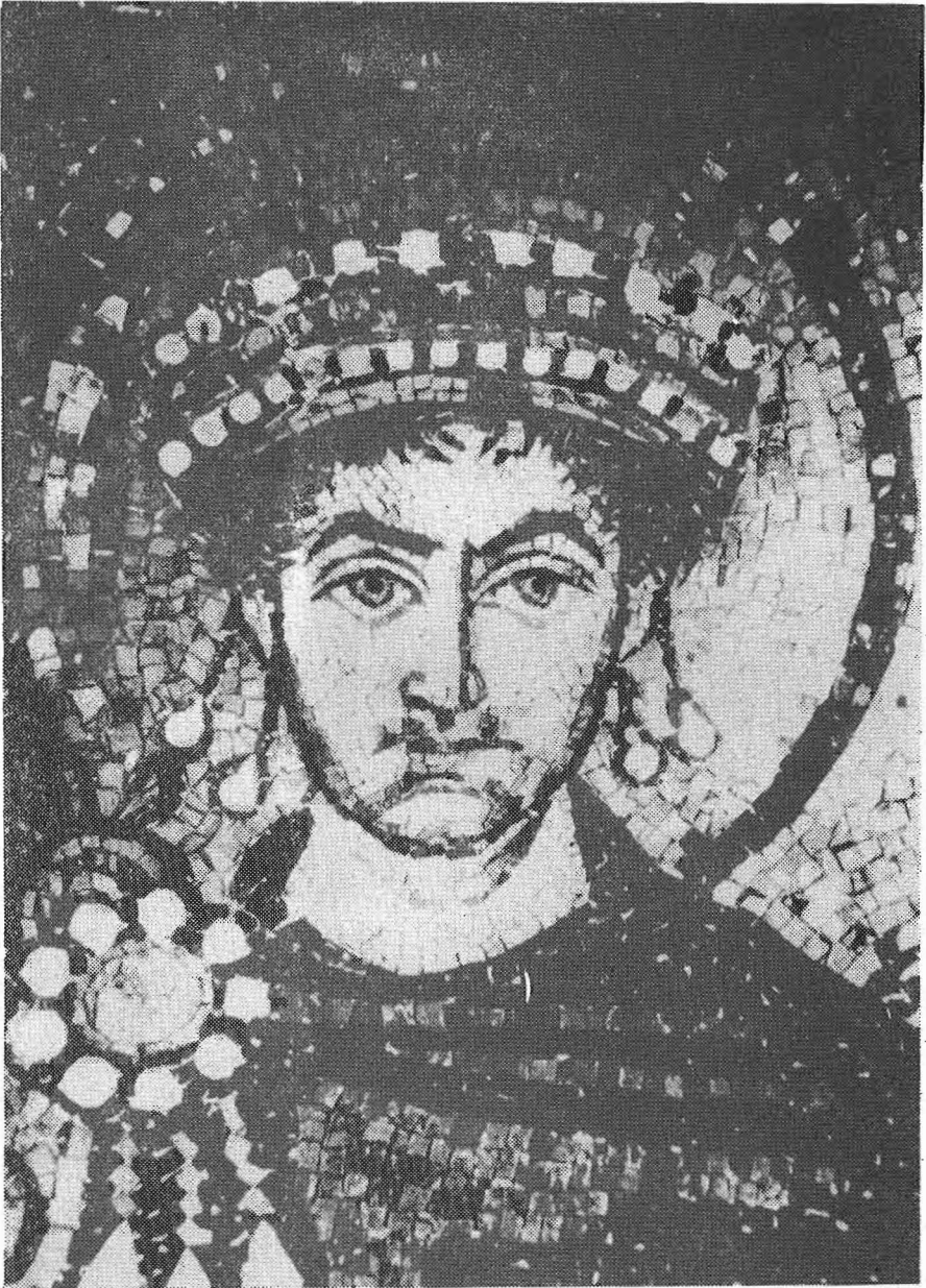
Ὁ ΙΟΥΣΤΙΝΙΑΝΟΣ (λεπτομέρεια μωσαϊκοῦ Ραβέννας).