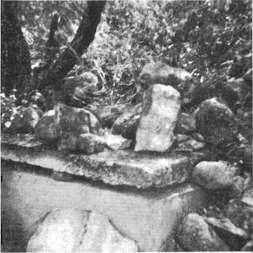
Εικ. 3. Τεμάχια διαφόρων μονολίθων,