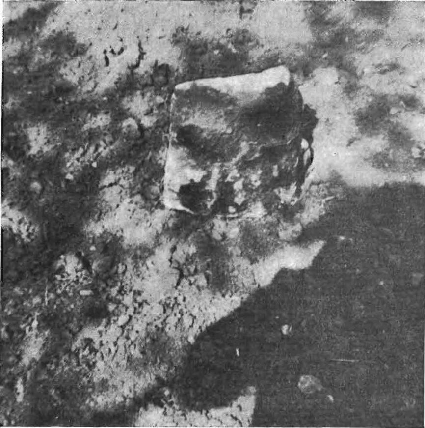
Εικ. 2. Κορινθιάζον κιονόκρανον. Ἐφθάρη δλωσ μεταγενεστέρως.