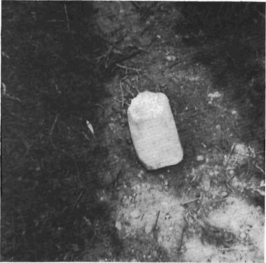
Ειχ. 1. Τεμάχιον μαρμαρίνου κιονόσου,