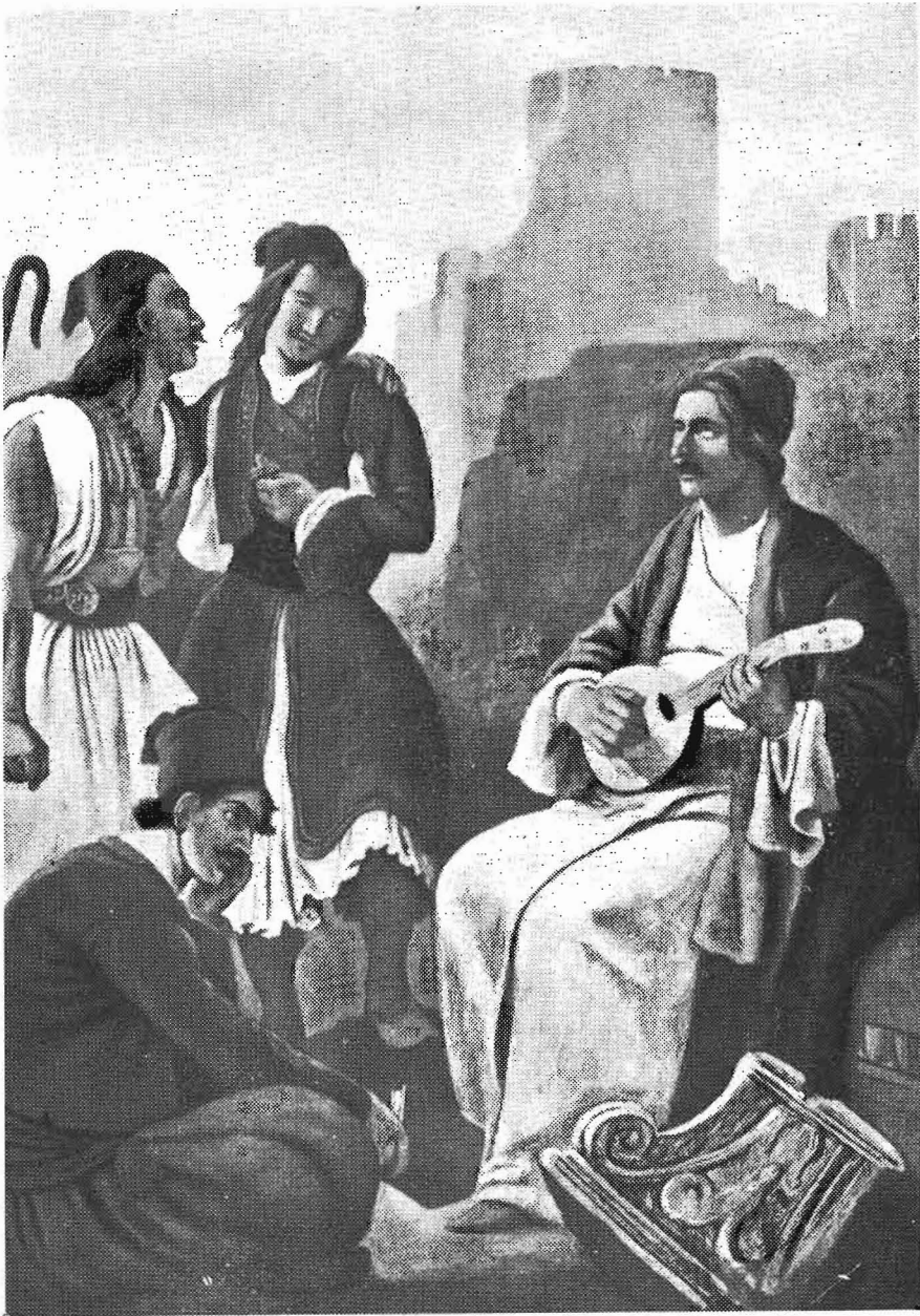
Ὁ Ρήγας ψάλλον τὸν Θούριον.