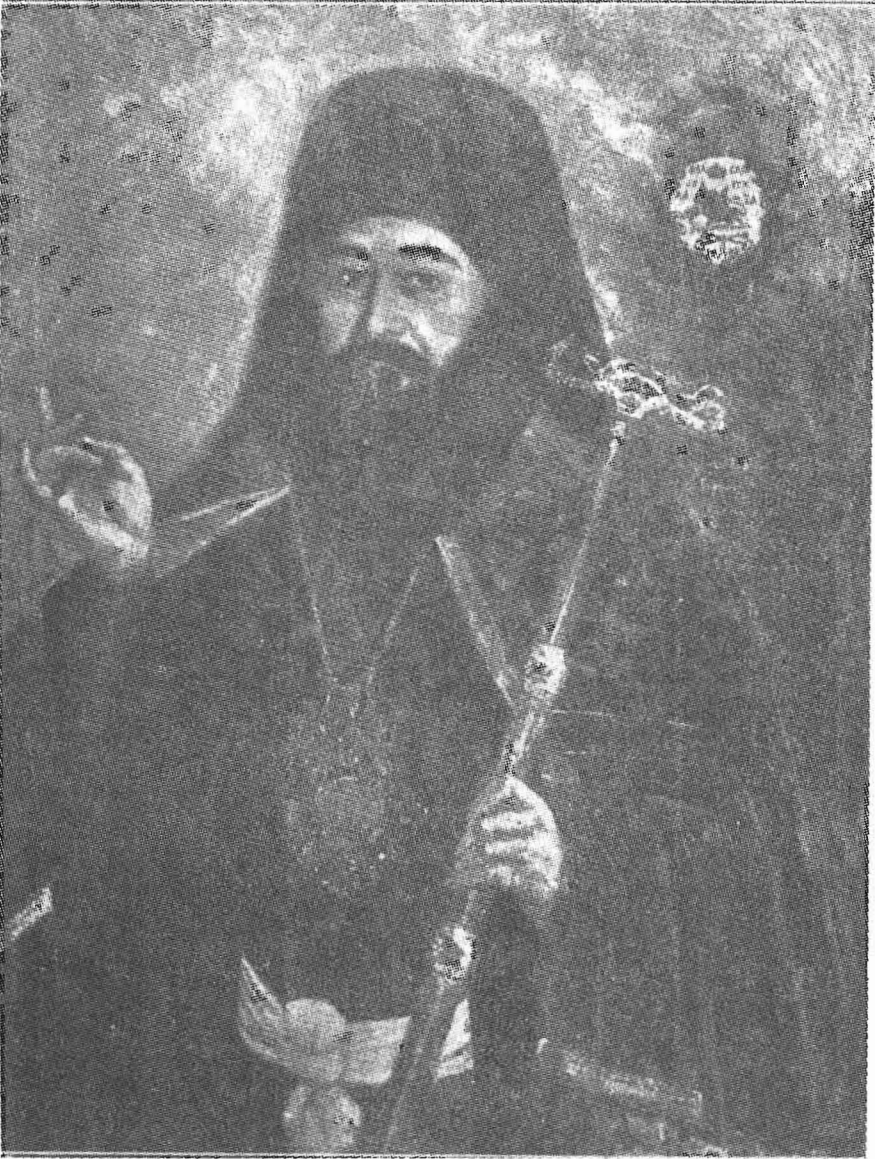
Ὁ Θεόφιλος ὡς Μητροπολίτης Λιβύης (Ἐκκλ. Φάρος, τόμ. 29, σελ. 16).