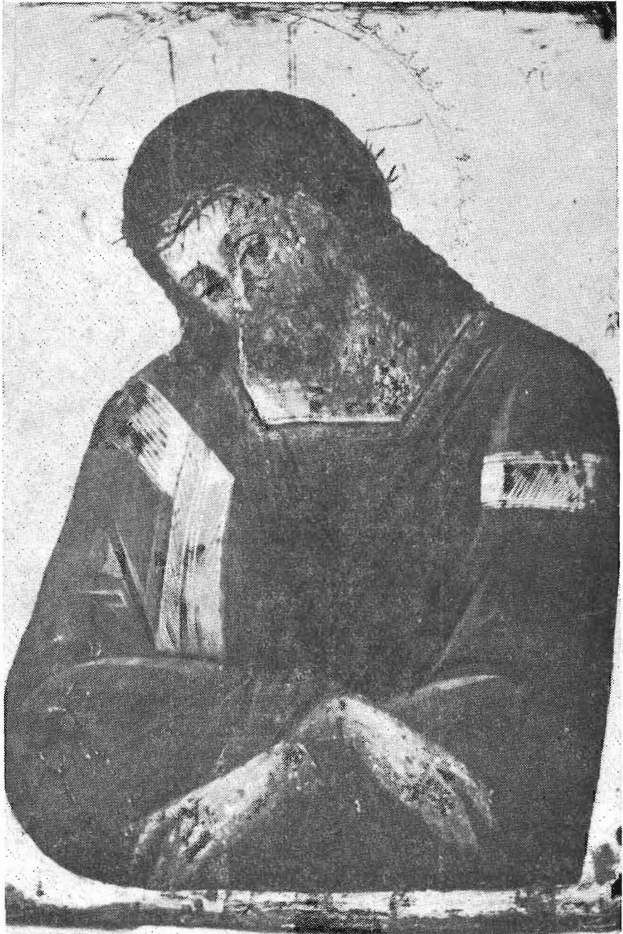
Ὁ Ἐλκόμενος (Μουσεῖον Μονῆς). Ἡ εἰκὼν ἐφ' ἧς ὁ Θεόφιλος ὤρχιζε τοὺς Φιλικούς (βλ. σελ. 73).