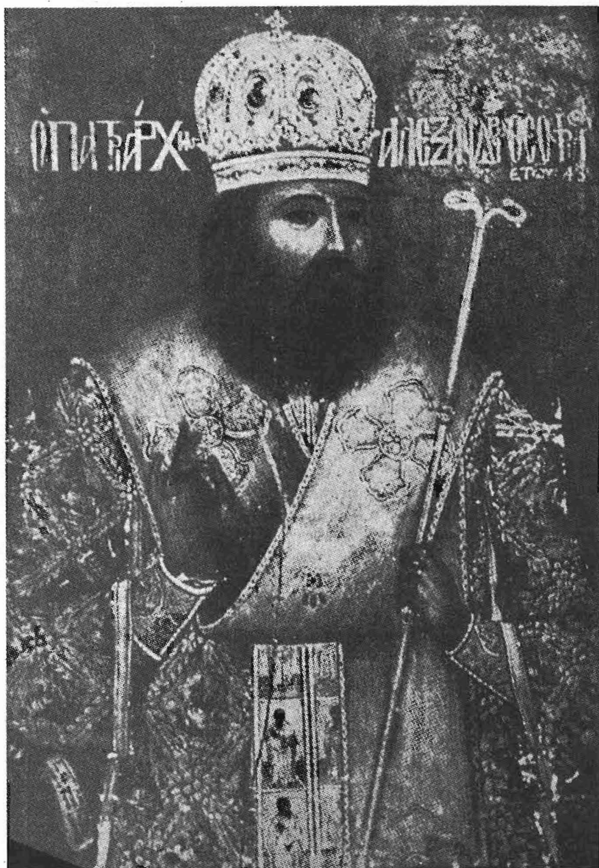
Ὁ Πατριάρχης Ἀλεξανδρείας Θεόφιλος εἰς ἡλικίαν 43 ἐτῶν. (Οἰκογενειακὴ φωτογραφία ἔτους ἱστορήσεως 1807. Βλ. σελ. 63).