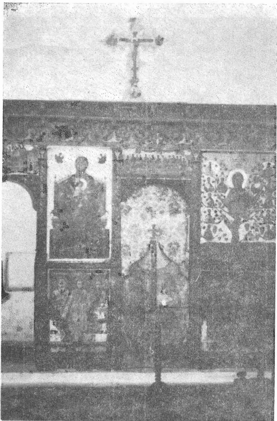
Τὸ τέμπλον τοῦ ναοῦ τῶν Ἁγίων Ἀποστόλων τῆς «Ἀδελφοσύνης», εἰς τὸν ὁποῖον ὠρμίζοντο οἱ Φιλικοί, ὀλίγα μέτρα ἀπὸ τῆς οἰκίας, εἰς ἣν διέμενεν ὁ Θεόφιλος.