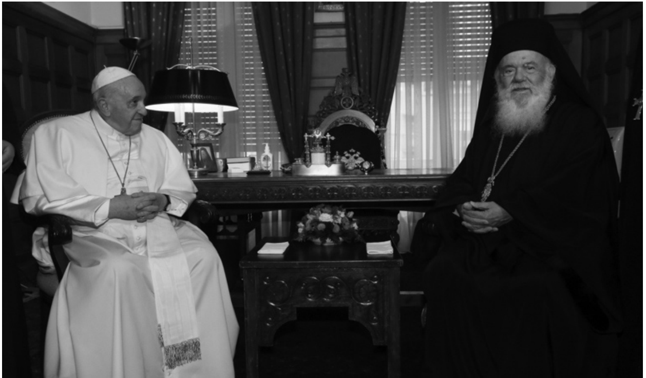
Ὁ Μακαριότατος Ἀρχιεπίσκοπος Ἀθηνῶν καὶ πάσης Ἑλλάδος κ. Ἱερώνυμος (δεξιά) ὑποδέχθηκε τὸν Ἁγιώτατο Πάπα Ρώμης κ. Φραγκίσκο εἰς τὴν Ἱερά Ἀρχιεπισκοπή Ἀθηνῶν, 4.12.2011.

Θεολογικό Διάλογο. Εἶθε τό Ἅγιο Πνεῦμα νά μᾶς βοηθᾷ γιά νά συνεχίσουμε συνετά νά βαδίζουμε σ' αὐτές τίς ὁδοῦς.