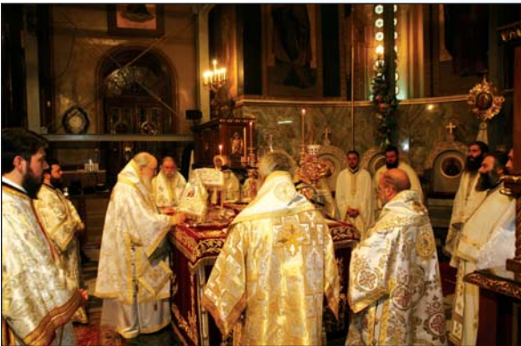
Στιγμιότυπο από τό Πολυαρχιερατικό Συλλείτουργο στον Ί. Καθεδρικό Ναό Άθηνών για την άποκατάσταση τής υγείας του Μακαριωτάτου (21. 10. 07)