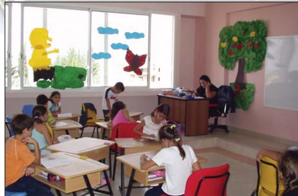
Ἐποψη αἴθουσας τοῦ σχολείου ποὺ ἐτοίμασε ἡ Μ.Κ.Ο. «Ἀλληλεγγύη» στὴ Συρία (10.11.07).