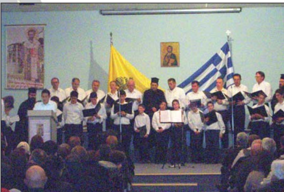
Στιγμιότυπο ἀπὸ τὴν ἐκδήλωση γιὰ τὸν Ἱερό Χρυσόστομο στὴν Κόνιτσα (11.11.07).