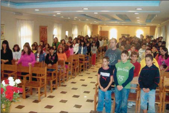
Παιδιά των Κατηχητικῶν Σχολείων τῆς Ἱ.Μ. Σιδηροκάστρου κατὰ τὴν τελετὴ ἀγίασμου τῆς ἐνάρξεως τῶν μαθημάτων (13.10.07).