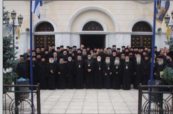
Τὰ μέλη τῆς 10' Πανορθόδοξου Συνδιασκέψεως γιὰ θέματα αἵρέσεων στὸ Ἱ. Προσκύνημα τοῦ Ἁγ. Ἰωάννου τοῦ Ρώσου (29.10. - 1.11.07).