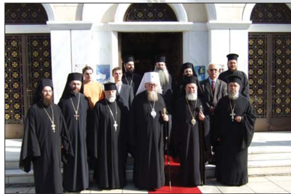
Τὸ Ἱερό Προσκύνημα τοῦ Ἁγίου Ἰωάννου τοῦ Ρώσου ἐπισκέφθηκε ὁ Μακ. Μητροπολίτης Βαρσοβίας κ. Παῦλος (16.11.07).