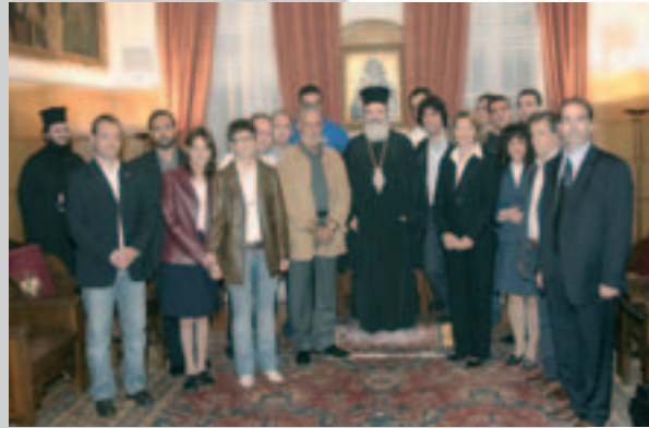
Ο Μακαριώτατος με την ομάδα μεταμοσχευμένων αθλητών κατά την επίσκεψή τους στην Άρχιεπισκοπή (27.10.05).