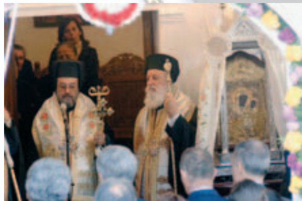
Άπο τη μεταφορά της Εικόνας της Παναγίας από την Ί. Μ. Έλώνης στο Λεωνίδιο, ό Σεβ. Μαντινείας και ό Θεοφ. Μαραθώνος (20.11.05).