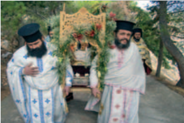
Λιτανεία της Ί. Εικόνας του Άγιου Κωνσταντίνου του Ύδραίου την ημέρα της μνήμης του (14.11.05) στην Ύδρα.