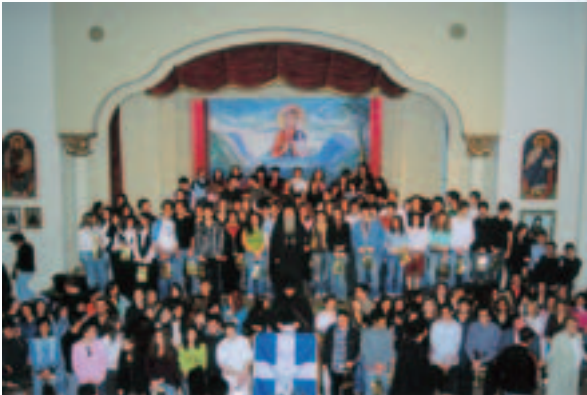
Τα μέλη των Ένοριών της Ί. Μ. Νικαίας με τον Σεβ. κ. Άλέξιο κατά την έορτή της επέτειου του ΟΧΙ.