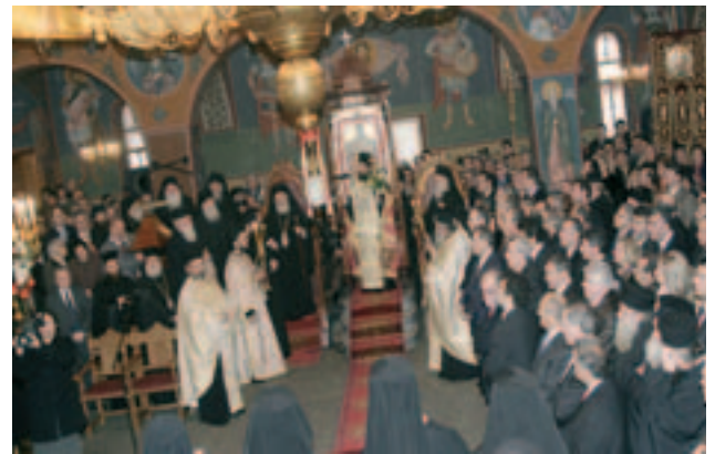
Ἀπὸ τὶς ἐνθρονίσεις τῶν νέων Σεβ. Μητροπολιτῶν Αἰτωλοακαρνανίας (ἀριστερὰ) καὶ Δράμας (δεξιὰ).

ἐπιτράπηκε γιὰ πρώτη φορὰ ἡ εἴσοδος στὸ βαθμὸ αὐτό. Μία ἰδίως ἐξ αὐτῶν, ἡ Caroline Sandon, πρώην διακόνισσα στὴν Ἀγγλικανικὴ Ἐκκλησία, δήλωσε ὅτι «ἡ χειροτονία γυναικῶν στὴ βαθμίδα τοῦ Ἐπισκόπου θὰ καταστρέψει ἀξίες, γιὰ τὴν καθιέρωση τῶν ὁποίων ἀπαιτήθηκαν 2000 χρόνια στοχασμοῦ, δοκιμῶν καὶ δοκιμασιῶν στὸν θεσμό τῆς Ἐκκλησίας». Τεκμηριώνει δὲ καὶ θεολογικὰ τὴν πεποίθησή της ἐπικαλούμενη χωρία ἀπὸ τὴ διδασκαλία τοῦ Ἀποστόλου Παύλου (ὅπως στὴν Πρώτη Πρὸς Τιμόθεον Ἐπιστολή του) καὶ ἀπὸ τὴν Βίβλο. Δὲν θεωρεῖ ὅτι τὰ Ἱερὰ Κείμενα χρήζουν ἐπανερμηνείας κατὰ τρόπο σχετικιστικὸ καὶ ἀνάλογο μὲ τὶς πολιτισμικὲς ἐξελίξεις κάθε ἐποχῆς, διότι ὑποστηρίζει πὼς γράφηκαν μὲ βάση τὸ πρότυπο τῶν ἀνθρωπίνων σχέσεων το ὁποῖο ἐγκαθιδρύθηκε ἤδη ἀπὸ τὴ Δημιουργία τῆς Κτίσεως: «πρῶτος ἐπλάσθη ὁ Ἀδάμ», σημειώνει, «καὶ κατόπιν ἡ Εὐα».