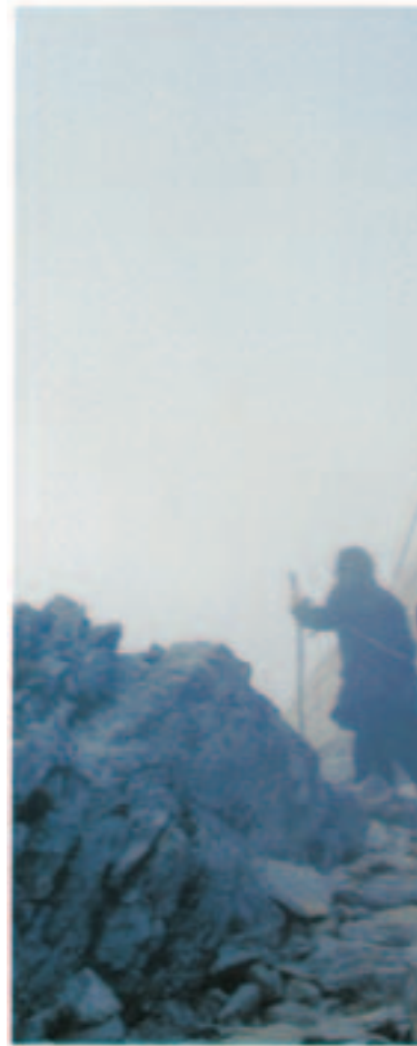
Φθάνοντας (Ἀθωνικὲς στιγμῆς,

θοῦν. Τί ωραία πού τὸ λέγει αὐτὸ ὁ εἰρμὸς τοῦ Κανόνου: « Σταυρὸν χαράξας Μωυσῆς ἐπ' εὐθείας ράβδῳ τὴν Ἐρυθρὰν διέτεμε, τῷ Ἰσραὴλ πεζεύσαντι, τὴν δὲ ἐπιστρεπτικῶς Φαραὼ τοῖς ἄρμασι κροτήσας ἤνωσεν ». Ποιὸς τότε μπορούσε νὰ ἐξηγήσει τί ἐσήμαινε ἡ σταυροειδὴς τῆς θάλασσας χάραξη; Καὶ ὁμοίως. Ἐπρόκειτο γιὰ προτύπωση τῆς μεγάλης δυνάμεως τοῦ Σταυροῦ, πού θὰ γινόταν ἀργότερα ὄπλο σωτηρίας. Καὶ ἡ ὑψωση πάλιν στὴ μέση τῆς ἐρήμου τοῦ χαλκίνου φιδιοῦ, ἦταν προτύπωση τῆς ὑψώσεως τοῦ Χριστοῦ πάνω στὸ Σταυρό. Κάθε ἔβραιος δαγκωμένος ἀπὸ τὰ δηλητηριώδη φίδια ἐσώζετο κοιτάζοντας τὸν χάλκινο ὄφι. Γιατί ἀργότερα καὶ κάθε ἄνθρωπος θὰ μπορούσε νὰ σώζεται ἀπὸ τὸ ἰοβόλο δῆγμα τῆς ἀμαρτίας ἀτενίζοντας τὸ ζωηφόρο Σταυρὸ τοῦ Χριστοῦ. « Καθὼς Μωυσῆς ὑψώσε τὸν ὄφιν ἐν τῇ ἐρήμῳ οὕτως ὑψωθῆναι δεῖ τὸν υἱὸν τοῦ ἀνθρώπου ἵνα πᾶς ὁ πιστεύων εἰς αὐτὸν μὴ ἀπολλῆται ἀλλ' ἔχη ζωὴν αἰώνιον ». Αὐτὸς εἶναι ὁ Σταυρὸς τοῦ Χριστοῦ, δυνατός, ἀκαταμάχητος, προστασία γιὰ τοὺς πιστοὺς, λιμάνι Σωτηρίας. Πολὺ χαρακτηριστικὸ εἶναι τὸ ἀκόλουθο τροπᾶριο τῆς Ὑψώσεως: « Χαίροις ὁ ζωηφόρος Σταυρὸς, τῆς εὐσεβίας τὸ ἀήττητον τρόπαιον, ἢ θύρα τοῦ Παραδείσου, ὁ τῶν πιστῶν στηριγμός, τὸ τῆς Ἐκκλησίας περιτείχισμα. Δι' οὗ ἐξηφάνισται ἡ ἀρὰ