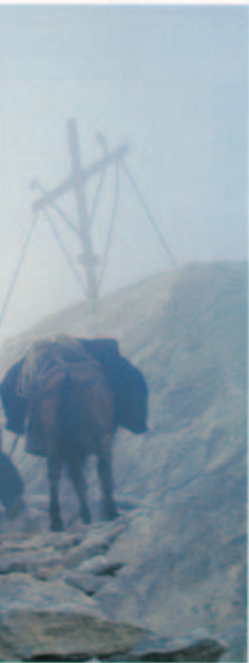
στὴν κορυφή... Μονὴ Φιλοθέου, 1993)

Ἡ Ἐκκλησία μᾶς καλεῖ ἐπίσης νὰ πιστεύουμε στὸν Ἰησοῦ Χριστὸ ποὺ σταυρώθηκε, καὶ προσθέτει «ἐπὶ Ποντίου Πιλάτου». Ἡ ἱστορικὴ ἀναφορὰ στὸν ἡγεμόνα τῆς Ἰουδαίας εἶναι ἀπάντηση στοὺς Δοκητὰς, ποὺ ἐδίδασκαν ὅτι ὁ θάνατος τοῦ Χριστοῦ δὲν ἦταν ἱστορικὸ γεγονός ποὺ συνέβη μιὰ συγκεκριμένη ἐποχὴ. Τὰ Εὐαγγέλια δὲν ἀφήνουν καμμιά ἀμφιβολία γιὰ τὴν ἱστορικὴ συγκυρία τῆς σταύρωσης. Ἐπομένως ὁ Κύριος ἔπαθε πραγματικὰ καὶ ὄχι «κατὰ δόκησιν», ἐδοκίμασε τὸ φρικτὸ μαρτύριο μέχρι τέλους, καὶ παρέδωσε τὸ πνεῦμα ἐπὶ τοῦ Σταυροῦ. Ὁ θάνατός του ὑπῆρξε βιολογικὰ γεγονός ἀναμφισβήτητο. Καὶ ὁ Πιλάτος, ποὺ κατὰ τὸν Φίλων ἦταν «τὴν φύσιν ἀκαμπῆς καὶ μετὰ τοῦ αὐθάδους ἀμείλικτος» συνήργησε στὸ μαρτύριο τοῦ Χριστοῦ. Δὲν χρειάζεται ἐδῶ νὰ καταγίνουμε μὲ τὸν Πιλάτο. Ἡ ἱστορία ὅμως μᾶς προσφέρει ἀρκετὲς περὶ αὐτοῦ πληροφορίες ποὺ καταδείχνουν τὸν ἀγέρωχο καὶ τυραννικὸ του χαρακτήρα. Κατεσπίλωσε τὴν ἡγεμονία του μὲ σφαγές, λεηλασίες, δωροδοκίες, ἱεροσυλίες καὶ ἄλλα φρικτὰ ἐγκλήματα. Ὑπῆρξεν ἐκεῖνος ποὺ οὐσιαστικὰ παρέδωσε τὸν Χριστὸν εἰς θάνατον.