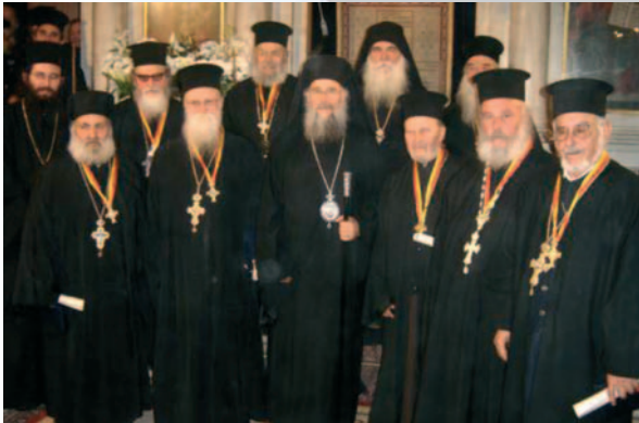
Ο Σεβασμιώτατος Κερκύρας κ. Νεκτάριος τίμησε τους ιερείς της Ίερης Μητροπόλεως, οι οποίοι έχουν συμπληρώσει τεσσαρακονταετή ιερατική διακονία. (Μάρτιος 2005).