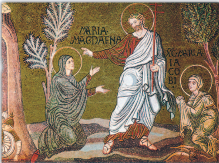
Ὁ Ἰησοῦς ἐμφανίζεται μετὰ τὴν Ἀνάστασή του στὴ Μαρία Μαγδαληνή καὶ τὴν Μαρία τοῦ Ἰακώβου. (Μονρεάλε, Σικελία.)

Εἰδικότερα στὴν Κ. Διαθήκη ὁ Εὐαγγελιστὴς Λουκᾶς ὅταν περιγράφει τίς περιοδεῖες τοῦ σταῖ διάφορα μέρη τῆς Παλαιστίνης γράφει ὅτι ἀκολουθοῦσαν Αὐτὸν ἐκτὸς βέβαια τῶν μαθητῶν, «καὶ γυναῖκές τινες αἱ ἦσαν τεθεραπευμέναι ἀπὸ νόσων καὶ μαστιγῶν καὶ πνευμάτων πονηρῶν καὶ ἀσθενειῶν, Μαρία ἡ καλουμένη Μαγδαληνή, ἀφ' ἧς δαιμόνια ἑπτὰ ἐξεληθῆναι καὶ Ἰωάννα γυνὴ Χουζᾶ ἐπιτρόπου Ἡρώδου, καὶ Σουσάννα καὶ ἕτεραι πολλαί, αἵτινες διηκόνουν αὐτῷ ἀπὸ τῶν ὑπαρχόντων αὐταῖς». (Λουκ. 8, 2-3 καὶ Μάρκ. 16,9). Ὁ Κύριος, λοιπόν, εἶχε ἐκδιώξει ἑπτὰ δαιμόνια ἀπὸ τὴν Μαρία τὴν Μαγδαληνή (ἀπὸ τὴν πόλη Μάγδαλα, στὰ ὄρια τῆς Συρίας) καὶ μετὰ τὴν θεραπεία της ἐκείνη παρακολουθοῦσε καὶ ἤκουε τὴν θεία διδασκαλία μετὰ βαθυτάτης εὐλαβείας καὶ μετὰ διαθέσεως διακονίας ὅπως ἔπρατταν καὶ ἄλλες γυναῖκες τοῦ εὐρύτερου κύκλου τοῦ Κυρίου. Εἶναι παντελῶς λαυθασμένη ἡ ἄποψη πὺ διατυπώθηκε αὐθαίρετως στὴν Δύση στὸ μεσαιῶνα ὅτι κάτω ἀπὸ τὴν φράση «ἑπτὰ διαμόνια» ὑπονοεῖται μία διεφθαρμένη ζωὴ. Πουθενὰ δὲν λέγει κάτι τέτοιο ἡ Ἁγία Γραφή. Μά-