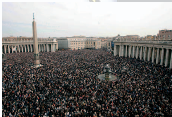
Έκατομμύρια πιστών παρακολούθησαν στη Ρώμη την κηδεία του Πάπα Παύλου Ίωάννου του Β' (8.4.2005).