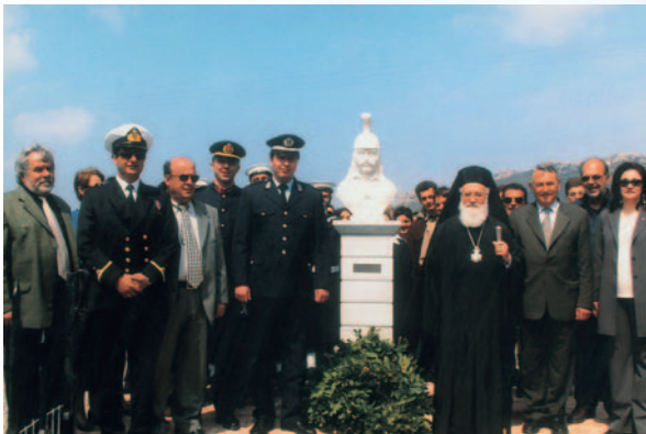
Άπο την επίμνημόσυνη δέηση και την κατάθεση στεφάνου στο μνημείο του Κολοκοτρώνη στα Κύθηρα (24 Μαρτίου 2005).