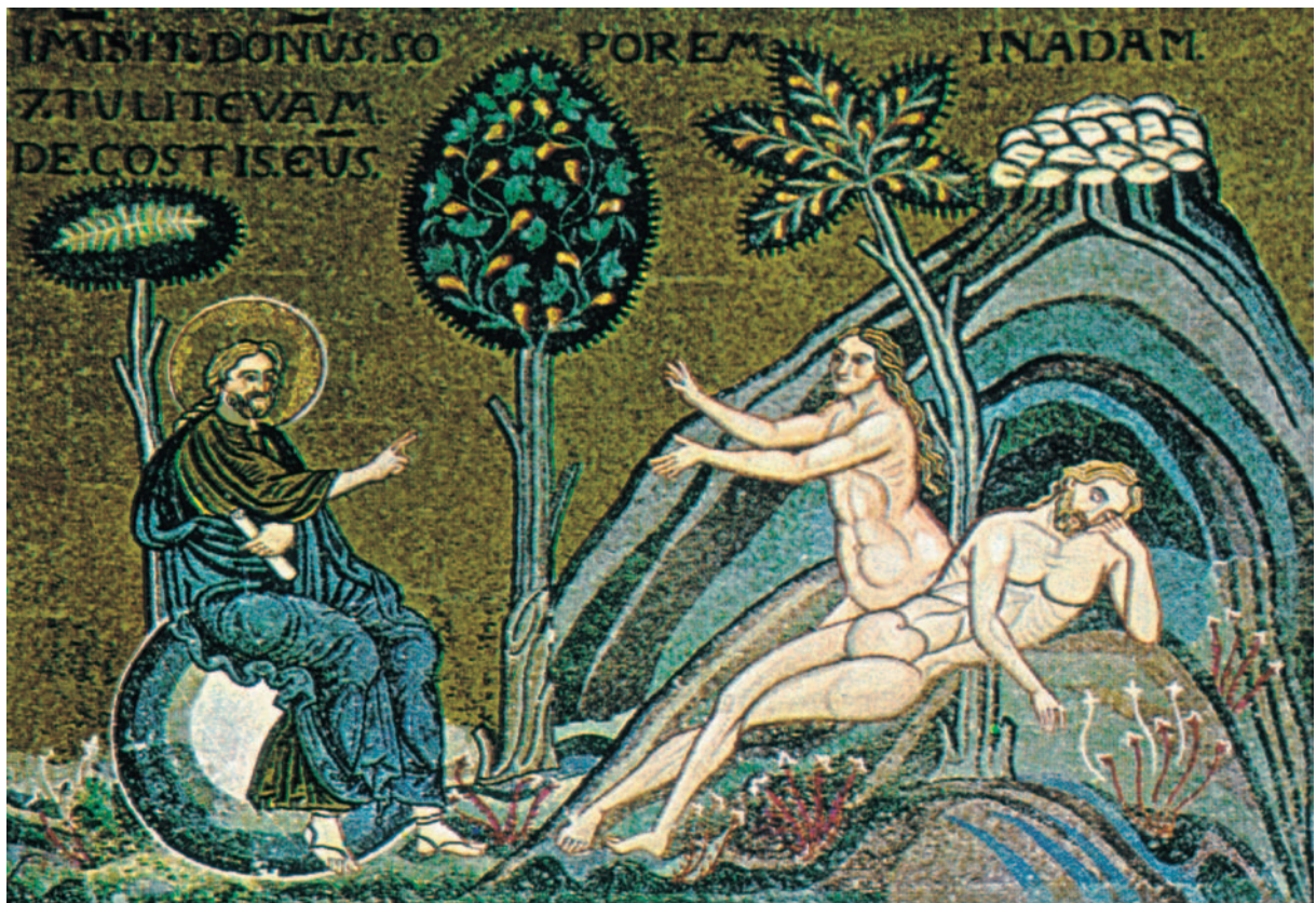
Η δημιουργία τής Εύας από τήν πλευρά του Άδάμ, Μουρεάλε Σικελία.

τότητα του ανθρώπου να πραγματοποιήσει στη ζωή του τήν κοινωνία με τους άλλους άνεξάρτητα από τού Θεό και χωρίς αυτόν. Σ' αυτή τήν περίπτωση ό άνθρωπος από πρόσωπο μεταμορφώνεται σε άτομο. Τό «καλόν» και τού «κακόν» στο άπαγορευμένο δένδρο δέν έχει τή χρησιμοθηρική έννοια που δίνουμε στους όρους αυτούς σήμερα. Σημαίνει τή ζωή και τού θάνατο, έπειδή άνεξαρτοποίηση από τού Θεό σημαίνει θάνατο και κοινωνία μαζί του σημαίνει ζωή. Γι' αυτό και ή προειδοποίηση του Θεού είναι σαφής: όταν θά φάτε από τον καρπό αυτού του δένδρου θά πεθάνετε. Έδώ δέν είναι μια άπειλή, όπως θά μπορούσε να υποθέσει κάποιος. Είναι μια πρόγνωση και μια προειδοποίηση για κάτι που άναπόφευκτα έρχεται σαν συνέπεια ύστερα από μια αίτια. Σημαίνει τή σχέση αίτιου και αιτιατού. Γι' αυτό και ή ευθύνη των πρωτοπλάστων είναι πλήρης. Κανείς δέν θά μπορέσει να τούς άπαλλάξει άπ' αυτήν όταν έχουν τήν τόσο κατηγορηματική προειδοποίηση του Θεού.