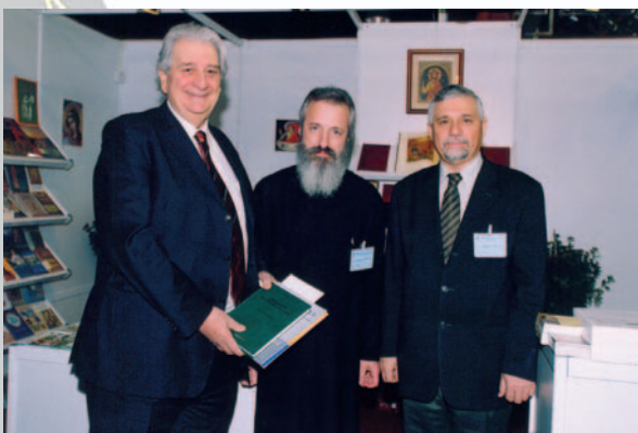
Ο Υπουργός Παιδείας και Πολιτισμού της Κύπρου κ. Γεωργιάδης κατά την επίσκεψή του στο Περίπτερο της Αποστολικής Διακονίας, την ημέρα των εγκαίνιων της 12ης Διεθνούς Εκπαιδευτικής Έκθεσεως Κύπρου.