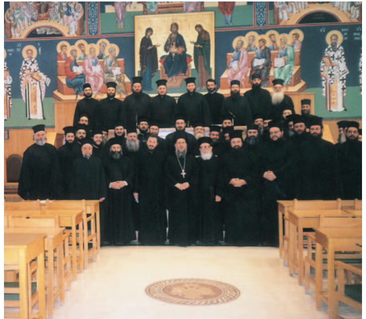
Σύναξη τῆς Ἀδελφότητος Ἱ. Μ. Πετράκη (9.4.05) μὲ θέμα «Περὶ τῆς διακονίας ἐν τῇ Ἐκκλησίᾳ τοῦ ἐν τῷ κόσμῳ ἀγάμου κληρικοῦ».