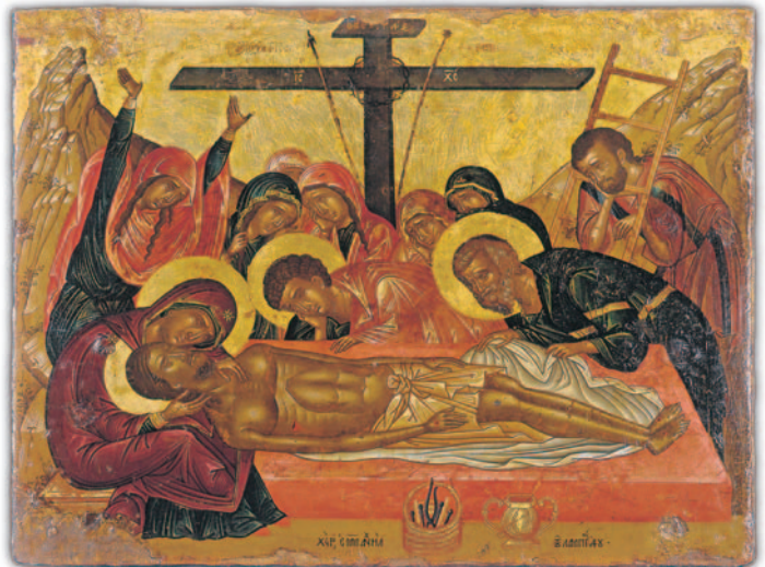
Ἡ Μαρία Μαγδαληνὴ (πάνω ἀπὸ τὴν Παναγία) θρηνεῖ μαζί μέ τὴ Θεοτόκο, τοὺς Μαθητὲς καί ἄλλες γυναῖκες. Ἐπιτάφιος θρῆνος, Ἐμμ. Λαμπάρδος, ἀρχές 17ου αἰ. Βυζ. Μουσεῖο. (Μονρεάλε, Σικελία.)

Ὑμνογράφος καί μελωδὸς ἡ μοναχὴ Κασσιανὴ στολιζεῖ πραγματικὰ τὸ πνευματικὸν στερέωμα τῆς Ἐκκλησίας ἀπὸ τοὺς μέσους βυζαντινοὺς χρόνους ἀποδεικνύουσα δικαίως τὸν ἱερότατο καί σπουδαιότατο σύνδεσμο παιδείας καί λατρείας τοῦ Θεοῦ.