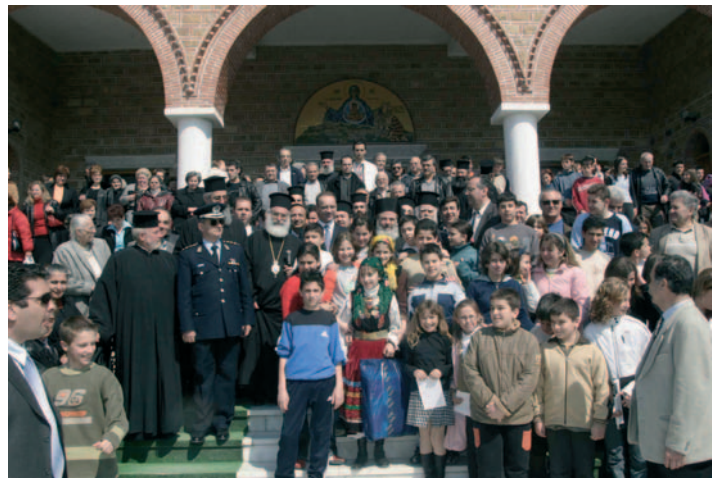
Ὁ Μακαριώτατος μὲ παιδιά τῆς Θράκης κατὰ τὴν ἐπίσκεψή του ἐκεῖ μετὰ τίς πλημμύρες στὸν Ἐβρο. Διακρίνονται οἱ Σεβ. Μητροπολίτες Διδυμοτείχου, Ξάνθης καὶ Ἀλεξανδρουπόλεως.

σαν καὶ τὰ τελευταῖα ράκη τῆς ἀνθρώπινης ἀξιοπρέπειας. Χειμάζεται ἡ κοινωνία ἀπὸ δέσμες προβλημάτων τῆς καθημερινότητος, πού ἀπαξιώνουν τὰ πρόσωπα καὶ ὑποθηκεύουν τὸ μέλλον. Ἡ πορεία τοῦ κόσμου δὲν φαίνεται νὰ εἶναι ἐλπιδοφόρα. Τὰ συμφέροντα κυριαρχοῦν βασιανιστικά, ἡ ἠλεκτρονικὴ παραεξουσία ἀπειλεῖ τὸ ἄσυλο τῆς προσωπικῆς ζωῆς. Βιώνουμε τὴν ἀποτυχία τοῦ πολιτισμοῦ μας, τὸ βάσανο τῆς μοναξιάς, τὴ λεηλασία τῶν ψυχικῶν ἀντισωμάτων, τὴν καταρράκωση τῆς αὐθεντίας, τὴν κατασπίλωση τῶν θεσμῶν. Τί ἀπομένει ἄραγε; Ἀσφαλῶς ὄχι ἡ ἀπόγνωση ἢ ὁ φόβος. Ἄλλὰ ἡ πίστη καὶ ἡ συσπεί-