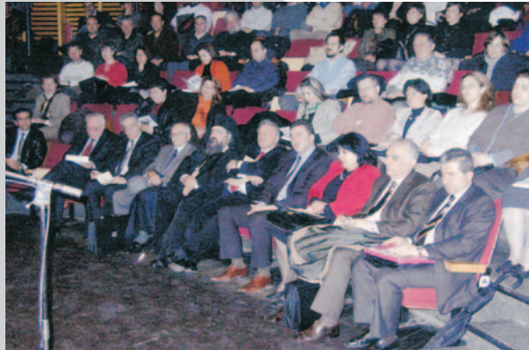
Επιστημονική ημερίδα για τους Θεολόγους Καθηγητές της Δευτεροβάθμιας Εκπαίδευσης διοργάνωσε η Τ.Μ. Νεαπόλης και Σταυρουπόλεως και η Περιφερειακή Διεύθυνση Π.Ε. και Δ.Ε. Μακεδονίας. Στιγμιότυπο από τις εργασίες (22 Μαρτίου 2005).