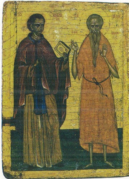
Οι άγιοι Ιωάννης ό Καλυβίτης και Παϋλος ό Θηβαίος.

• Ένα άλλο θέμα είναι ή ξενάγηση της Ι. Μονής. Πολλοί έπισκέπτες ζητούν να πληροφορηθοϋν για την ιστορία της Μονής, για τις άγιογραφίες, για την σημερινή κατάσταση. Και φυσικά τις περισσότερες φορές οι έρωτήσεις προχωροϋν σε θεολογικές άπορίες και σε ζητήματα πνευματικής φύσεως. Θα πρέπει, λοιπόν, ή Ι. Μονή να έχει μεριμνήσει να έχει το κατάλληλο πρόσωπο, το όποιο με συναίσθηση βαθειάς ύπευθυνότητας, με σοβαρότητα, με ευγένεια, με ύπομνη και προπαντός με κατάρτιση θύραθεν και χριστιανική να αναλάβει το διακόνημα αυτό. Δεν είναι δευτερευόν έργον, ούτε πρέπει να έπιτελείται ως άγγαρεία. Πολλές ψυχές που αναζητούν τον Θεόν μπορεί να όδηγηθοϋν εις λιμένα σωτηρίας από