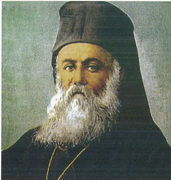
Ὁ Ἅγιος Ἐθνομάρτυς Μητροπολίτης Σμύρνης Χρυσόστομος, ὁ ὁποῖος ὑπέστη μαρτυρικὸ θάνατο στὶς 27 Αὐγούστου 1922 (π.ή.).

Μικρασιάτας εἶναι Ἅγιος καὶ Μάρτυρας ἀπὸ τὴν ἡμέρα τοῦ Μαρτυρίου του. Ἀπὸ τὰ Ἅγια χεράκια του ἔχω πάρει Ἀντίδωρο καὶ Πα- σχαλινὸ αὐγὸ. Τὸ Δεσποτικὸ πού ἔμενε ἦταν ἀπέριπτο καὶ φτωχό. Εἶχε τὰ πιὸ ἀπαραίτη- τα. Ἐνα μικρὸ τραπέζι, γιὰ γραφεῖο, μία κα- ρέκλα καὶ ἓνα ντιβάνι. Ἦταν σωστὸς Ποιμε- νάρχης. Μὲ τὰ μάτια μου εἶδα στὴν πλατεῖα τὸ μαρτύριό του, πού τὸν ἔσερναν στοὺς δρό- μους καὶ τὸν τεμάχιζαν οἱ φονιάδες καὶ ἀδί-