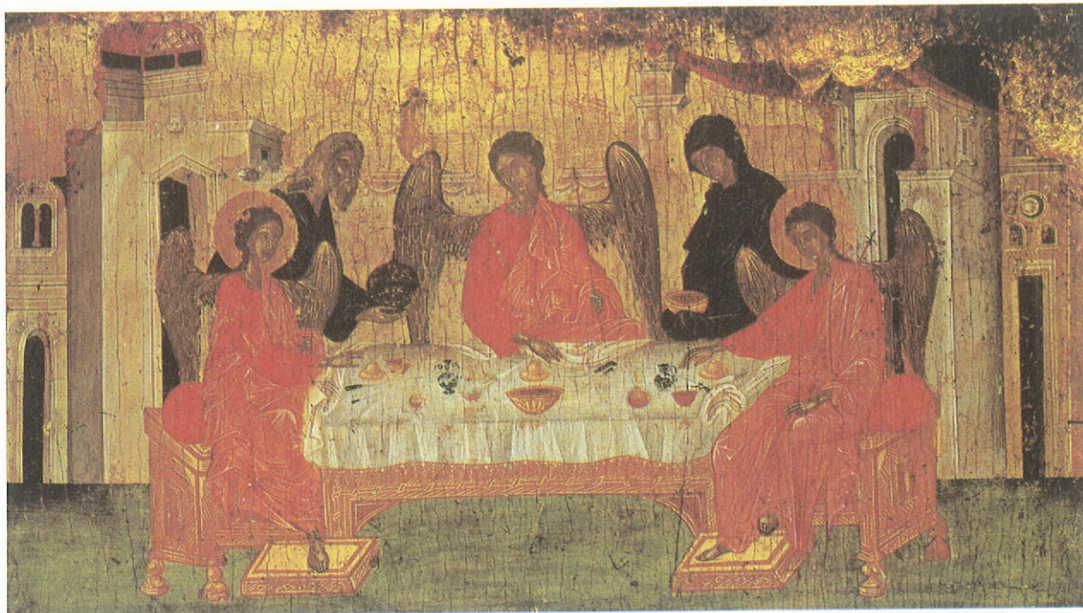
Περίχρηση προσώπων. «Ἡ φιλοξενία τοῦ Ἀβραάμ». Εἰκόνα τῆς ἐποχῆς τῶν Παλαιολόγων (14ος αἰώνας). Μουσεῖο Μπενάκη.

ἐλπίδα νὰ ἐπηρεάσουμε καὶ τὸ γενικευμένο σύμπτωμα μοναξιᾶς στὴ σημερινή μας κοινωνία. Καὶ ἀντὶ νὰ ἐπηρεαζόμαστε ἀπὸ τὰ ἐξωτερικά, ἔχοντας καλλιεργήσει τὰ ἐσωτερικά, μεταδίδουμε αὐτὸ τὸ κλίμα τῆς ἐσωτερικῆς οικειότητος καὶ πληρότητας ἀκροβατώντας καὶ ἰσορροπώντας σὲ δύσκολες καταστάσεις. Ποιὸς ξέρεῖ ἂν τελικὰ δὲν τὸ καταφέρουμε. Γι' αὐτὸ ὅμως θὰ χρειασθεῖ νὰ λάβουμε ὑπόψη κάποιες προτεραιότητες πρὸς αὐτὴ τὴν κατεύθυνση.