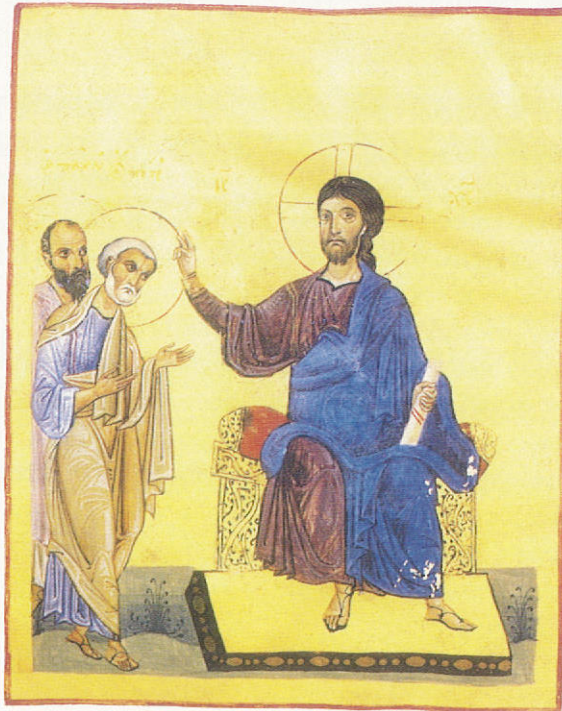
Ἡ κλήση τῶν Μαθητῶν. Εἰκόνα Βυζαντινοῦ Χειρογράφου.

στα τοῦ κληρικοῦ. Ὁ ὑποψήφιος ἐπιθυμεῖ νὰ ἀνταποκριθῆ στήν θεϊκὴ δίψα γιὰ ἐργάτες τοῦ ἀμπελῶνα Του καὶ σπεύδει νὰ προσφέρῃ τὸν ἑαυτό του. Ἄλλὰ συμφωνεῖ μὲ αὐτὸ ὁ Θεός; Δέχεται τὴν προσφορά; Μὲ ἄλλα λόγια, «ἔχει εὐλογία»; Ἐδῶ πρέπει ὁ ἐπίσκοπος καὶ ὁ πνευματικὸς καὶ ὁ λαὸς νὰ μιλήσουν, ὥστε νὰ ἐπιβεβαιώσουν τὴν κλήση. Ἄλλὰ νὰ μιλήσουν ὄχι σὰν ἄτομα, ἐκφράζοντας τὴν συμπάθεια ἢ ἀντιπάθειά τους, ἀλλὰ μὲ κριτή-