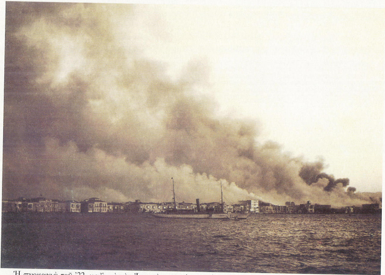
Ἡ πυρκαγιά τοῦ '22, μαζί μὲ τὴν Ἰωνική πρωτεύουσα, ἀποτέφρωσε καὶ τὰ ὄνειρα τοῦ Ἑλληνισμοῦ στὴ μικρασιατικὴ γῆ.

«Ἐπιτελοῦμεν τὸ ἱερὸν μνημόσυνον καὶ ὄλων μὲν ἐκείνων, ὅσοι ἀποβιβασθέντες ὡς ἐλευθερωταὶ εἰς τὰς γελοέσσας τῆς Ἰωνίας ἀκτὰς ἀπέθανον τὸν ζηλωτὸν ὑπὲρ πίστεως