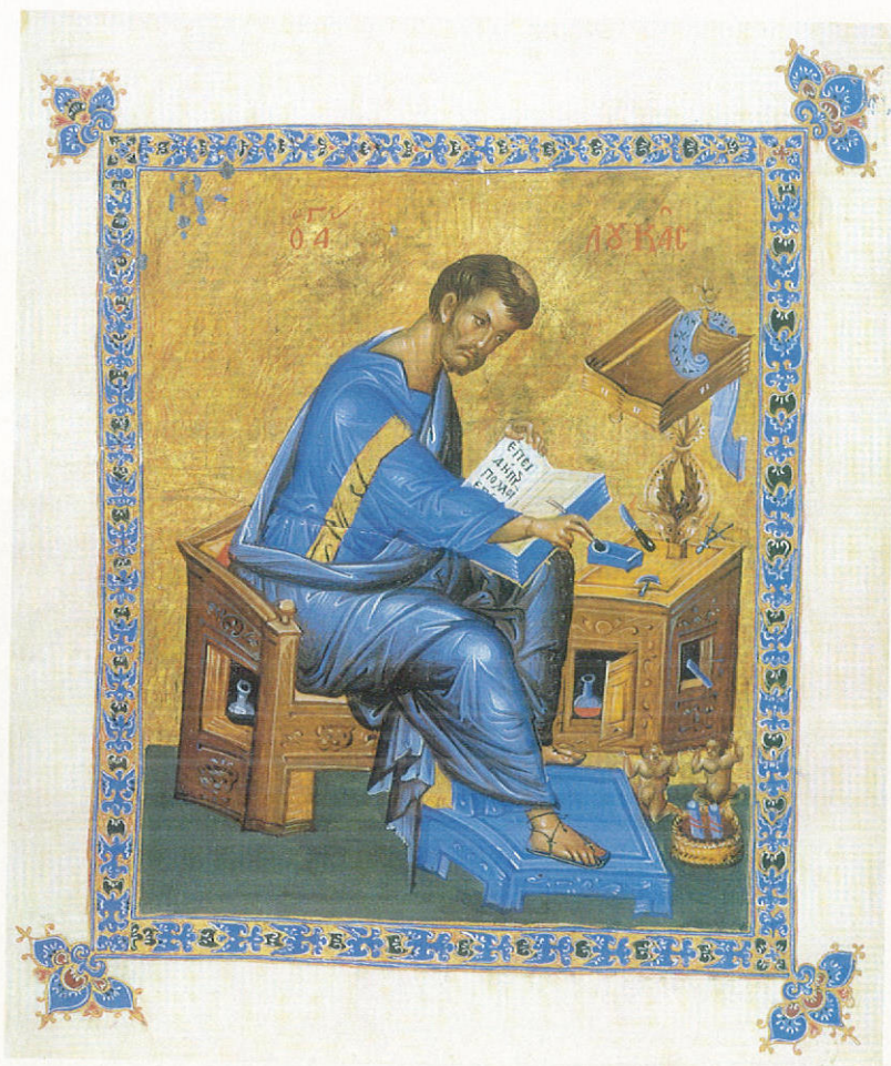
Ο Εὐαγγελιστὴς Λουκάς. Μικρογραφία βυζαντινοῦ χειρογράφου

Τὸν ὀρθὸ τρόπο τῆς προσευχῆς μᾶς τὸν ὑποδεικνύει ἡ σημερινὴ παραβολή, ὅπως αὐτὸς ἐνσαρκώνεται ἀπὸ τὸ πρόσωπο τοῦ Τελῶνη.