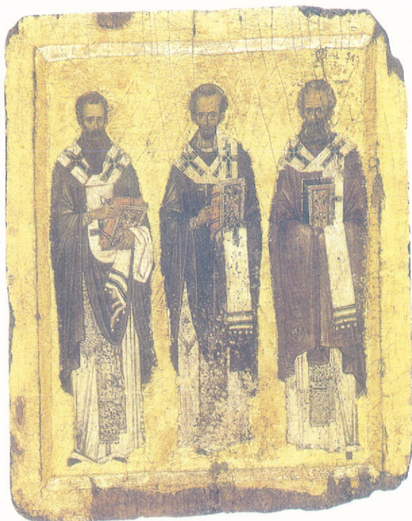
Οι Τρεις Ιεράρχες. Δεύτερο ήμισυ του 14ου αιώνα.

αυτοκράτορες του Βυζαντίου, τον Κωνσταντίνο και τον Ουάλεντα, οι οποίοι, και είναι πάρα πολύ βασικό αυτό, έπασχαν ως προς το Όρθοδοξο δόγμα, διότι ήσαν Άρειανόφρονες. Έγιναν επίσης καταστροφές μνημείων και από τον Άλάρικον, Βασιλέα των Γόθων, τότε όμως οι Όρθόδοξοι Χριστιανοί μετέτρεψαν, χωρίς να κατεδαφίσουν, τα αρχαία μνημεία σε ιερούς ναούς, για να τα προφυλάξουν. Όταν δε από την δράσιν των φυσικῶν φαινομένων (σεισμοί) κατέπιπταν βωμοί και ιερά των προγόνων μας, οι Όρθόδοξοι Χριστιανοί δεν είχαν κανένα πρόβλημα να ένσωματώσουν στους δικούς τους ναούς ύλικά των αρχαίων ναῶν (κιονόκρανα). Τελευταία έκδόθηκε ένα σπουδαιότατο βιβλίο-ντοκουμέντο για την δράση των Ίησουϊτών στην Ελλάδα. Εκεί αναφέρεται με συγκεκριμένα στοιχεία ή μανία καταστροφής των μνημείων του αρχαιοελληνικού πολιτισμοῦ από τους απεσταλμένους του Πάπα. Όπως καταλαβαίνει όμως ο καθένας, δεν είναι δίκαιο να χρεωθῆ ή Όρθόδοξη Έκκλησία τα άμαρτήματα του παπισμοῦ ούτε να απολογῆται για τα σφάλματά του. Θα ήταν λάθος