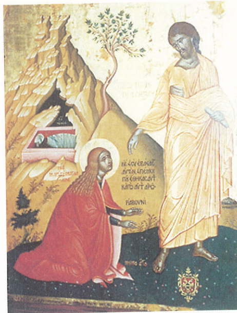
« Μὴ μὲν ἄπτου » Ὁ Ἰησοῦς ἐνώπιον τῆς Μαρίας Μαγδαληνῆς.

γονυκλισίας σύμφωνα μὲ τὸν 90ὸν Κανόνα τῆς Στ' Οἰκουμεικῆς – στὴν πρωΐα τῆς Κυριακῆς τῆς Πεντηκοστῆς, ἀσφαλῶς γιὰ λόγους ποιμαντικούς. Ἐπομένως, κατὰ τὴν ἄποψιν αὐτὴν ἢ ἀπαγόρευση τῆς γονυκλισίας κατὰ τὶς Κυριακὲς δὲν ἔχει ἀπόλυτο χαρακτήρα, ἀλλὰ δύναται νὰ παροραῖται χάριν ἄλλου πνευματικοῦ-ποιμαντικοῦ συμφέροντος. Ἡ θέση τοῦ Τρεμπέλα εἶναι ὄντως ὅτι «ἐφ' ὅσον ἐπετράπη ἢ μετάθεσις τοῦ Ἑσπερινοῦ εἰς τὴν πρωΐαν, ἢ ἀπαγόρευσις τῆς γονυκλισίας εἶναι σχετικὴ καὶ ἐπιδέχεται ἐξαιρέσεις καὶ ἐλαστικότητα». Καὶ ὁ ἅγιος Νικόδημος ὁ Ἀγιορείτης γράφει ὅτι «οἱ εὐχὲς τῆς γονυκλισίας δὲν πρέπει νὰ ἀναπέμπονται τὴν πρωΐαν, διότι τοιουτοτρόπως καταστρατηγεῖται ἢ ἀπαγορεύσις τῆς γονυκλισίας» (« Διὸ οἱ τὰς εὐχὰς ταύτας ἀναγιώσκοντες τὸ πρωῖ, κακῶς καὶ ἡμαρτημένως καὶ παρὰ τοὺς ἰ. κανόνας ποιοῦσιν » (Πηδάλιον, σ. 151). Ἐπὶ πλέον, εἶναι γνωστὸν ὅτι ἡ Ἐκκλησία ἔχει ἀποδεχθῆ τὶς προσκυνηματικὲς μετάνοιες κατὰ τὶς Κυριακὲς.