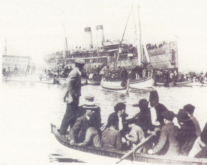
Οἱ Ἕλληνες τῆς Σμύρνης ὑποδέχονται μὲ ἐνθουσιασμό τοὺς στρατιῶτες, πὺ ἀποβιβάζονται ἀπὸ τὸ ἀτμόπλοιο «Πατρίς».

μακρινὲς γωνιὲς τῆς Μ. Ἀσίας, καθὼς τόσο ἡ Α.Θ.Π. ὁ Σεπτὸς Οἰκουμενικὸς Πατριάρχης κ. Βαρθολομαῖος, ὅσον καὶ Σεβ. Ἀρχιερεῖς τοῦ Οἰκουμενικοῦ Πατριαρχείου ἢ καὶ εὐλαβεῖς Προσκυνητὲς Κληρικοὶ ἐκ τῆς Ἑλλάδος, προσκαλούμενοι μάλιστα μερικὲς φορὲς ἀπὸ φορεῖς τῆς τουρκικῆς τοπικῆς αὐτοδιοική-