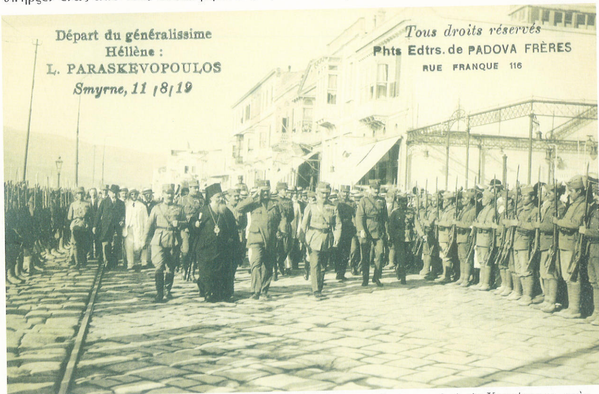
Ό Σμυρναίος άρχιστράτηγος Λεωνίδας Παρασκευόπουλος, συνοδευόμενος από τον Χρυσόστομο, στην προκυμαία, λίγο πριν άναχωρήσει για τό μέτωπο.

«Παρόμοια καταστροφή και τέτοιους βανδαλισμούς ούτε ό καλύτερος ζωγράφος δέν