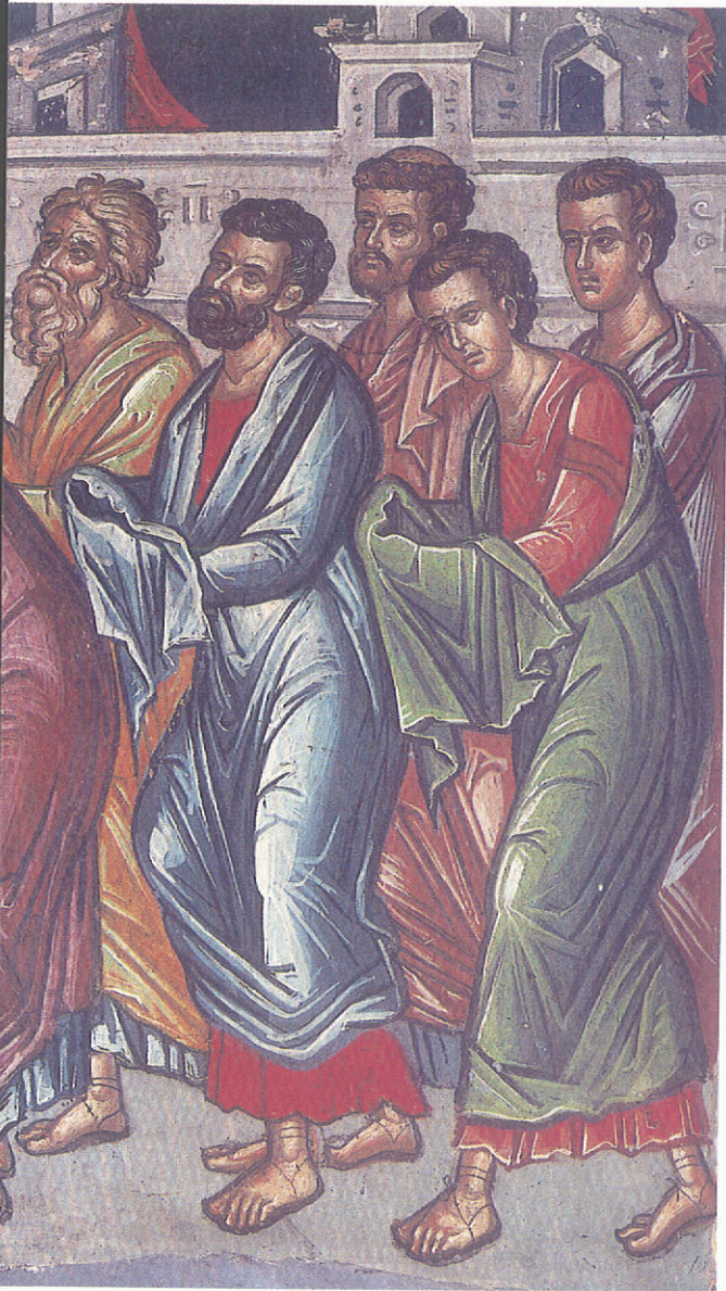
Θεοφάνους τοῦ Κρητῶς (1546). "Ἁγιον Ὄρος, Μονή

Πρὶν προχωρήσουμε εἶναι χρήσιμο νὰ δοῦμε τί ἔννοοῦν οἱ Ἱ. Κανόνες μὲ τὴν λέξη γονυκλισία. Ἡ γονυκλισία κατ' ἀρχὴν εἶναι ἀρχαία εὐλαβὴς συνήθεια, μὲ τὴν ὁποίαν οἱ προσευχόμενοι ἄνθρωποι ἐξεδήλωναν τὴν πίστιν των. Ἡ γονυκλισία διακρίνεται σὲ δύο εἶδη. Πρῶτον, ὅταν ὁ προσευχόμενος ἄνθρωπος κύπτει ἀπλῶς τὸν ἀχένα ἢ καὶ κάμπτει τὰ γόνατά του καὶ κρατεῖ ὄρθιο καὶ πρὸς τὰ