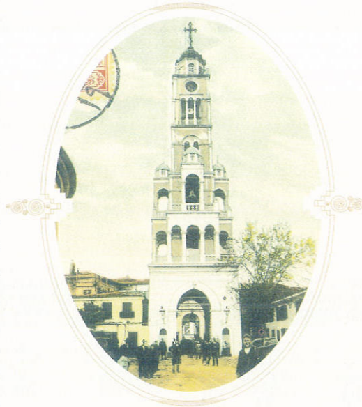
Ὁ ἱ. ναὸς τῆς Ἁγίας Φωτεινῆς (Σμύρνη).

Σὲ πολλὰ σχολεῖα τῆς Μικρᾶς Ἀσίας τὸ σχολικὸ πρόγραμμα ἀρχίζε καὶ τελείωνε μὲ λατρευτικὲς συνάξεις. Χαρακτηριστικὸν εἶναι ὅτι ὁ Μητροπολίτης Ἐφέσου Ἀγαθάγγελος ὁ Μάγνης ἤδη τὸν 19 αἰῶνα κατὰ πρωτοποριακὸν τρόπο διεκήρυττεν, ὅτι εἶναι ἀναγκαῖα καὶ ἡ ἴδρυσις νηπιαγωγείων «ὡς συνάδουσα πρὸς τὰς ἀπαιτήσεις τοῦ νεωτέρου πολιτισμοῦ καὶ λυσιτελεστάτη τυγχάνουσα τῇ μαθητιώσῃ νεολαίᾳ». Ὁ ἀείμνηστος Ἀρχιεπίσκοπος Ἀθηνῶν Χρυσόστομος Χατζησταύρου, ὅταν ἦταν Μητροπολίτης Ἐφέσου, ἀπὸ τὶς στήλες τοῦ περιοδικοῦ «Ἐφεσος» ἐπαινεῖ καὶ συγχαίρει τὶς κυρίες τῆς Ἱ. Μητροπόλεως του, διότι «πρώτιστον μέλημα αὐτῶν ἔθεσαν τὴν ἀνασυγκρότησιν τῶν Σχολῶν».