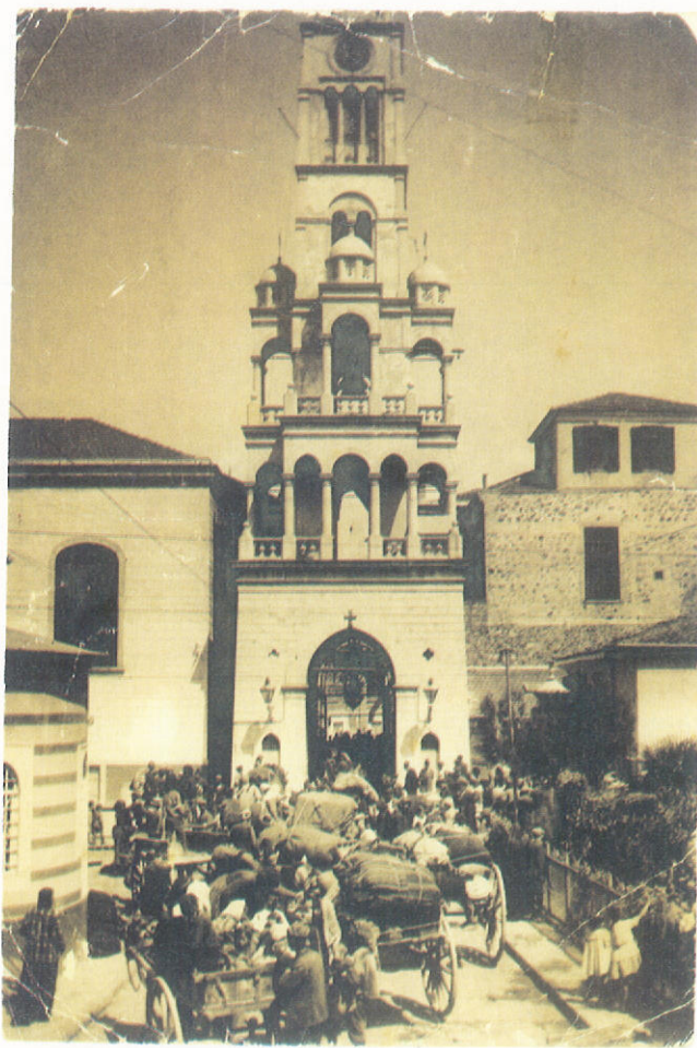
Πρόσφυγες ἀναζητοῦν καταφύγιο στὸ προαύλιο τῆς Ἁγίας Φωτεινῆς.

θείας τοῦ Μικρασιατικοῦ Ἑλληνισμοῦ. Εἶναι πασίγνωστα πολλὰ ἑλληνορθόδοξα ἐκπαιδευτήρια τῆς Μικρᾶς Ἀσίας, πού ἀκτινοβολοῦν, ὅπως ἀκτινοβολοῦσε καὶ ἡ Μεγάλῃ τοῦ Γένους Σχολὴ τῆς Κωνσταντινουπόλεως ἡ ἡ, ὡς μὴ ὄφελεν, ἀκόμη κλεισμένη Θεολογικὴ Σχολὴ τῆς Χάλκης. Ὀρθῶς ἔχει τοιμισθῆ, ὅτι οἱ Ἕλληνες τῆς Μικρᾶς Ἀσίας σὲ κάθε γωνιὰ κτίζουν «τὰ δύο ἔθνικά τους κάστρα: μιὰ