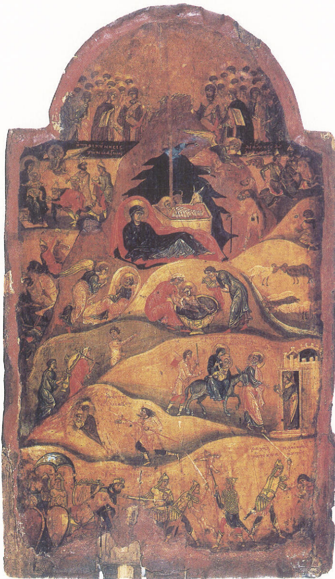
Ἡ Γέννηση τοῦ Χριστοῦ. Ἱερὰ Μονὴ Ἁγίας Αἰκατερίνης Σινᾶ, 11ος-12ος αἰῶνας.

• Μνήσθητι, Κύριε, τῶν πτωχῶν, τῶν πεινῶντων καὶ γυμνητευομένων, τῶν στερουμένων ἱατρικῶν καὶ φαρμακευτικῶν φροντίδων καὶ τῶν παραπλήσιον θανάτου