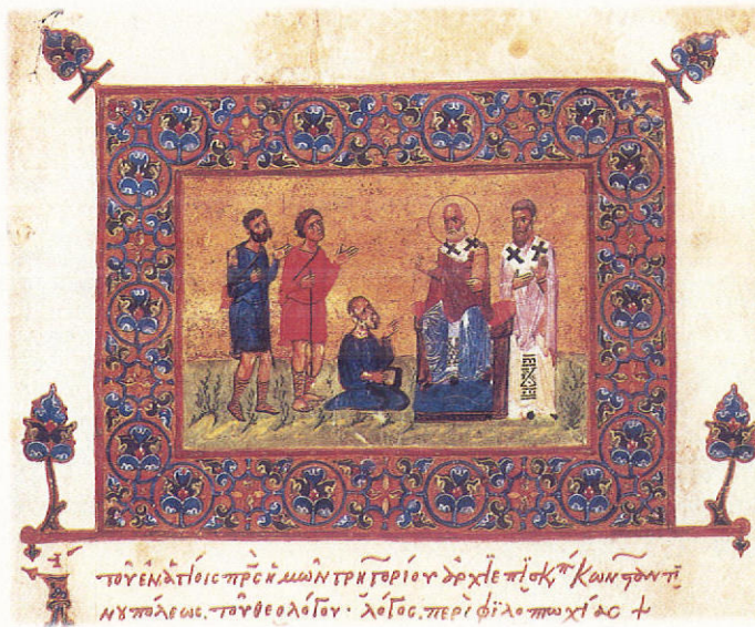
Ὁ ἅγιος Γρηγόριος ὁ Θεολόγος. Μικρογραφία εἰκονογραφημένου χειρογράφου (κώδ. 6, φ. 257α) τοῦ 12ου αἰ. Ἰ. Μονὴ Παντελεήμονος.

ἄς ζήσωμεν μαζί με τὸν Χριστόν, ἄς γεννηθῶμεν μαζί του, ἄς σταυρωθῶμεν καὶ ἄς ταφῶμεν μαζί του, διὰ τὰ ἀναστηθῶμεν με τὴν ἀνάστασίν του. Διότι πρέπει τὰ ὑπομείνω τὴν ἀντίστροφον πορείαν, ἢ ὁποῖα ὁδηγεῖ εἰς τὸ ἀγαθόν. Καὶ ὅπως ἀπὸ τὰ πρὸ εὐχάριστα ἦλθαν τὰ δυσάρεστα, ἔτσι καὶ ἀπὸ τὰ δυσάρεστα τὰ ἐπανέλθουν τὰ πρὸ εὐχάριστα. “Διότι ἐκεῖ ὅπου ηὐξήθη σημαντικὰ ἡ ἀμαρτία, ἐκεῖ ἐδόθη πλουσιοπάροχα καὶ ἡ χάρις”. Καὶ ἂν ἡ γεῦσις ἐπέφερε τὴν καταδίκην, δὲν ἐδικαίωσε, πολὺ περισσότερο τὸ πάθος τοῦ Χριστοῦ; Ἄς ἐορτάζωμεν ἐπομένως ὄχι με δημοσίας πανηγύρεις, ἀλλὰ κατὰ τρόπον θεϊκόν. Ὅχι κατὰ τρό-