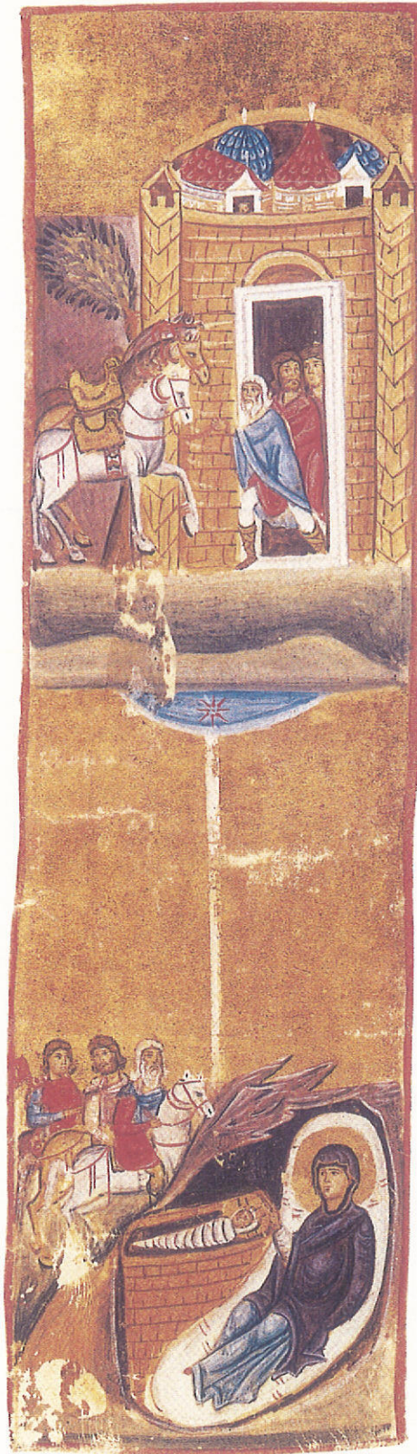
Ἡ Γέννηση τοῦ Χριστοῦ. Μικρογραφία Μηνολογίου (κῶδ. 14, φφ. 405β, 404α, 11ος αἰ.).

Ἅγιος Γρηγόριος ὁ Θεολόγος (Νεοελληνικὴ ἀπόδοση: Ν. Ἀποστολάκης)