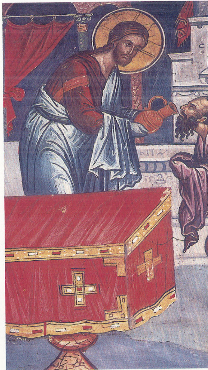
Ἡ Κοινωνία τῶν ἀποστόλων (δεξιὸ τμήμα), ἔργο τοῦ Σταυρουκίττα, καθολικὸ (κεντρικὴ ἀψίδα ἱεροῦ).

μιὰ ἀναλυτικὴ καὶ ἀντικειμενικὴ παρουσίαση τῶν διαφόρων πτυχῶν τοῦ θέματος στὴν προσπάθειά μας νὰ ὀρίσουμε τὸ ὀρθόν, ποὺ πρέπει οἱ πιστοὶ μας νὰ ἀκολουθήσουν.