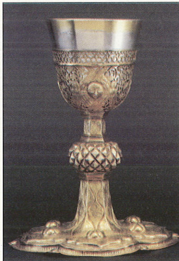
Δισκοπότηρο (Β' μισό 17ου αἰ.).

σικῆ 38 καὶ τὸ μονόφωνο χορικό ἄσμα 39 , ὁ πιὸ συνηθισμένος τρόπος ψαλμωδίας στήν ἀρχαία Ἐκκλησία ἦταν ἡ λεγομένη καθ' ὑπακοὴν ψαλμωδία. Ὁ κορυφαῖος, δηλαδή, τοῦ χοροῦ ἔψαλλε κατὰ σειράν τοὺς στίχους ἑνὸς ψαλμοῦ καὶ ὁ λαὸς ἀπαντοῦσε μέ μιὰ παρεμβαλλόμενη φράση ὡς ἐφύμνιο (ρεφραίν) 40 . Ἡ φράση αὐτὴ ὀνομαζόταν ὑπακοή καὶ μπορεῖ νὰ ἦταν ἓνας κατ' ἐπιλογὴν ἢ ὁ ἀκροτελεύτιος στίχος 41 τοῦ ἀδομένου ψαλμοῦ, ποὺ περιεῖχε μιὰ ὑψηλὴ ἀλήθεια 42 . Μέ τὸν τρόπο αὐτὸ ὁ λαὸς διευκολυνόταν ὄχι μόνο στήν πρόσληψη τοῦ κεντρικοῦ πνευματικοῦ μηνύματος τοῦ ψαλμοῦ, ἀλλὰ καὶ στήν ψαλμώδησή του, ἀφοῦ πρακτικὰ ἦταν ἀδύνατο νὰ τὸν γνωρίζει καὶ νὰ τὸν ψάλλει ὁλόκληρο. Κατὰ τὸν τύπο δὲ τῆς ἀγγελικῆς ἀντιφωνικῆς χοροστασίας 43 καὶ πρὸς διαποικίληση τοῦ μέλους, εὐρύτατα διαδομένη στήν ἀρχαία Ἐκκλησία ἦταν καὶ ἡ ἀντιφωνικὴ ψαλμωδία.