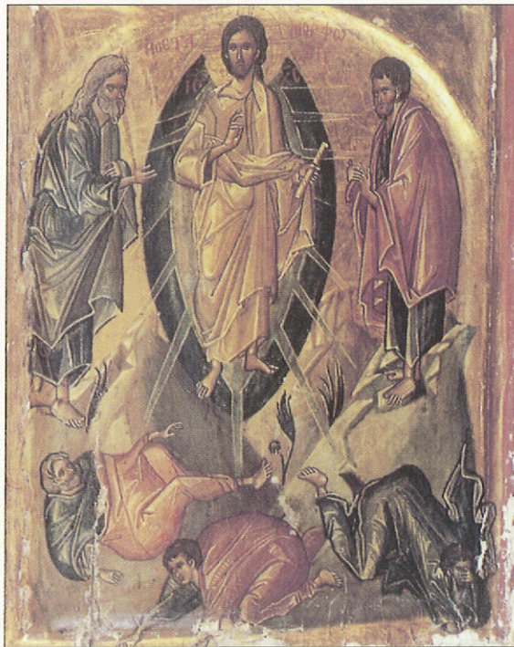
Μεταμόρφωση, 6 ος μισὸ 14ου αἰ. Ἱερὰ Μονὴ Ἁγίας Αἰκατερίνης, Σινᾶ.

Ὁ ἴδιος ὁ Κύριός μας ὁ Ἰησοῦς Χριστός, ἄλλωστε, μεταχειρίστηκε μιὰ θαυμαστά προσαρμοσμένη στὴν ἀνάγκη μέθοδο γιὰ νὰ βοηθήσει τοὺς ἁγίους Ἀποστόλους νὰ καταλάβουν αὐτὸ τὸ θέμα. Τοὺς εἶπε: «Εἴ τις θέλει ὀπίσω μου ἔλθειν, ἀπαρνησάσθω ἑαυτὸν, καὶ ἀράτω τὸν σταυρὸν ἑαυτοῦ, καὶ ἀκολουθεῖτω μοι. Ὃς γὰρ θέλει τὴν ψυχὴν αὐτοῦ σῶσαι, ἀπολέσει αὐτήν· ὃς δὲ ἀπολέσῃ τὴν ψυχὴν αὐτοῦ ἕνεκεν ἐμοῦ, εὐρήσει αὐτήν». Ἡ ἐντολὴ αὐτὴ τοῦ Χριστοῦ εἶναι σωτήρια· ἀρμόζει σὲ διαλεκτοὺς, ἐξασφαλίζει τὴν αἰώνια δόξα, κάνει νὰ περιμένει κανεὶς μὲ λαχτάρια τὸ τέρας τοῦ βίου. Γιατὶ ἡ ἐπιλογή τοῦ πάθους γιὰ χάρι τοῦ Χριστοῦ δὲ μένει χωρὶς ἀνταπόδοση· ἀντίθετα, ἔχει ὡς ἀποτέλεσμα τὴν ἀπόλαυση τῆς αἰώνιας ζωῆς καὶ δόξας.