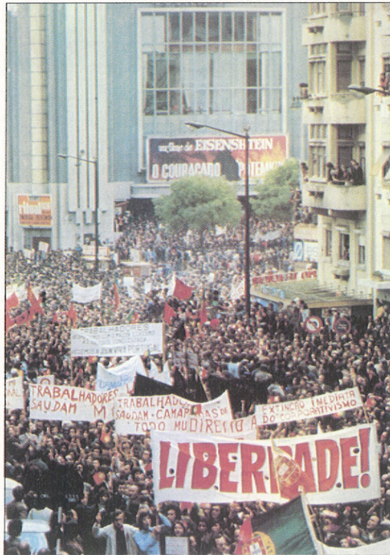
Κοινωνικὲς ἐκδηλώσεις μὴ συμμόρφωσης.

Ἡ Ποιμαντικὴ Θεολογία ἀποτελεῖ οὐσιαστικὸ ὄργανο ποιμαντικῆς προσαρμογῆς τῆς Ἐκκλησίας, διότι χρέος