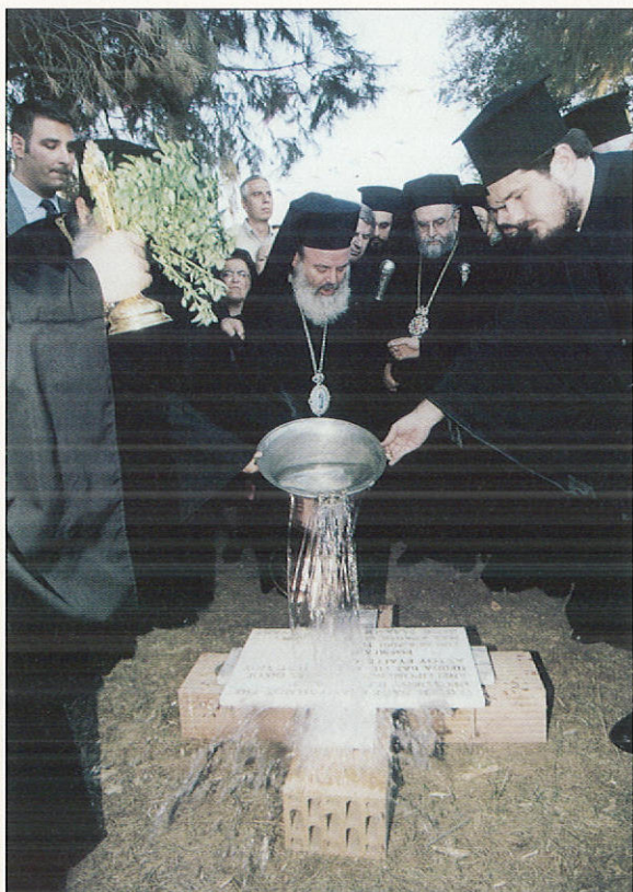
Άπο τὰ ἐγκαίνα ναοῦ στό Θριάσιο Νοσοκομεῖο (25/6/2001)

❶ Μὲ ἀσθενὴ στό Θριάσιο Νοσοκομεῖο (26/6/2001)