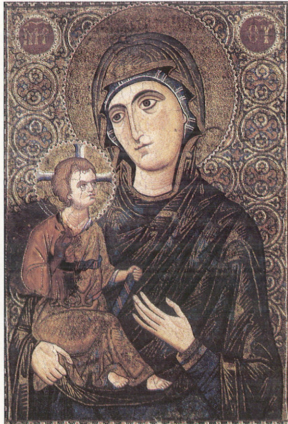
Θεοτόκος Βρεφοκρατοῦσα (ψηφιδωτὴ εἰκόνα), 6 μισὸ 12ου - ἀρχὲς 13ου αἰ. Σινᾶ, Ἱερά Μονὴ Ἁγίας Αἰκατερίνης.

3. Αὐτὰ ὅλα ὅμως καθόλου δὲν σημαίνουν ὅτι ὁ ἅγιος Δαμασκηνὸς δὲν παραδέχεται καὶ δὲν ὀμιλεῖ διὰ τὴν ἀγιότητα τῆς Παναγίας Θεοτόκου. Τοῦναντίον μαζί με ὅλην τὴν Ὀρθόδοξον Ἐκκλησίαν καὶ αὐτὸς ἐξάγει καὶ δοξάζει πολὺ τὴν προσωπικὴν ἀγιότητα τῆς Παναγίας, ἀλλὰ δεικνύουν μόνον τὸ πόσον μακρὰν εἶναι ὁ ὀρθόδοξος ἱερός Πατὴρ ἀπὸ τὴν νεωτέραν αἰρετικὴν δοξασίαν τῆς Ρωμαϊκῆς Ἐκκλησίας περὶ τῆς «ἀσπίλου συλλήψεως» τῆς Παναγίας καὶ τῆς γεννήσεώς τῆς ἄνευ τοῦ προπατορικῆς ἁμαρτή-