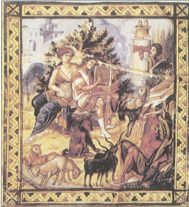
Ὁ Δαβὶδ παίζει τὴ λύρα συντροφιά μὲ τὴ Μελωδία, κώδ. gr. 139 (Ψαλτήριον), φ. 16', πρῶτο μισὸ 10ου αἰ. Παρίσι, Bibliothèque Nationale.

Ὅπως σημειώσαμε καὶ πρὶό πάνω, οἱ Ἱερεῖς καὶ οἱ Ἱεροψάλτες ἐκπροσωποῦν τὸ λαὸ στὰ ἐν τῶ ναῶ τελούμενα, καθήκον, ὅπως ἀντιλαμβάνεται κανεὶς, ὑψηλὸ καὶ μέγιστο. Κυρίως οἱ Ἱεροψάλτες, ποὺ κατεξοχὴν ψάλλουν στὸ ναὸ καὶ εἶναι ἐπιφορτισμένοι μὲ τὴν ἐκτέλεση τῶν ὕμνων τῆς Ἐκκλησίας, πρέπει νὰ συνειδητοποιήσουν ὅτι δὲν τοποθετήθηκαν τυχαῖα στὴν κορυφαία καὶ περίζηλη αὐτὴ θέση, ἀλλὰ θεωροῦνται μέλη ἀναπόσπαστα τῆς λειτουργικῆς πράξης, παράγοντες τῆς ὁμαλῆς διεξαγωγῆς τῆς θείας Λατρείας. Πρέπει,