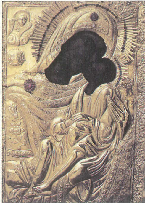
Ἡ εἰκόνα τῆς Παναγίας τῆς Λιμνιάς.

κώνει ἀφροὺς καὶ ἡ πρύμνη ἀφήνει ἄσπρες λωρίδες. Οἱ γλάρου φτεροκοποῦν καὶ διαγράφουν «αἶνους στὸ γαλάξιο τοῦ οὐρανοῦ», τὰ δελφίνια παίζουν στὰ κύματα καὶ οἱ ναῦτες, χωρὶς νὰ ξέρουν τὸ γιατί, ἀφήνουν εὐφρόσυνους ἀμανέδες ν' ἀκουσθοῦν μέσα στὰ πέλαγα. Ἡ Θεότοκος Μαρία, μὲ ἀόρατη ἀγγελικὴ συνοδεία καὶ ἕμψωτα, συνεκάλεσε τὴν ἄλογη καὶ ἔλλογη κτίση σὲ δοξολογία τοῦ Τριαδικοῦ Θεοῦ, μὲ τὸν τρόπο του κάθε κτίσμα, κατὰ ἀναλογία μὲ τὴ γνώση ἢ τὴν ἄγνοιά του ὁ λοστρόμος μὲ τὸν εὐσεβῆ ψαλμὸ στὸ στόμα καὶ οἱ