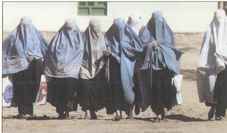
Παράδειγμα ἄρνησης προσαρμογῆς, γιὰ λόγους θρησκευτικούς: Οἱ γυναῖκες στὶς μουσουλμανικὲς χώρες κινλοφοροῦν φορώντας πάντοτε τὴν «μπούκα».

Ὡς ἐκ τούτου, θεωρήσαμε λίαν σκόπιμο καὶ χρήσιμο, σὲ μιὰ σειρά ἀρθρων στὸ ἀνανεωμένο περιοδικὸ «ΕΦΗΜΕΡΙΟΣ», νὰ ἀσχοληθοῦμε μὲ τὸ σοβαρὸ αὐτὸ θέμα τῆς προσαρμογῆς τῆς Ἐκκλησίας.