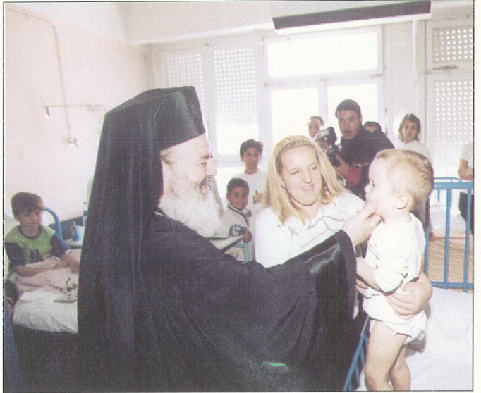
Στιγμιότυπο από την επίσκεψη στο Νοσοκομείο Παίδων (25.4.2000).

⑤ Από την επίσκεψη στο 39ο Γυμνάσιο - 30ο Λύκειο Κυψέλης (14.4.2000).