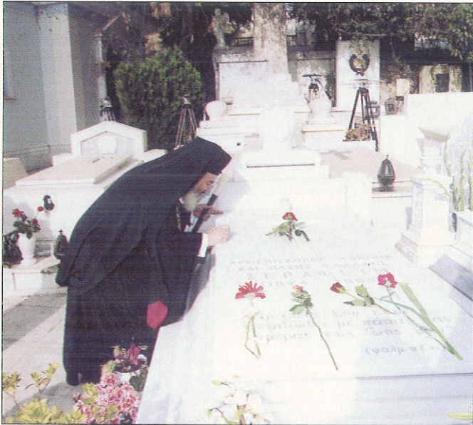
Άπο τήν τέλεση Τρισαγίου στήν μνήμη τοῦ Μακαριστοῦ Ἀρχιεπισκόπου Ἀθηνῶν καὶ πάσης Ἑλλάδος κυροῦ Σεραφεῖμ.