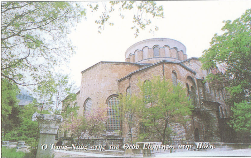
Ὁ Ἅγιος Ναός «τῆς τοῦ Θεοῦ Εὐλογίας», στὴν Ἱερὴ.

Γι' αὐτό, παρὰ τὰ χρόνια πού πέρασαν, παρὰ τὴ διαδοχὴ τῶν γενεῶν, κρυπτοχριστιανικὲς κοινότητες, ἀλλὰ καὶ μεμονωμένα ἄτομα, διατηρήθηκαν στὸ χώρο τῆς ἀποκρυφίας ἴσαμε τὶς ἀρχὲς τοῦ 20οῦ αἰῶ-