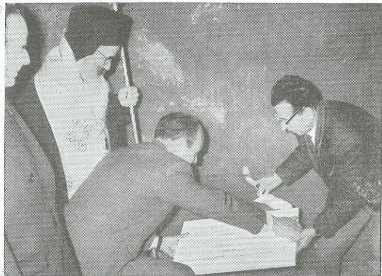
Στιγμιότυπον ἀπὸ τὴν κατάθεσιν τοῦ θεμελίου λίθου τῆς νέας πτέρυγος τοῦ Νοσηλευτικοῦ Ἰδρύματος Κληρικῶν Ἑλλάδος.

Ἐν συνεχείᾳ, ὁ Μακαριώτατος, μετὰ τῶν Σεβασμιωτάτων Ἱεραρχῶν καὶ τῶν λοιπῶν προσεκλημένων ἐξῆλθον εἰς τὸν περίβολον τοῦ Ἰδρύματος, ἔνθα ὁ Μακαριώτατος ἔθεσε τὸν θεμέλιον λίθον τῆς νέας πτέρυγος τοῦ ΝΙΚΕ, ἐν μέσῳ συγκινητικῆς ἀτμοσφαιρας.