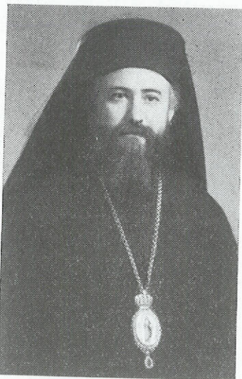
Ο ΑΛΕΞΑΝΔΡΟΥΠΟΛΕΩΣ ΚΩΝΣΤΑΝΤΙΟΣ

Ἐγενήθη εἰς Σκεπαστὸν Καλαβρύτων τὸ ἔτος 1906. Πτυχιούχος τῆς Θεολ. Σχολῆς τοῦ Πανεπιστημίου Ἀθηνῶν. Ὑπηρέτησεν ὡς Ἱεροκλήρυξ τῶν Ἱ. Μητροπόλεων Φιλίππων καὶ Νεαπόλεως καὶ Καλαβρύτων καὶ Αἰγιαλείας καὶ ὡς στρατιωτικὸς Ἱερὸς κατὰ τὸν Ἑλληνοϊταλικὸν πόλεμον. Ἀνέπτυξε πλουσίαν θρησκευτικὴν, ἔθνικὴν καὶ φιλανθρωπικὴν δρᾶσιν ἰδίᾳ κατὰ τὴν κατοχὴν. Ἐχρημάτισε τοποτηρητὴς τῆς Ἱ. Μητροπόλεως Ζιγῶν.