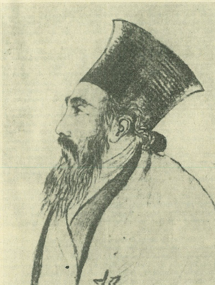
Ὁ Μητροπολίτης Οὐγγροβλαχίας Ἰγνάτιος