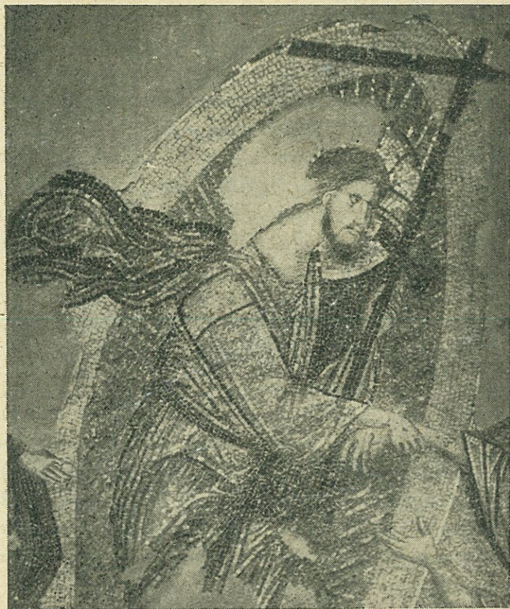
Ἡ Ἀνάστασις (εἰς Ἄδου κáθοδος) ἐκ τοῦ ναοῦ ἁγ. Ἀποστόλων Θεσσαλονίκης. Λεπτομέρεια. Ὁ Χριστὸς ἐγείρων τὸν Ἀδάμ — 14ος αἰών.