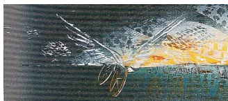
Κάστρο II νυχτερινό (λεπτομέρεια)

Μέ τά αἰσθήματα αὐτά, τῆς χαρμολύπης καί τοῦ χαροποιοῦ πένθους, ἄς προσεγγίσουμε τά γεγονότα τῶν ἡμερῶν αὐτῶν. Μέ σιωπή καί κατάνυξη ἄς βιώσουμε τό ἄφατο μυστήριο τοῦ Θεοῦ Πάθους· νά ἀποθέσουμε στά πόδια τοῦ Ἐσταυρωμένου τίς ὅποιες φοβίες καί φόβους πού μᾶς κατακλύζουν κατά τή δύσκολη ἐποχή μας· νά Τόν ἀτενίσουμε μέ ἐμπιστοσύνη καί νά Τόν ἱκετεύσουμε μέ ὅλη τήν θέρμη τῆς καρδιάς μας· Κύριε, Σῶσε μας, ὅπως γνωρίζεις, καί δεῖξε μας τόν τρόπο νά τό κατανοήσουμε. Συγχώρεσέ μας πού ξεχνοῦμε ὅτι ἡ κάθε μέρα εἶναι δική σου μέρα καί πνιγόμαστε στίς ἔγνοιες καί τίς ἀμφιβολίες!