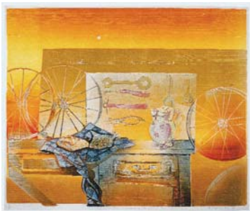
Κολατσιό ΙΙ (Σάββατα)