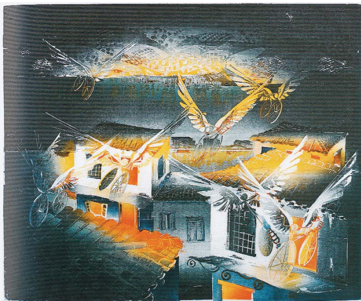
Κάστρο II (νυχτερινό)

Στὸ Τριῶδιο βρῖθουν οἱ προτροπές γιὰ νηστεία, ἐγκράτεια παθῶν, μετάνοια, προσευχή, μὲ ἀπώτερο ὅμως στόχο πάντοτε τὴν ἔμπρακτὴ ἀγάπη, ἐνώπιον τοῦ Χριστοῦ πού ἔδωκεν «ἐαυτὸν ἀντίλυτρον ὑπὲρ πάντων» διὰ τὴν ἡμῶν σωτηρίαν.