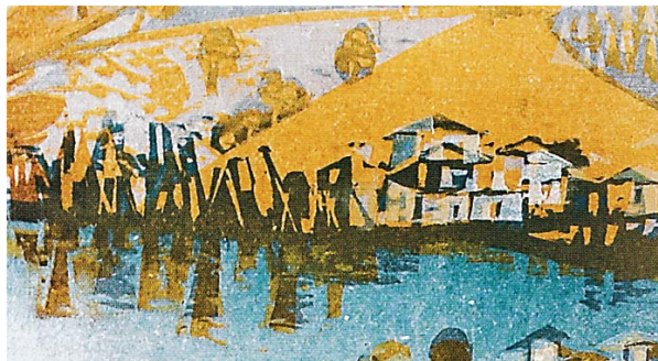
Μονές νησιού (λεπτομέρεια)