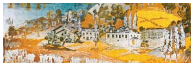
Μονές νησιοῦ (λεπτομέρεια)

ΣΗΜΕΙΩΣΕΙΣ: 1. J. Magness, The Archaeology of the Holy Land From the Destruction of Solomon's Temple to the Muslim Conquest , United States of America, 2012, σ. 22. 2. Χρῦσανθος, Ἱστορία καὶ περιγραφή τῆς Ἁγίας Γῆς καὶ τῆς Ἁγίας πόλεως Ἱερουσαλήμ , Ἑνετίησι 1728, σ. 43. 3. Χρῦσανθος, ὁ.π., σ. 44.