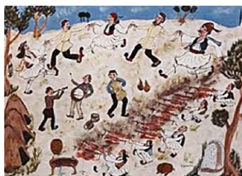
Εὐγενίου Σπαθάρη, Πάσχα Ἑλληνικό

ΣΗΜΕΙΩΣΕΙΣ: 15. ΓΙΑΝΝΑΡΑΣ, ΧΡ., Τό ρητό καί τό ἄρρητο , ὁ.π., σ. 178, 179. 16. ΓΙΑΝΝΑΡΑΣ, ΧΡ., Ἡ Εὐρώπη γεννήθηκε ἀπό τό «Σχίσμα», ἐκδ. Ἰκαρος, Ἀθήνα 2015, σ. 57, 59. 17. ΓΙΑΝΝΑΡΑΣ, ΧΡ., Τό ρητό καί τό ἄρρητο , ὁ.π., σ. 92. 18. Ὁ.π., σ. 93. 19. ΖΗΖΙΟΥΛΑΣ, Ι. Δ., Μαθήματα Χριστιανικῆς Δογματικῆς Ι (Σημειώσεις πανεπιστημιακῶν παραδόσεων), Τμήμα Ποιμαντικῆς τῆς Θεολογικῆς Σχολῆς ΑΠΘ, ἀκαδ. ἔτος 1984-85, Θεσσαλονίκη, σ. 48. 20. ΓΙΑΝΝΑΡΑΣ, ΧΡ., Τό ρητό καί τό ἄρρητο , ὁ.π., σ. 51. 21. «Ὁ πάσης τῆς κτίσεως καί ἐμπαθοῦς διαθέσεως τήν ἑαυτοῦ καρδίαν ἀποκαθῆρας, ἐν τῷ ἰδίῳ κάλλει τῆς θείας φύσεως καθορᾶ τήν εἰκόνα» Ἀγ. Γρηγορίου Νύσσης, Εἰς τήν προσευχήν , Λόγος στ', PG 44, 1269 C. 22. «... ἀνθρώπους μόνον κυρίως καί ἀληθῶς ἀποδείξας, κατ' αὐτόν δι' ὄλου μεταμορφωμένους καί σώαν αὐτοῦ καί παντελῶς ἀκίβδηλον τήν εἰκόνα φέροντας» Ἀγ. Μαξίμου τοῦ Ὁμολογητοῦ, Περί διαφόρων ἀποριῶν τῶν Ἀγίων Διονυσίου καί Γρηγορίου πρὸς Θωμᾶν τόν ἡγιασμένον (Ambiguorum liber), PG 91, 1312 A-B. 23. ΕΥΔΟΚΙΜΟΝ, PAUL, Τό Ἅγιο Πνεῦμα στήν Ὁρθόδοξη Παράδοση (μετάφρ. πρεσβ. Στέλλας Κ. Πλευράκη), 3 η ἔκδοσι, Θεσσαλονίκη 1991, σ. 25. 24. «Πείραν δέ λέγω, αὐτήν τήν κατ' ἐνέργειαν γνῶσιν, τήν μετά πάντα λόγον ἐπιγινομένην αἴσθησιν δέ, αὐτήν τοῦ γνωσθέντος μέθεξιν, τήν μετά πᾶσαν νόησιν ἐκφαινομένην» Ἀγ. Μαξίμου τοῦ Ὁμολογητοῦ, Ἐρωτήσεις πρὸς Θαλάσιον , PG 90, 624 A. 25. Πρὸς Κορινθίους Α' , 8, 2-4. 26. ΕΥΔΟΚΙΜΟΝ, ὁ.π., σ. 27.