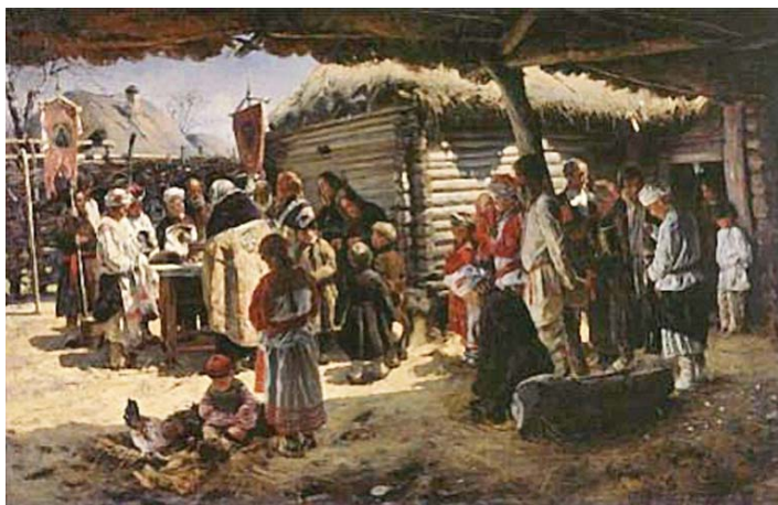
Vladimir Makovski, Ἀνάσταση, 1887

Γεώργιος Τσακαλίδης Δρ Θεολογίας - Θρησκευοπαιδαγωγός