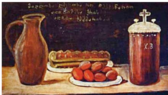
Niko Pirosmiani, τό πασχαλιάτικο άρνί, λεπτομέρεια

μπορεί νά στηρίζεται σε προτροπές τής πνευματικής ήγεσίας προς τούς άλλους, αλλά προϋποθέτει προσωπικό παράδειγμα. Άποτελεί χαρακτηριστικό των διεφθαρμένων ήγεσιών νά προτρέπουν τόν λαό σε θυσίες σε περιόδους κρίσης, ένω οι κατέχοντες τήν έξουσία διαφυλάσσουν στό άκέραιο τά προνόμιά τους. Έτσι όμως, ένας λαός έξευτελίζεται, καθώς, άπογοητευμένος άπό τούς ήγέτες του, γίνεται εύάλωτος στις όποιες έξωτερικές έπιβουλές. Γι' αυτό ό προφήτης δέν έξαιρει άπό τό προσκλητήριό του ούτε τούς ιερείς. Τούς καλεί νά μετανοήσουν καί αυτοί καί νά παρακαλέσουν τόν Κύριο, ώστε νά μή έπιτρέψει νά άναρωτηθούν ποτέ οι άλλοι λαοί για τούς Ίσραηλίτες: «Πού εΐναι ό Θεός τους;» (2:17). Αυτό τό ένδεχόμενο συνιστά για τόν προφήτη τό έσχατο στάδιο έξευτελισμού ένός λαού· τό νά καταστήσει, δηλαδή, μέ τή συμπεριφορά του τόν Θεό του άόρατο στους άλλους. Παρά τή χρονική άπόσταση των είκοσιτεσσάρων αΐνων πού χωρίζουν τήν έποχή του προφήτη Ίωήλ άπό τή σύγχρονη, ή εκκλησή του για μετάνοια ήχει περισσότερο έπίκαιρη άπό ποτέ, ιδιαίτερα έξω άπό τήν πόρτα πολλών σύγχρονων Κοινοβουλίων.