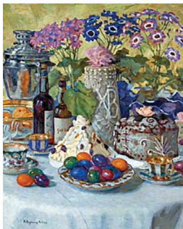
Nikolai Bogdanov-Belsky, πασχάλιατικο τραπέζι