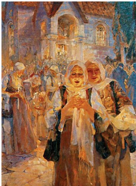
Ἄργυρος Οὐμβέρτος, Ἄνάσταση, 1932

Διευκρίνιση: Οἱ τυχόν αὐξήσεις πού θά προκύψουν βάσει τῶν νέων Μ.Κ. σέ ὀρισμένους Κληρικούς θά δοθοῦν σέ τέσσερις ἰσόποσες δόσεις μέσα στά ἐπόμενα τέσσερα χρόνια. Στό ἐπόμενο τεῦχος θά δημοσιεύσουμε ἀντιπροσωπευτικό πίνακα τῶν Μ.Κ. ὅλων τῶν κατηγοριῶν βάσει τῶν χρόνων ὑπηρεσίας.