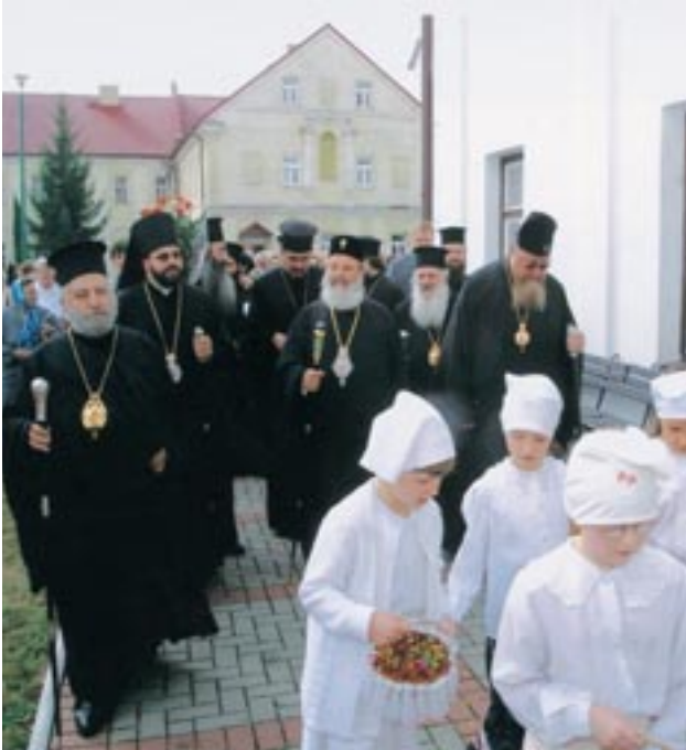
Άπο τήν ύποδοχή τοῦ Μακαριωτάτου Ἀρχιεπισκόπου Ἀθηνῶν καὶ πάσης Ἑλλάδος κ. Χριστοδούλου στήν Ἱερά Μονή Σουπράσλ τῆς πόλεως Μπιαλιστόκ (Πολωνία, 19/8/2003).