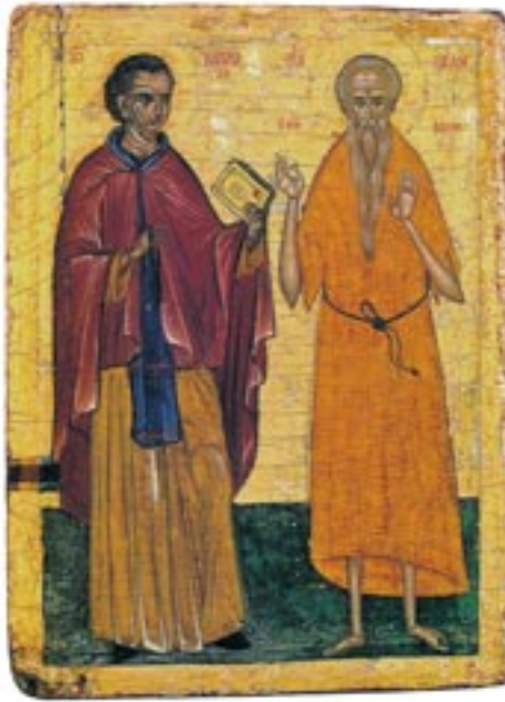
Οἱ ἅγιοι Ἰωάννης ὁ Καλυβίτης καὶ Παῦλος ὁ Θηβαῖος.

• Παράλληλα θὰ ἤθελα νὰ θίξω τὸ θέμα τῆς καλῆς συμπεριφορᾶς πρὸς τοὺς προσκυνητές, τοὺς ἐπισκέπτες, τοὺς πιστοὺς μας ἀλλὰ καὶ γενικότερα τοὺς συνανθρώπους μας, ποὺ καταφθάνουν στὴν Ι. Μονὴ σας. Τὸ θέμα εἶναι ἀρκετὰ λεπτόν. Χρειάζεται ἡ κατάλληλη ὑποδοχή, ἡ ἔκφραση τῆς εὐγένειας τῆς καρδίας μας, τὸ ἀνεπιτήδευτον, τὸ ἀνυπόκριτον, τὸ σεμνόν, σοβαρὸν καὶ συνάμα ἱεροπρεπὲς ἦθος μας. Οὔτε ὑπερβολικὲς αὐστηρότητες οὔτε καὶ ἄκριτες ἐπιπολαιότητες. Ἀκόμη οὔτε συζητήσεις μὲ στομφώδες καὶ πολλάκις ἀκατανόητο λεξιλόγιο, ἀλλὰ συνομιλία μὲ ἀπλότητα καὶ χωρὶς ὑπερβολὲς λόγων. Δὲν γνωρίζουμε τὴν ψυχὴ τοῦ ἄλλου. Γιατί ἔρχεται στὴν αὐλή σας, δὲν τὸ ξέρετε. Ἴσως ἀπὸ περιέργεια, ἄλλοτε ἀπὸ βαθεῖα συναίσθηση τῆς