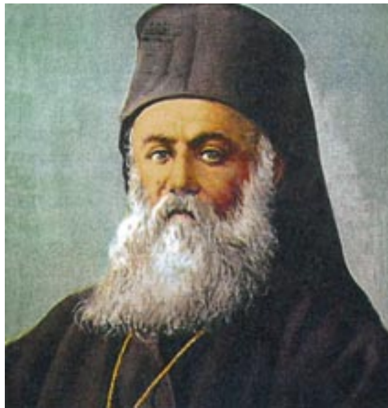
Ὁ Ἁγιος Ἐθνομάρτυς Μητροπολίτης Σμύρνης Χρυσόστομος, ὁ ὁποῖος ὑπέστη μαρτυρικὸ θάνατο στὶς 27 Αὐγούστου 1922 (π.ῆ.).

Ὁ ἀοίδιμος πατήρ μου ἦλθεν εἰς τὴν Ἑλλά- δα τὸ 1922, κρατῶν εἰς τὰς χεῖρας του, ὡς μο- ναδικὴν περιουσίαν, μό- νον δύο εἰκόνας ἐντετυ- λιγμένας εἰς μίαν «κου- βέρται». Ἐκράτει πέντε καὶ τὰς τρεῖς «οἱ φίλοι