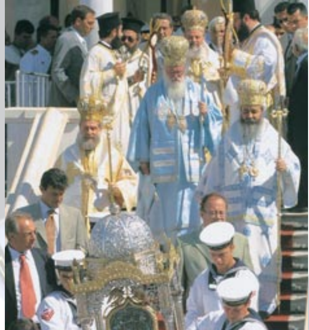
Στιγμιότυπο ἀπό τήν λιτάνευση τῆς θαυματουργοῦ εἰκόνας τῆς Παναγίας τῆς Τήνου μέ τήν συμμετοχή τοῦ Μακαριωτάτου Ἀρχιεπισκόπου Ἀθηνῶν καὶ πάσης Ἑλλάδος κ. Χριστοδούλου καὶ πολλῶν Μητροπολιτῶν.