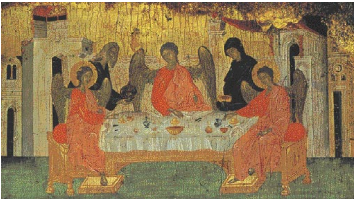
Περιχώρηση προσώπων. «Ἡ φιλοξενία τοῦ Ἀβραάμ». Εἰκόνα τῆς ἐποχῆς τῶν Παλαιολόγων (14ος αἰώνας). Μουσεῖο Μπενάκη.

ἐλπίδα νὰ ἐπηρεάσουμε καὶ τὸ γενικευμένο σύμπτωμα μοναξιάς στὴ σημερινή μας κοινωνία. Καὶ ἀντὶ νὰ ἐπηρεαζόμεστε ἀπὸ τὰ ἐξωτερικά, ἔχοντας καλλιέργησει τὰ ἐσωτερικά, μεταδίδουμε αὐτὸ τὸ κλίμα τῆς ἐσωτερικῆς οἰκειότητας καὶ πληρότητας ἀκροβατῶντας καὶ ἰσορροπῶντας σὲ δύσκολες καταστάσεις. Ποιὸς ξέρει ἂν τελικὰ δὲν τὸ καταφέρουμε. Γι' αὐτὸ ὅμως θὰ χρειασθεῖ νὰ λάβουμε ὑπόψη κάποιες προτεραιότητες πρὸς αὐτὴ τὴν κατεύθυνση.