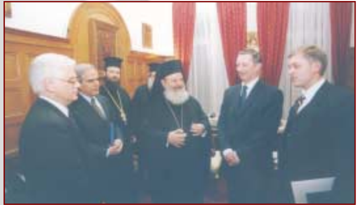
Έπίσκεψη του Ρώσου Υπουργού Άμυνας κ. Ίβανώφ στην Ίερά Άρχιεπισκοπή Ἀθηνῶν (4.4.2002)