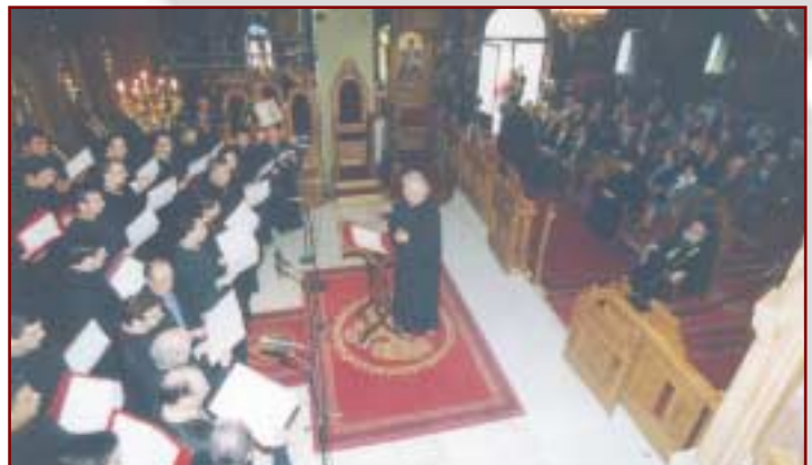
Ἀπό τὴν πρώτη συνάντηση πο- λυφωνικῶν καὶ βυζαντινῶν χορο- διῶν στὸν Ἱερό Ναὸ Φανερωμέ- νης στὸν Χολαργό (14.4.2002)