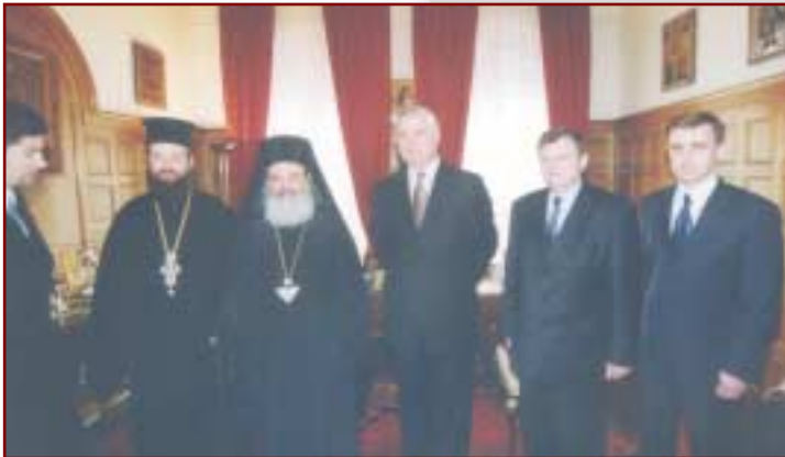
Έπίσκεψη του Υπουργού Ἐξωτε- ρικῶν τῆς Οὐκράνίας κ. Ἀνατόλι Ζλένκο στην Ίερά Ἀρχιεπι- σκοπή Ἀθηνῶν (18.4.2002)