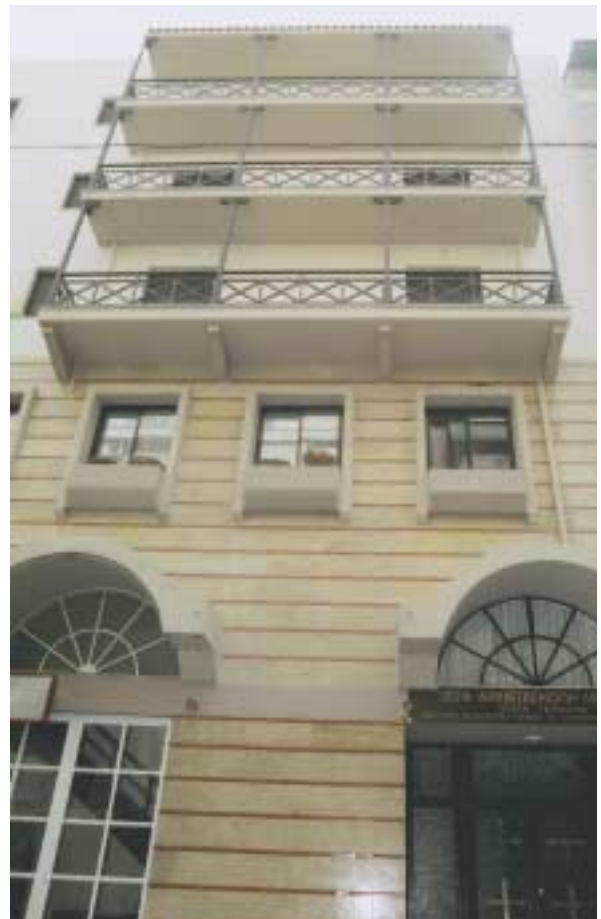
Τὸ μεγαλοπρεπὲς οἰκοδόμημα τῆς «Στέγης Γερόντων».

Εἶναι περιττὸν νὰ ἐπαναλάβω ὅτι οἱ ἀξιέπαινες ἀθόρυβες προσπάθειες ἐνὸς ἐφημερίου πρὸς ἀνέγερσιν τῆς περὶ οὗ ὁ λόγος «Στέγης Γερόντων», ἡ ὁποία ἀποτελεῖ νέον κόσμημα τῆς Ἱ. Ἀρχιεπισκοπῆς Ἀθηνῶν, ἀποτελεῖ ἀξιομίμητο παράδειγμα μεθοδικῆς ἐργασίας σ' ἓνα σπουδαιότατο τομέα τοῦ ποιμαντικοῦ ἔργου.