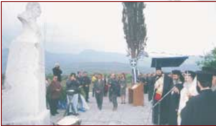
Ἐπίσκεψη τοῦ Μακαριωτάτου στὴν Ἱερὰ Μητρόπολη Φθιώτιδος ἐξ ἀφορμῆς τῶν ἐκδηλώσεων «Διάρκεια 2002» (20.4.2002)