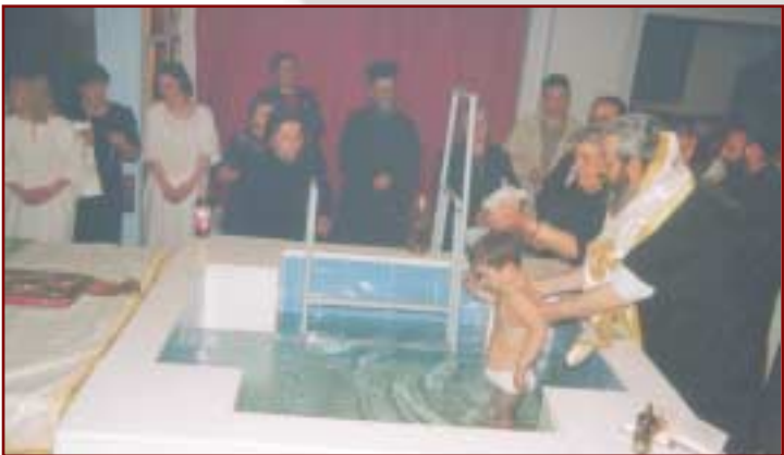
Ἀπὸ τὴν βάπτισι 15 ἐνηλίκων κατηχουμένων στὸ Βαπτιστήριο τοῦ Ἱ. Ν. Ἁγ. Παρασκευῆς Λαμίας (16.3.2002)