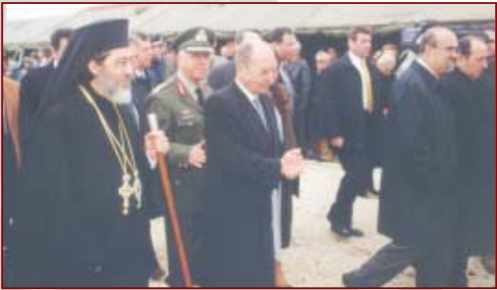
Ἀπὸ τὴν ἐπίσκεψη τοῦ Ἐξοχωτάτου Προέδρου τῆς Ἑλληνικῆς Δημοκρατίας κ. Κων/νου Στεφανοπούλου στὸ Σιδηρόκαστρο γιὰ τὶς γιορτὲς τοῦ Ροῦπελ καὶ τῶν Ὁχυρῶν (7.3.2002)