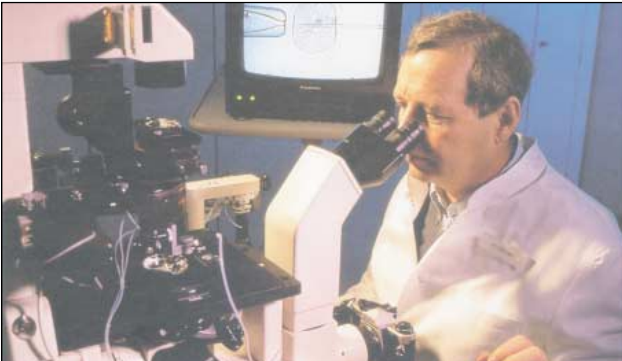
Άπό τὸ περιοδικό «Πεμπουσία».

4. Θα μπορούσαμε σ' αυτό τὸ σημείο νὰ συμφωνήσουμε με τή διατύπωση τοῦ Ρεζις Ντεμπρέ ότι «ό χριστιανισμός έπινοεί μια γενεαλογία χωρίς γενετική: έσὺ ως άτομο, είσαι αυτός που θα έπιλέξεις τήν πίστη σου και θα τή ζήσεις» (ό.π., σ. 1).