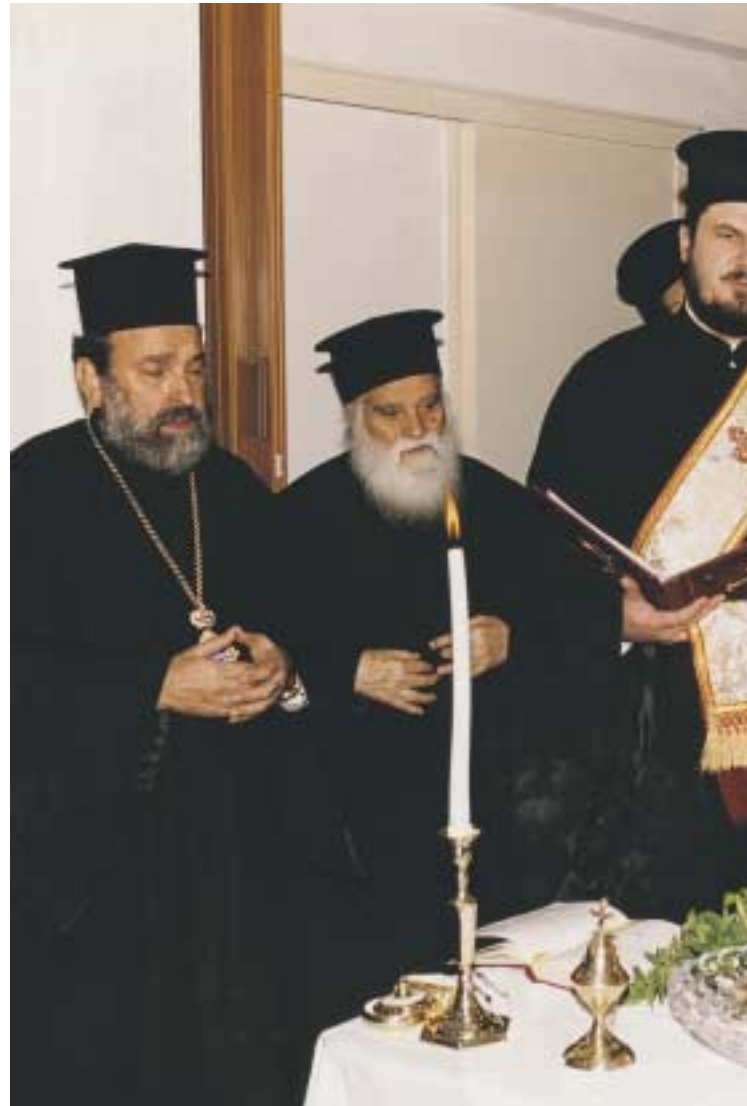
Στιγμιότυπο ἀπὸ τὴν τελετὴ τῶν ἐγκαταστάσεων τῆς «Στέγης

Μετὰ τὴν ἔκδοσι δύο οἰκοδομικῶν ἀδειῶν ἀπὸ τὶς Ὑπηρεσίες τῆς Ναοδομίας καὶ τῆς Πολεοδομίας, ἀνέλαβε ὅλους τοὺς κόπους τῆς ἐπιστασίας καὶ παρακολουθήσεως τοῦ ἔργου, τὸ ὁποῖο ὀλοκληρώθηκε με διαφάνεια, με νομίμους διαγωνισμοὺς καὶ με