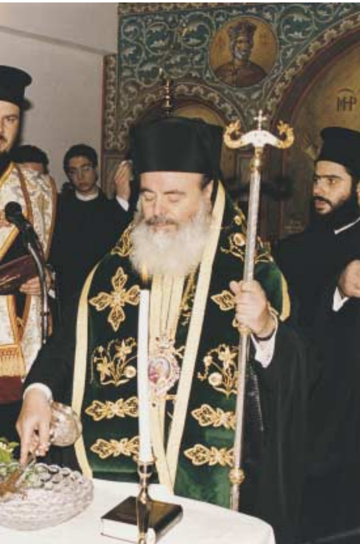
Γερόντων» τοῦ Ἱ. Ν. Ἀγ. Παντελεήμονος Ἀχαρνῶν.