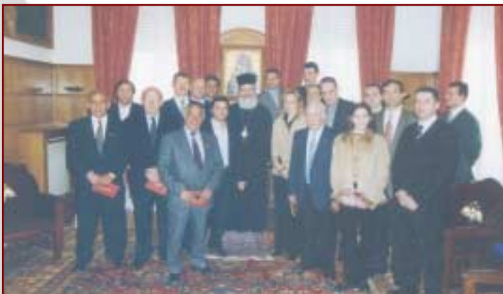
Έπίσκεψη μελῶν τοῦ Δ.Σ. τοῦ Συλλόγου Ἑλλήνων Ὀλυμπιο- ρικῶν στην Ίερά Ἀρχιεπισκοπή Ἀθηνῶν