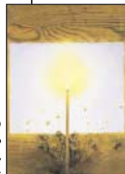
ΕΞΩΦΥΛΛΟ Έργο τοῦ Χρήστου Κοκόρου, «Μέλισσες»