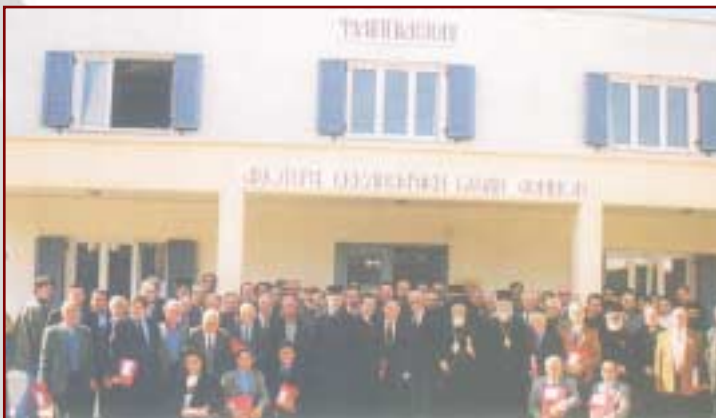
Ἀναμνηστικὴ φωτογραφία τῶν Ἱεροψαλτῶν τῆς Ἱ. Μητροπόλεως Ἀττικῆς, ποὺ μετείχαν στὴν Ἡμερίδα, ἡ ὁποία ὀργανώθηκε μὲ πρωτοβουλία τοῦ Σεβ. Μητροπολίτου κ. Παντελεήμονος