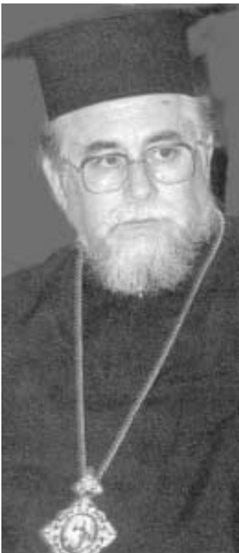
Τοῦ Θεοφ. Ἐπισκόπου Σαλώνων κ. ΘΕΟΛΟΓΟΥ Ἀρχιεραγματέως τῆς Ἱερᾶς Συνόδου

«Καὶ τὸν ἔπαινον αὐτοῦ ἐξαγγελεῖ Ἐκκλησία» (Σοφ. Σειράχ 39, 10)