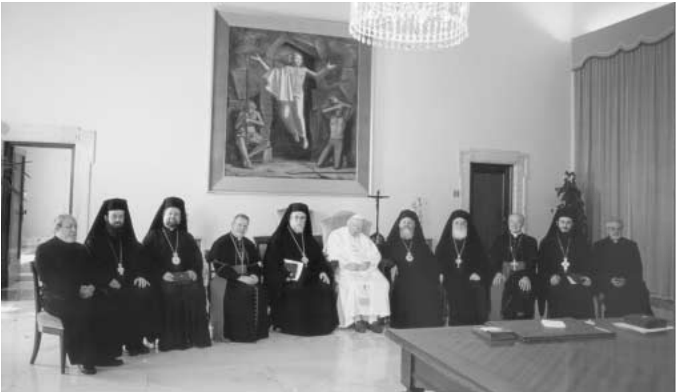
Ἡ Ἀντιπροσωπεία τῆς Ἐκκλησίας τῆς Ἑλλάδος μετὰ τοῦ Πάπα Ρώμης Παύλου – Ἰωάννου Β΄ καὶ Μελῶν Ρωμαιοκαθολικῶν Ἐπιτροπῶν, εἰς ἀναμνηστικὴν φωτογραφίαν (Servizio Fotografico de "L'.O.R" τοῦ Βατικανοῦ).

Ἄς ἐλπίσωμεν ὅτι ἡ εἰλικρινὴς καὶ ἀνυστερόβουλη συνεργασία θὰ ὑποβοηθήσῃ τὴν ἀποδυνάμωσι καὶ ἐξάλειψι τοῦ —ἤδη ἐπανελημμένως καταδικασθέντος στὰ πλαίσια τοῦ ἐπισήμου θεολογικοῦ διαλόγου— Οὐνιτισμοῦ καὶ θὰ καταστήσῃ δυνατὴ τὴ συνέχισι καὶ ἐκ νέου ἐνεργοποίησι τοῦ ὑπὸ τίς εὐλογίες τοῦ Σεπτοῦ Οἰκουμενικοῦ Πατριαρχείου διεξαγομένου ἕως τώρα, ἀλλὰ κινδυνεύοντος, διαλόγου αὐτοῦ μεταξὺ τῆς καθ' ὅλου Ὁρθοδοξίας καὶ τοῦ Ρωμαιοκαθολικισμοῦ, ὁ ὁποῖος διάλογος ἔχει ὡς σκοπὸ τὴν ἐξεύρεσι τρόπων ἄρσεως οὐσιωδῶν ἐκκλησιολογικῶν καὶ ἄλλων διαφορῶν καὶ πρὸς ἀποκατάστασι τῆς κοινωνίας καὶ ἐνότητος μεταξὺ τῶν δύο Ἐκκλησιῶν. Ὄταν αὐτὸ ἐπιτευχθῇ, τότε εὐκολώτερον οἱ προτεσταντικὲς ἐκκλησίες θὰ στρέφονταν ἐλκνόμενες πρὸς ἕνωσι μὲ μιὰ ἀκτινοβολοῦσα πανίσχυ-