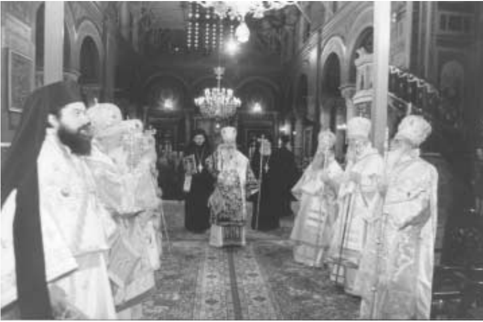
Στιγμιότυπο ἀπὸ τῆς Συνοδικῆς καὶ Ἀρχιεπισκοπικῆς θείας Λειτουργίας τὴν Κυριακὴ τῆς Ὁρθοδοξίας στὸν Καθεδρικό Ναό τῶν Ἀθηνῶν (24.3.2002)

νέων, στέγες προστασίας ἀγάμων μητέρων, βρεφονηπιακούς σταθμούς, κατασκηνώσεις, ἐνοριακὰ συσσίτια γιὰ ἀπόρους καὶ οἰκονομικούς μετανάστες κ.ἄ.