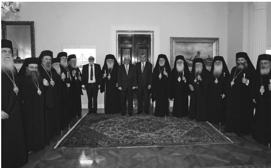
Ὁ Πρόεδρος τῆς Ἑλληνικῆς Δημοκρατίας κ. Προκόπης Παυλόπουλος, ὁ Μακαριώτατος Ἀρχιεπίσκοπος Ἀθηνῶν καί πάσης Ἑλλάδος κ. Ἱερώνυμος καί τά μέλη τῆς Διαρκοῦς Ἱερᾶς Συνόδου.

Τέλος, ἡ ἑορτή τῆς Ὁρθοδοξίας ἐπιβάλλει σέ κάθε Ἑλληνα καί πάλιν ἀνεξαρτήτως θρησκευτικῶν πεποιθήσεων τό χρέος ν' ἀναγνωρίζει ὅτι, στή σημερινή ἐπώδυνη συγκυρία, ἡ Ὁρθόδοξη Ἐκκλησία τῆς Ἑλλάδος διαδραματίζει ἕναν ἐμβληματικό κοινωνικό ρόλο. Καί τοῦτο διότι μέσα στήν «καρδιά», κυριολεκτικῶς, τῆς βαθιάς κοινωνικῆς καί οικονομικῆς κρίσης πού ἔχει πλήξει καιρίως τήν κοινωνία μας ἔχει ἀναλάβει, ὑπό τή φωτισμένη ἡγεσία σας, Μακαριώτατε, πλειάδα οὐσιαστικῶν –καί μακράν τῆς περιττῆς δημοσιότητας– πρωτοβουλιῶν, γιά τή στήριξη τοῦ χεμαζόμενου κοινωνικοῦ συνόλου, ἰδίως δέ τῶν οικονομικῶς ἀσθενεστέρων. Μέ τόν τρόπο αὐτόν, ἡ Ὁρθόδοξη Ἐκκλησία τῆς Ἑλλάδος κάλυψε πολλά καί σημαντικά κενά ὡς πρός τήν ἐπαρκῆ λειτουργία τοῦ Κοινωνικοῦ Κράτους, στά ὁποῖα ἡ Πολιτεία μόνη δέν θά ἦταν σέ θέση ν' ἀντεπεξέλθει. Ὑπό τά δεδομένα αὐτά ἔσπευσε ἐγκαίρως καί ἀποτελεσματικῶς πρός τήν κατεύθυνση τῆς υπεράσπισης τοῦ κοινωνικοῦ ἴσοῦ καί συνακόλουθα, τῆς ἀποφυγῆς τῆς ρήξης του, ἡ ὁποία θά εἶχε ἐπιπλέον ἀνυπολόγιστες συνέπειες γιά τήν πορεία πρός τήν ὀριστική ἔξοδο τοῦ Τόπου μας ἀπό τήν πολυετῆ καί ἐπώδυνη κοινωνική καί οικονομική κρίση. Μέσα ἀπό αὐτήν τήν πορεία, ἡ Ὁρθόδοξη Ἐκκλησία τῆς Ἑλλάδος ἐκπληρώνει τήν ἀποστολή της, σύμφωνα μέ τήν Ὁρθόδοξη Παράδοση τοῦ «Ἀγαπάτε Ἀλλήλους», ἀκόμη δέ περισσότερο