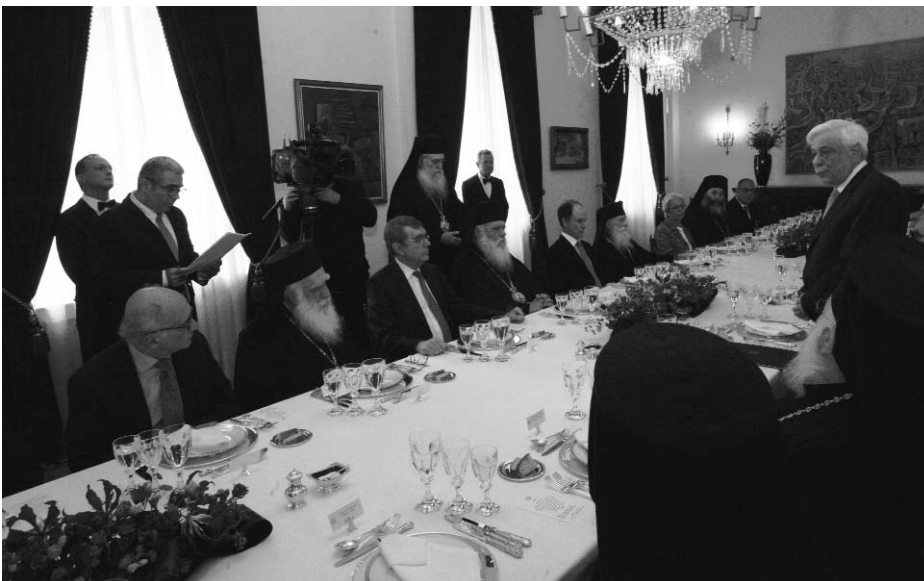
Ὁ Πρόεδρος τῆς Ἑλληνικῆς Δημοκρατίας κ. Προκόπης Παυλόπουλος προσφωνεῖ τὸν Μακαριώτατο Ἀρχιεπίσκοπο Ἀθηνῶν καὶ πάσης Ἑλλάδος κ. Ἱερώνυμο καὶ τὰ μέλη τῆς Διαρκοῦς Ἱερᾶς Συνόδου.

ἡ Ἐορτὴ τῆς Ὁρθοδοξίας, μὲσθ τῆς ἀνάμνησης τῆς ἀναστήλωσης τῶν Ἱερῶν Εἰκόνων, συνιστᾶ κατ' ἔτος γιὰ τὴν Ἐκκλησία μας, τὸν Κλῆρο καὶ τὸν Λαὸ μας ἀφετηρία καὶ λίκνο συμβολισμῶν καὶ διδαγμάτων, ἰδίως ὡς πρὸς τὸν ρόλο τὸν ὁποῖο διαδραματίζει, διαχρονικῶς καὶ ἀδιαλείπτως, ἡ Ἐκκλησία μας στὴν ἱστορικὴ πορεία τοῦ Λαοῦ καὶ τοῦ Ἔθνους μας. Ὡς πρὸς τοῦτο, ἡ Ἐορτὴ τῆς Ὁρθοδοξίας, μὲ ἀμάχητα ἱστορικῶς τεκμήρια, καλεῖ ἐμᾶς, τοὺς Ἕλληνες –καὶ μάλιστα ἀνεξαρτήτως θρησκευτικῶν πεποιθήσεων– ν' ἀναλογιζόμαστε καὶ ν' ἀναγνωρίζουμε, εἰλικρινῶς καὶ εὐθαρσῶς, τὴν καθοριστικὴ συμβολὴ τῆς Ὁρθόδοξης Ἐκκλησίας στοὺς μεγάλους Ἀγῶνες τοῦ Λαοῦ μας καὶ τοῦ Ἔθνους μας. Συνακόλουθα δέ τὴν καθοριστικὴ συμβολὴ της στὴν ὑπεράσπιση τῆς Ἱστορίας μας καὶ τῆς Πατρίδας μας. Τὸ Ἔθνι-