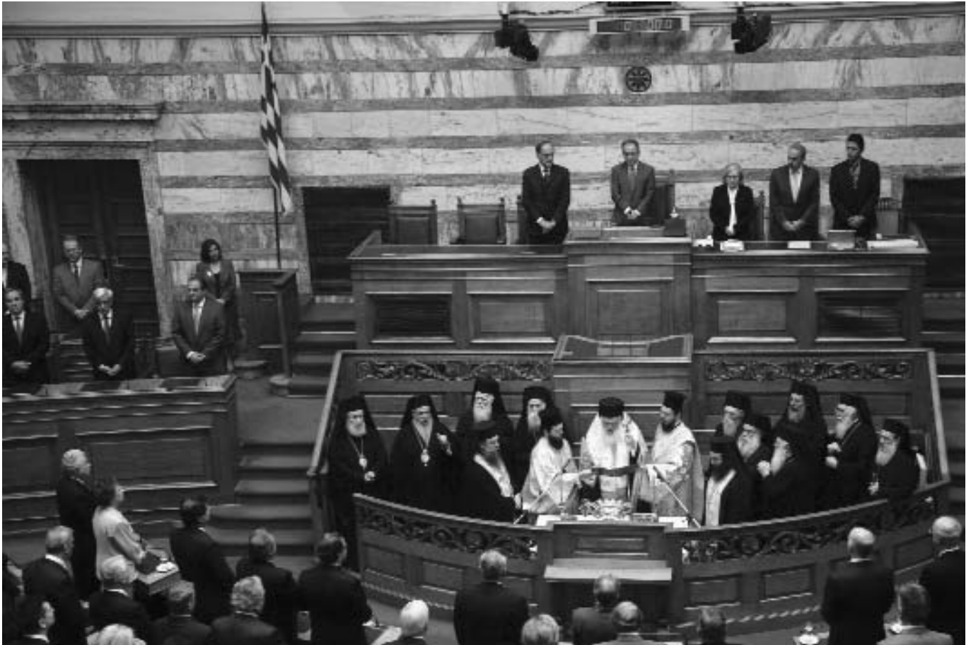
Ὁ Μακαριώτατος Ἀρχιεπίσκοπος Ἀθηνῶν καὶ πάσης Ἑλλάδος κ. Ἱερώνυμος συνοδευόμενος ἀπὸ μέλη τῆς Διαρκοῦς Ἱερᾶς Συνόδου ἐτέλεσε τὸν Ἀγιασμό γιὰ τὴν ἐναρξη τῶν ἐργασιῶν τῆς νέας Συνόδου τῆς Βουλῆς (6.10.2008).

νὰ τῆς σταλάξουμε λίγο ἀπὸ τὸ δικό μας αἷμα, ἀπὸ τὸ μελάνι τῆς σπουδῆς μας καὶ τοῦ προσωπικοῦ μας ὁράματος, ἀπὸ τὸν κόπο τῆς πίστης μας, ἀπὸ τὰ χρώματα τῆς ἐλπίδας ποὺ ὁ Χριστὸς δίδαξε μὲ τὴν Ἀνάστασή Του.