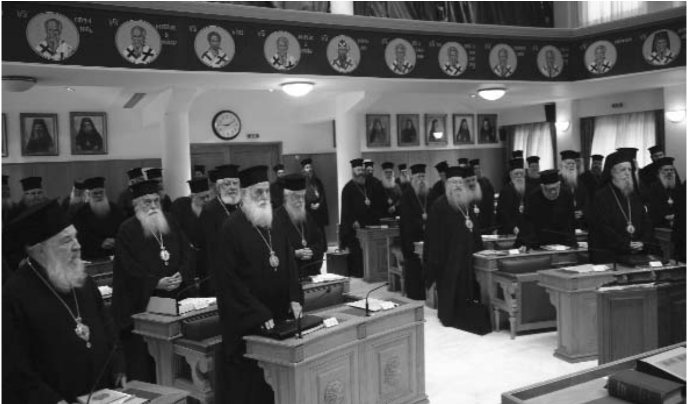
Στιγμιότυπο ἀπὸ τὴ σύγκληση τῆς Ἱερᾶς Συνόδου τῆς Ἱεραρχίας στὴν αἴθουσα τοῦ Μεγάλου Συνοδικοῦ.