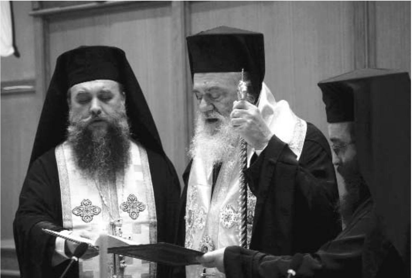
Ὁ Μακαριώτατος Ἀρχιεπίσκοπος Ἀθηνῶν καὶ πάσης Ἑλλάδος κ. Ἱερώνυμος ἐτέλεσε τὴν Ἱερὰ Ἀκολουθία γιὰ τὴν ἑναρξὴ τῶν ἐργασιῶν τῆς Ι.Σ.Ι. (1.10.2008).

νέσθαι, καὶ οὕτως ἐκθέσθαι τὸν κανόνα, ἵνα καὶ τῷ ποιήσαντι τὸ ἀκίνδυνον ἦ, καὶ ὁ ἀποκρινόμενος τὸ ἀξιόπιστον ἔχη ἐν τῇ περὶ τῶν τοιούτων ἀποκρίσει» (μζ΄ Κανὼν Μ. Βασιλείου).