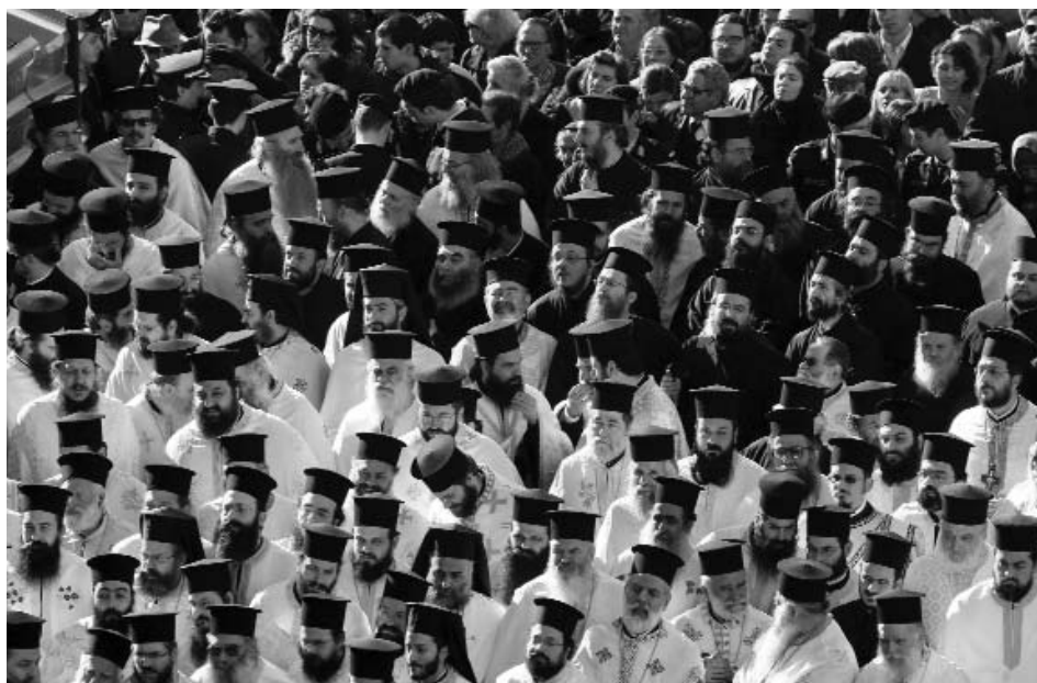
Ίερείς της Ίερής Αρχιεπισκοπής Αθηνών λίγο πριν τήν έξοδο από τόν Καθεδρικό Ναό Αθηνών της σορού του μακαριστού Αρχιεπισκόπου Αθηνών και πάσης Ελλάδος κυρού Χριστοδούλου.

Τό απόγευμα της Τετάρτης 30ης Ιανουαρίου τó σήνωμα του μακαριστού Αρχιεπισκόπου μετεφέρθη στο παρεκκλήσιο της Μητροπόλεως (Ί. Ναός Αγίου Έλευθερίου), ώστε να γίνουν οί προετοιμασίες του Καθεδρικού Ναού για τήν Έξόδιο Άκολουθία. Τό λαϊκό προσκύνημα συνεχίστηκε με άθρόα προσέλευση μέχρι τις 08.00 της Πέμπτης 31ης Ιανουαρίου. Ό γραπτός και ήλεκτρονικός Τύπος τόνισε με κάθε τρόπο τήν έντυπωσιακή σε