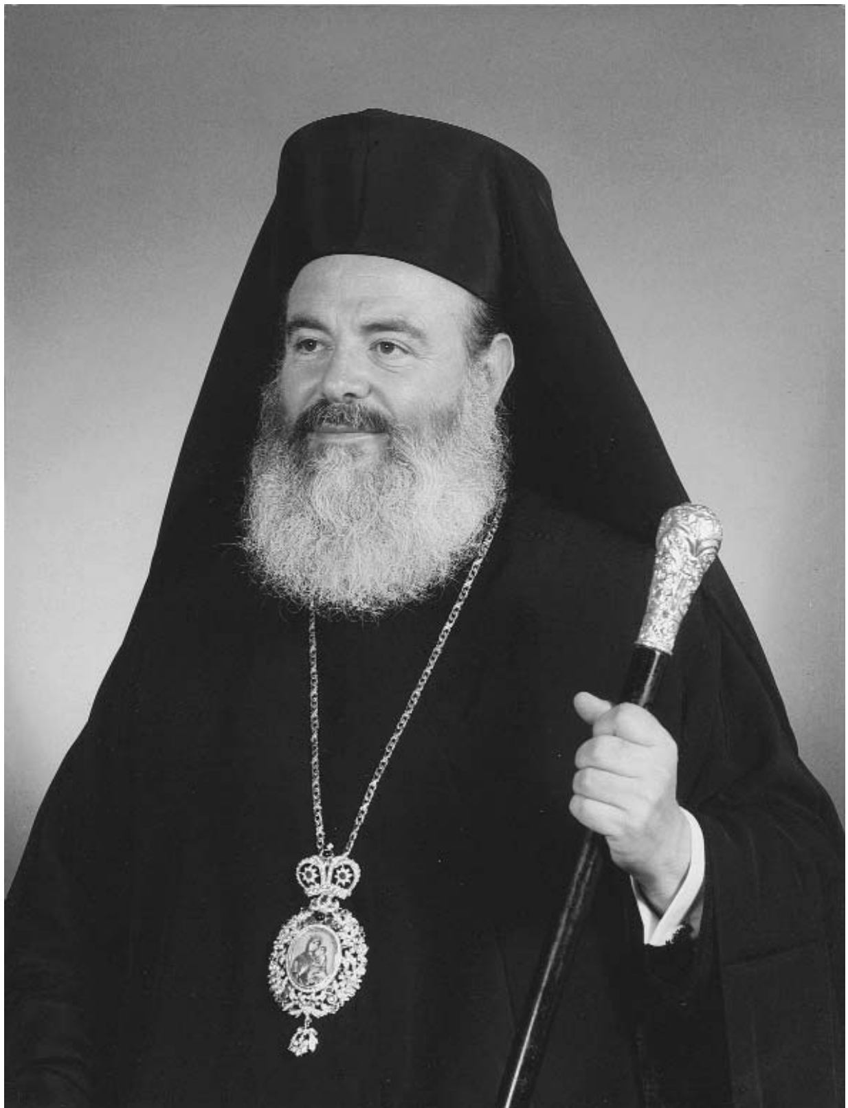
Ο ΑΡΧΙΕΠΙΣΚΟΠΟΣ ΑΘΗΝΩΝ ΚΑΙ ΠΑΣΗΣ ΕΛΛΑΔΟΣ ΧΡΙΣΤΟΔΟΥΛΟΣ († 28 ΙΑΝΟΥΑΡΙΟΥ 2008)