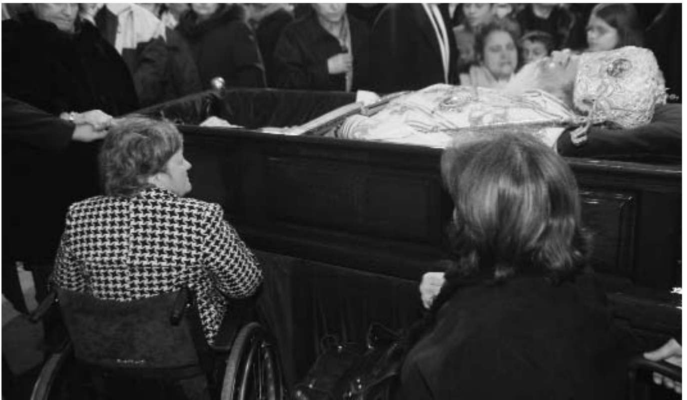
Πλῆθος λαοῦ συνέρρευσε στὸ λαϊκὸ προσκύνημα τοῦ σκηνώματος τοῦ μακαριστοῦ Ἀρχιεπισκόπου Ἀθηνῶν καὶ πάσης Ἑλλάδος κυροῦ Χριστοδοῦλου.