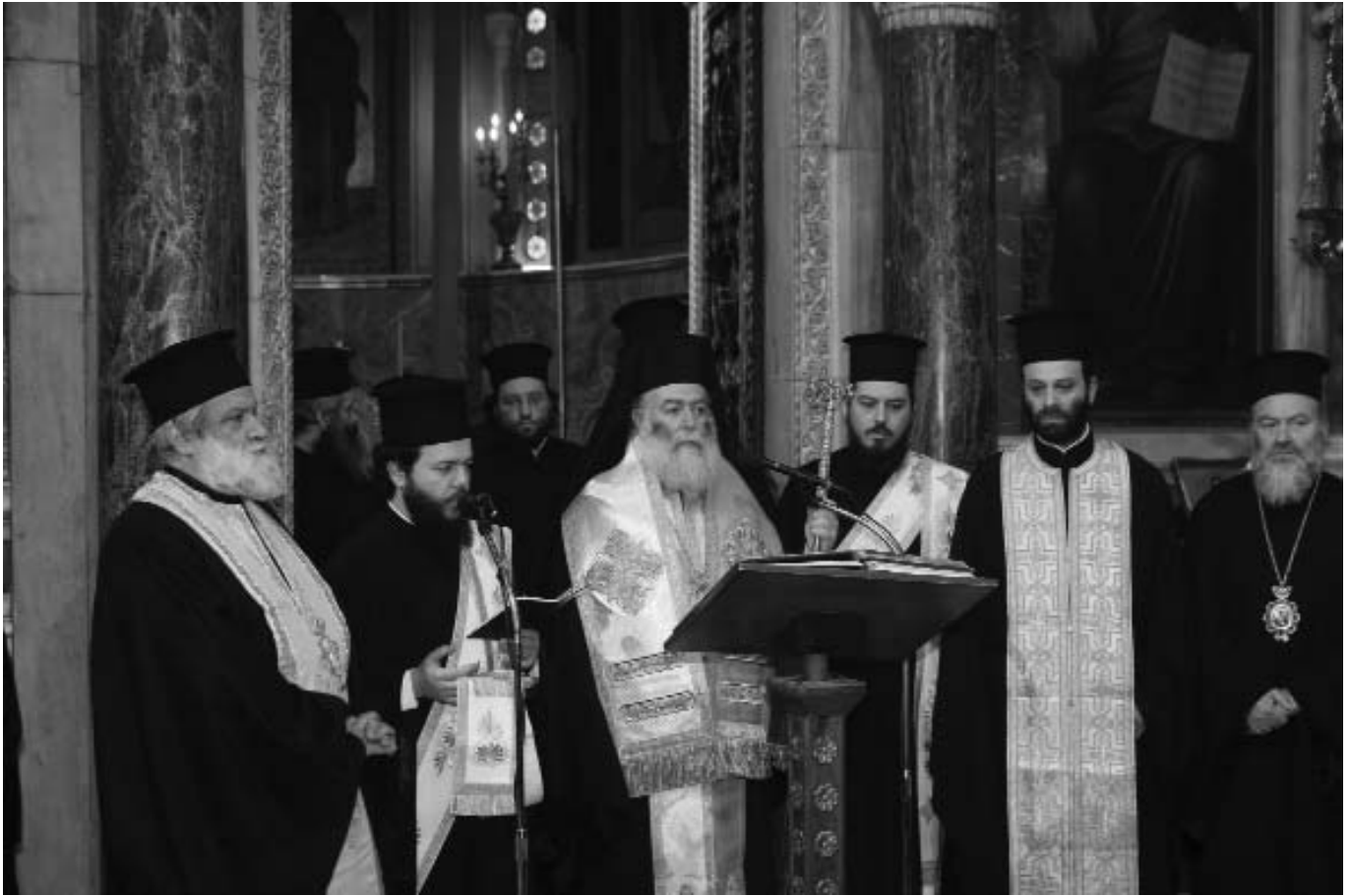
Στιγμιότυπο με τὸν Μακαριώτατο Πατριάρχη Ἀλεξανδρείας κ. Θεόδωρο πρὸ τῆς σοροῦ τοῦ μακαριστοῦ Ἀρχιεπισκόπου Ἀθηνῶν καὶ πάσης Ἑλλάδος κυροῦ Χριστοδούλου στὸν Καθεδρικό Ναὸ Ἀθηνῶν.

του καὶ νὰ γευθεῖ τοὺς χυμούς καὶ τοὺς καρπούς τῆς νυχθήμερης δράσης του.