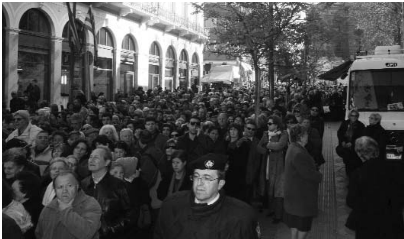
Στιγμιότυπο από τὸ μεγάλο πλῆθος κατὰ τὸ λαϊκὸ προσκύνημα τῆς σοροῦ τοῦ μακαριστοῦ Ἀρχιεπισκόπου Ἀθηνῶν καὶ πάσης Ἑλλάδος κυροῦ Χριστοδοῦλου.