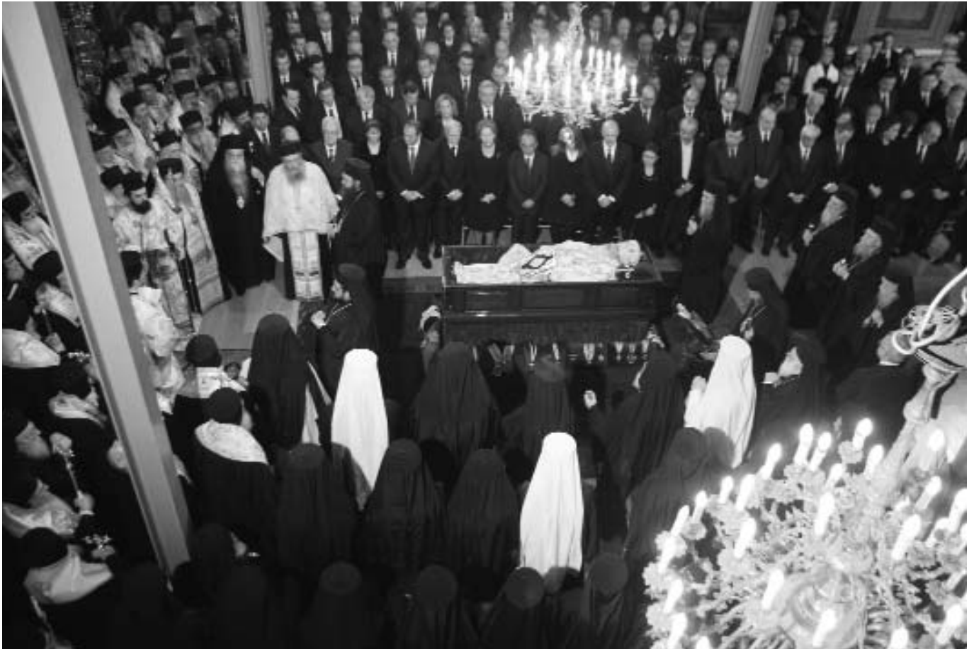
Στιγμιότυπο από την εξόδιο ακολουθία του μακαριστού Αρχιεπισκόπου Αθηνών και πάσης Ελλάδος κυρού Χριστοδούλου.

της παράνομης διακίνησης ανθρώπων αποτελούν μερικές μόνο από τις ευπαθείς κοινωνικές ομάδες, που έγιναν δέκτες της φιλεύσπλαχνης διακονίας του Μακαριστού Αρχιεπισκόπου. Η ποιμαντική θητεία του στην ηγεσία της Εκκλησίας συνοδεύτηκε από τη δημιουργία δικτύου βρεφονηπιακών σταθμών και την ίδρυση της «Στέγης της Μητέρας», για τη στήριξη της εργαζόμενης γυναίκας, τις δωρεάν ιατρικές και νομικές υπηρεσίες μέσω του «Κέντρου Στήριξης Οικογένειας», τη βοήθεια προς τους άπορους και τις πολύτεκνες οικογένειες, την παροχή οργανωμένων συσσιτίων για περίπου 3.000 άτομα την ημέρα από την Αρχιεπισκοπή, τη δημιουργία «Στεγών Γερόντων» για τα άτομα της τρίτης ηλικίας, και πολλές άλλες πρωτοβουλίες, που συνθέτουν ένα ολοκληρωμένο δίκτυο ανθρωπιστικής προσφοράς.