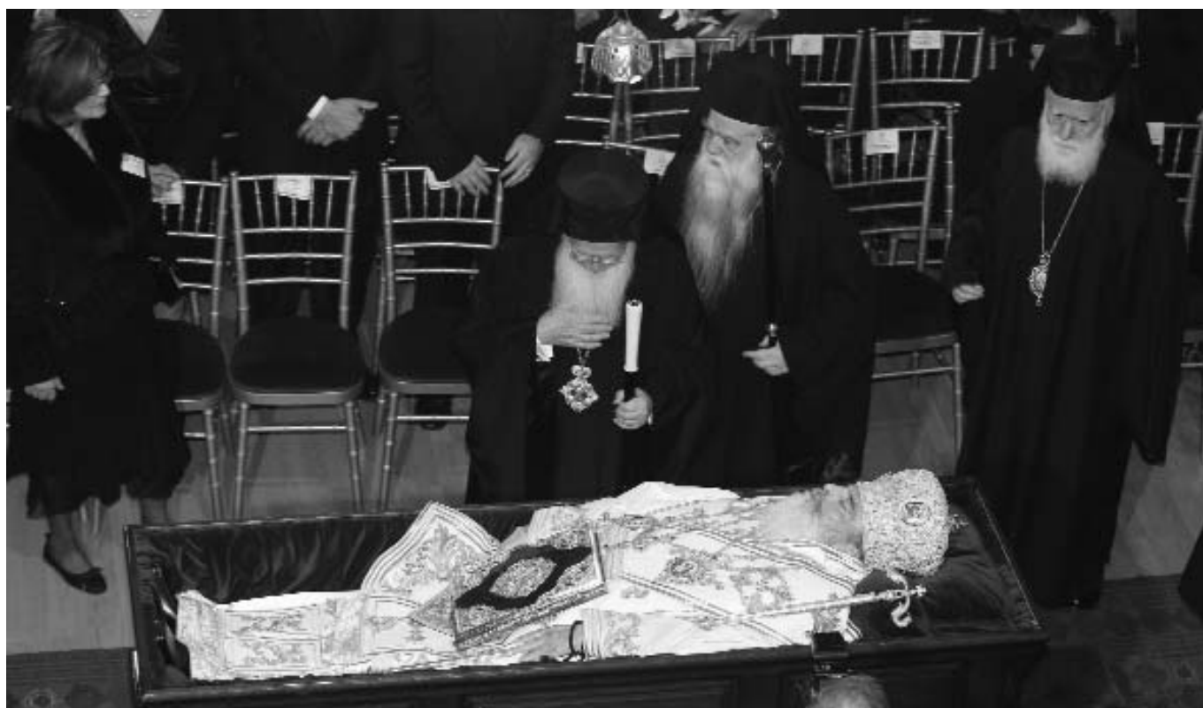
Ὁ Παναγιώτατος Οἰκουμενικὸς Πατριάρχης κ. Βαρθολομαῖος πρὸ τῆς σοροῦ τοῦ μακαριστοῦ Ἀρχιεπισκόπου Ἀθηνῶν καὶ πάσης Ἑλλάδος κυροῦ Χριστοδοῦλου.