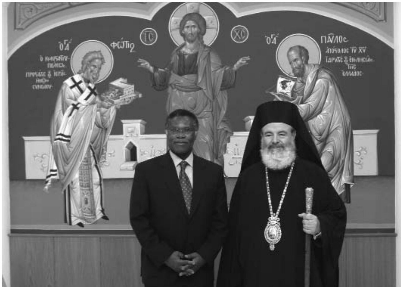
Ὁ μακαριστὸς Ἀρχιεπίσκοπος Χριστόδουλος ἐνίσχυσε τὴν διεθνή ἀκτινοβολία τῆς Ἐκκλησίας τῆς Ἑλλάδος. Ἐδῶ εἰκονίζεται μὲ τὸν Γεν. Γραμματέα τοῦ Παγκοσμίου Συμβουλίου Ἐκκλησιῶν Δρα Samuel Cobia στὸ Συνοδικὸ Μέγαρο Ἀθηνῶν.

Κατ' ἐξοχὴν λειτουργικὸς ἄνθρωπος ὁ κ. Χριστόδουλος, πιστὸς εἰς τὴν παράδοσιν, ἐπέβαλε τὴν Τάξιν εἰς τὰς Ἱ. Ἀκολουθίας. Πρωταρχικὸν μέλημά του ὑπῆρξε ἡ τόνωσις τῆς λειτουργικῆς ζωῆς. Ἄριστος λειτουργὸς ὁ ἴδιος, κατανοεῖ τὴν ἀναγκαιότητα τῆς Θείας Λατρείας ὡς βάσεως πνευματικῆς προαγωγῆς, ἀλλὰ καὶ κέντρου ἀναφορᾶς καὶ ἀναπαύσεως. Καθιέρωσε τακτὰς λατρευτικὰς εὐκαιρίας, ἰδίως διὰ νέους, ἐνῶ εἰς μεγάλας Ἐνορίας ἔδωσε ὁδηγίαν διὰ τέλεσιν δευτέρας Θείας Λειτουργίας ἐκάστην Κυριακὴν. Ἦνοιχθη εἰς διάλογον μὲ διαφωνοῦντας, κατέστησε τὴν Θείαν Λατρείαν κέντρον τῆς ζωῆς του καὶ διωργάνωσε τὴν Ὑπηρεσίαν τῆς Ἱ. Μητροπόλεως Δημητριάδος πρὸς ἀντιμετώπισιν τῶν αἰρετικῶν. Συνέγραψε καὶ ἐξέδωκε εἰδικὰ ἔντυπα περὶ τῆς Ἀκολουθίας τοῦ Μυστηρίου τοῦ Γάμου, καθὼς καὶ τῆς Βαπτίσεως.