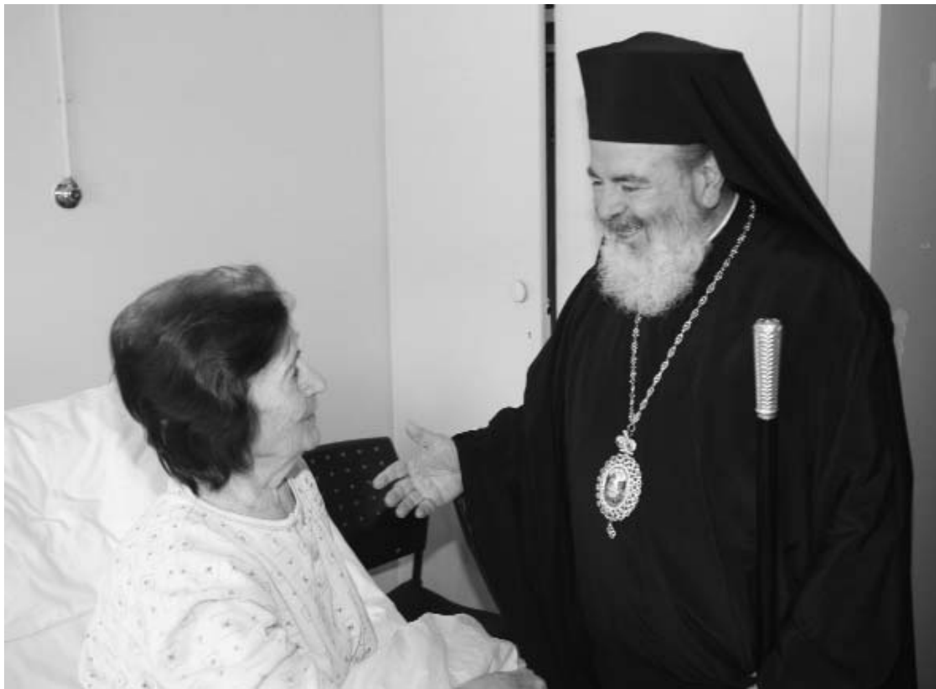
Ὁ Ἀρχιεπίσκοπος Χριστόδουλος βρισκόταν πάντα στο πλευρὸ τῶν ἀσθενῶν καὶ ἐμπεριστάτων συνανθρώπων μας.

ἐμπνευσθὲν ἔργον τῆς ἀνεγέρσεως ἐπιβλητικοῦ Συνεδριακοῦ Κέντρου εἰς Μελισσιάτικα Μαγνησίας, περιλαμβάνοντος αἰθούσας 450 καὶ 150 ἀτόμων, 6 αἰθούσας ἐργασίας, βιβλιοθήκην, χώρους ἐστίασεως, ἀρχεῖον, Ἱ. Παρεκκλήσιον καὶ ἐκθεσιακὸν χώρον.