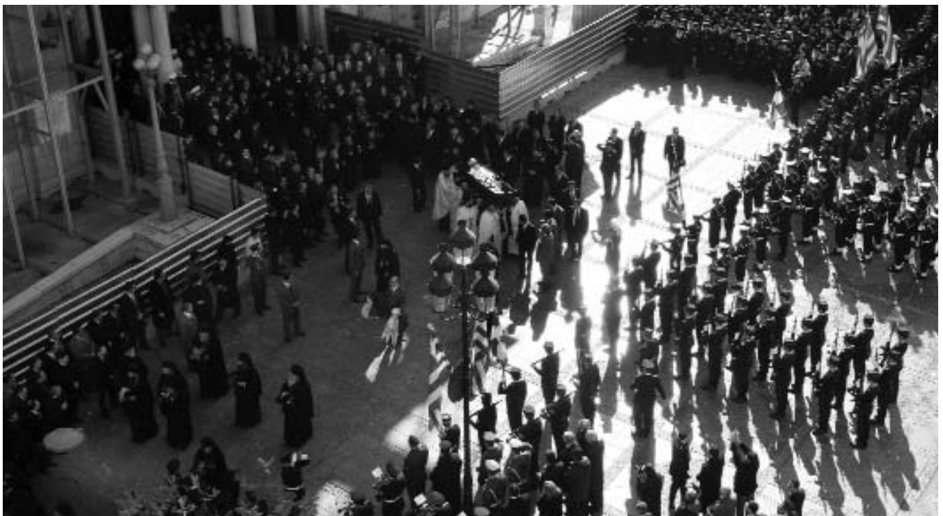
Στιγμιότυπο ἀπὸ τὴν ἔξοδο τῆς σοροῦ τοῦ μακαριστοῦ Ἀρχιεπισκόπου Ἀθηνῶν καὶ Πάσης Ἑλλάδος κυροῦ Χριστοδούλου.

ΣΗΜΕΙΩΣΗ: Μὲ ἀπόφαση τῆς Ἱερᾶς Συνόδου τῆς Ἐκκλησίας τῆς Ἑλλάδος, δὲν θὰ κατατεθοῦν Στεφάνια, ἀντ' αὐτῶν εἶναι δυνατόν νὰ κατατεθοῦν χρήματα ὑπὲρ τῶν Φιλανθρωπικῶν Ἰδρυμάτων γενικῶς.