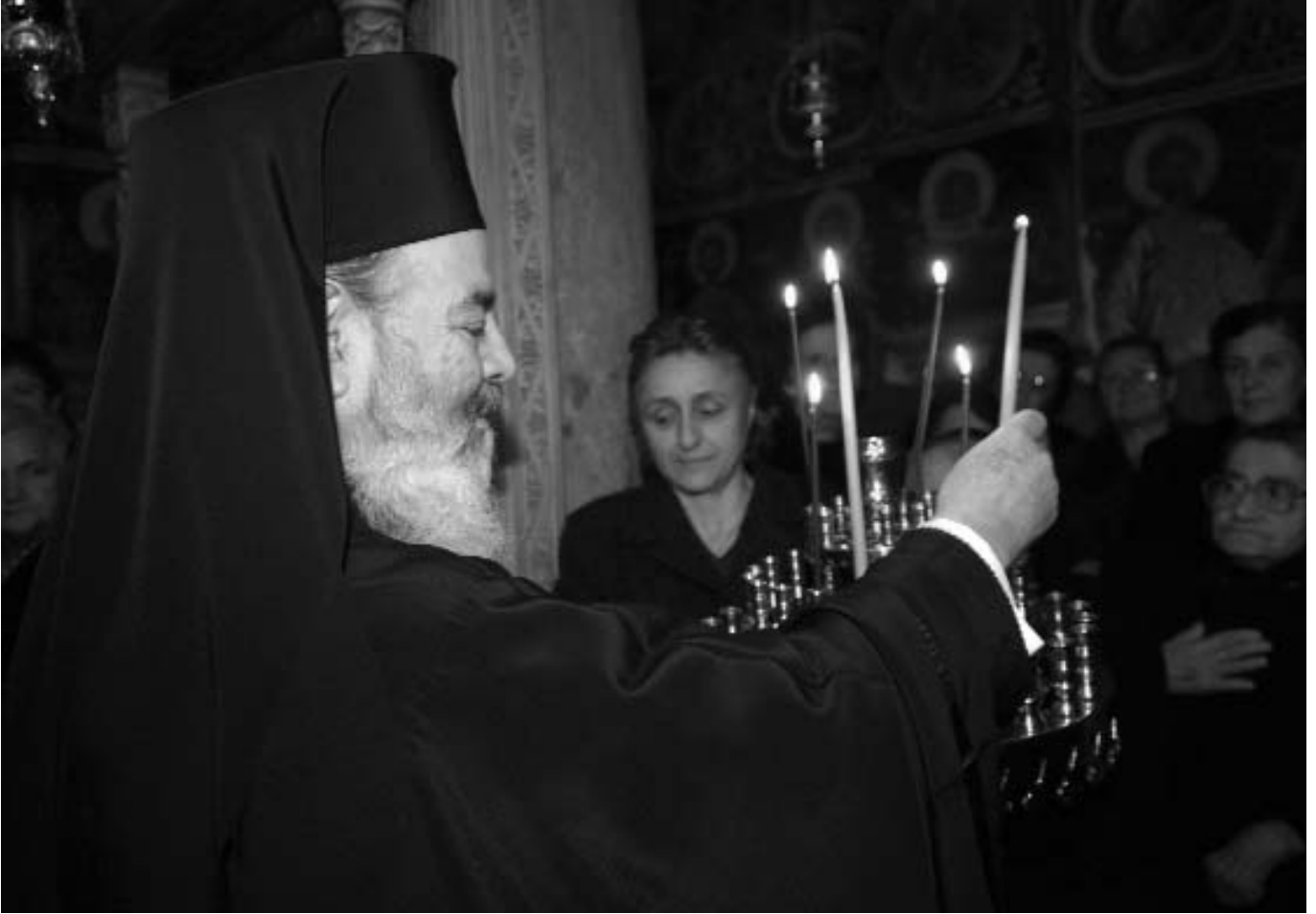
Στιγμές κατανύξεως και εὐλαβείας τοῦ μακαριστοῦ Ἀρχιεπισκόπου Χριστοδοῦλου.

τῆς Ἱ. Μητροπόλεως, ἐνεθάρρυνε τοὺς νέους κληρικούς νὰ σπουδάσουν, καὶ προσείλκυσε πρὸς τὴν ἱερωσύνην πλειάδα νέων, προσοντούχων καὶ ἱκανῶν κληρικῶν. Κατὰ τὸ διάστημα τῶν 24 ἐτῶν τῆς ἀρχιερατείας του ἐχειροτόνησε περὶ τοὺς 150 νέους κληρικούς, ἀνανεώσας τὸ δυναμικὸν τῶν στελεχῶν τῆς Ἱ. Μητροπόλεως καὶ τοποθετήσας τοὺς καταλλήλους ἀνθρώπους εἰς τὰς καταλλήλους θέσεις. Χαρακτηριστικὸ γνῶρισμά του ὑπῆρξε ἡ ἀνανέωσις τῶν ἐσωτερικῶν δομῶν τῆς Ἐκκλησίας μὲ τὸ ὄνειρον τοῦ ἐκσυγχρονισμοῦ. Πρὸς τοῦτο, ἤρξατο ἀπὸ τῆς δημιουργίας νέων στελεχῶν, κληρικῶν καὶ λαϊκῶν, τὰ ὁποῖα συνεχῶς ἐπεμόρφωνε, ὥστε νὰ τὰ καταστήσει ἱκανὰ νὰ ἀντιμετωπίζουν τὰ σύγχρονα προβλήματα τῆς κοινωνίας. Ὡθοῦσε τοὺς νέους κληρικούς νὰ σπουδάζουν, μὲ ἀποτέλεσμα, ἐνῶ τὸ 1974 εἶχε βρεῖ μόνον 12 θεολόγους κληρικούς εἰς τὴν Ἱ. Μητροπολιν Δημητριάδος, τὸ 1998 νὰ ἀφῆναι 80.