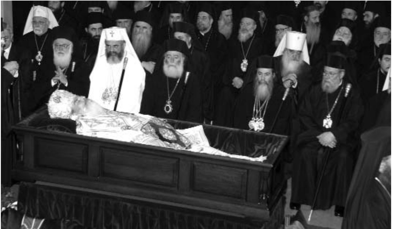
Στιγμιότυπο με τούς προκαθημένους άλλων Ὁρθοδόξων Ἐκκλησιῶν πρὸ τῆς σοροῦ τοῦ μακαριστοῦ Ἀρχιεπισκόπου Ἀθηνῶν καὶ πάσης Ἑλλάδος κυροῦ Χριστοδοῦλου.