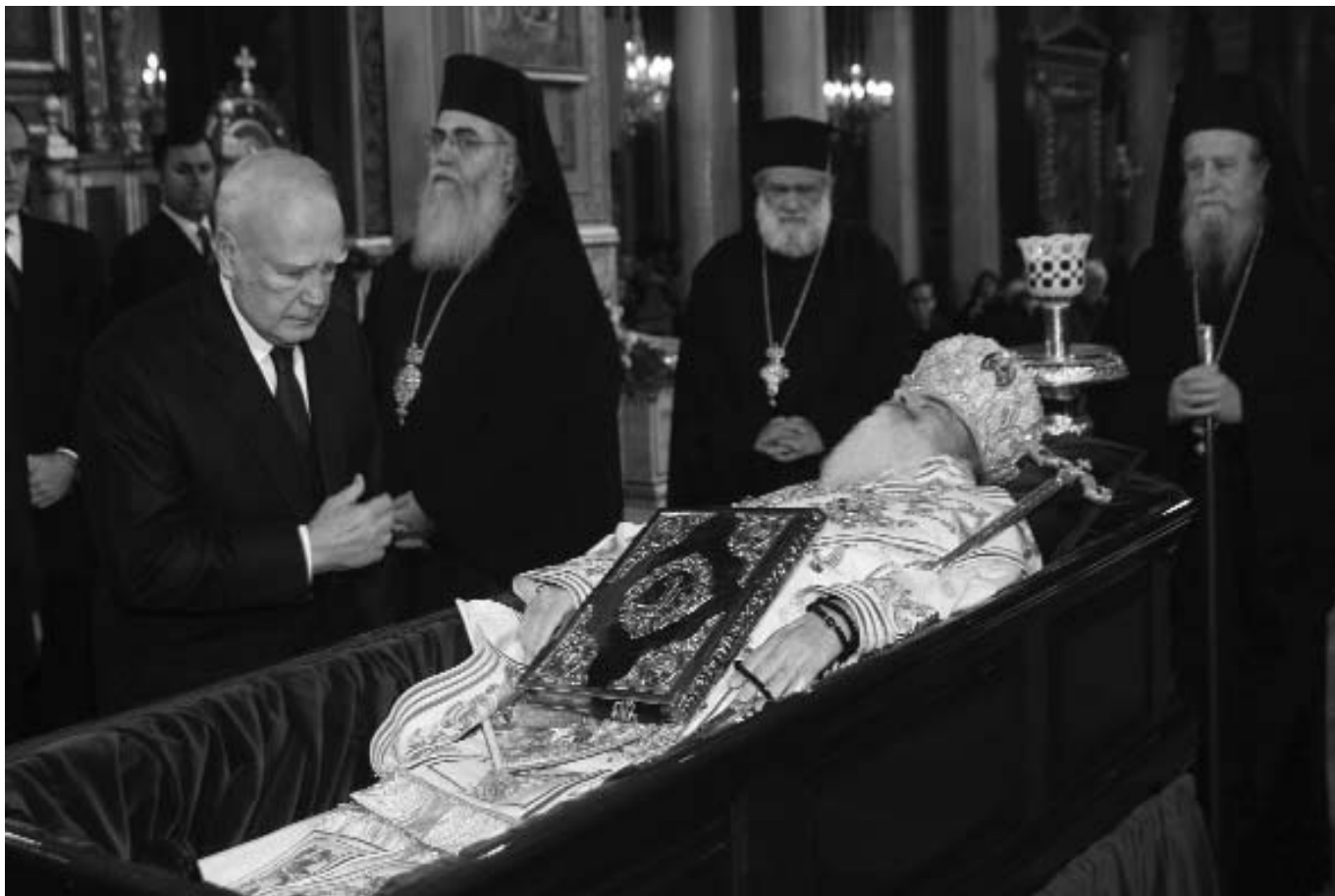
Ο Πρόεδρος της Δημοκρατίας κ. Κάρολος Παπούλιας πρὸ τῆς σοροῦ τοῦ μακαριστοῦ Ἀρχιεπισκόπου Ἀθηνῶν καὶ πάσης Ἑλλάδος κυροῦ Χριστοδούλου, στὸν Καθεδρικό Ναὸ Ἀθηνῶν.

ρότα για τὸ τέλος, καθὼς βάρυνε δραματικά, μέχρι τις 02.30 περίπου, ὅταν βυθίστηκε σὲ κῶμα, μὲ τὰ μάτια ὀρθάνοιχτα καὶ τὸ βλέμμα καρφωμένο στὴν ὀροφή, νὰ τρυπᾷ τὴν ὕλη καὶ νὰ ταξιδεύει στὸν οὐρανό. Τὸ πρόσωπό του ἔλαμπε. Μιλοῦσε ἐν σιγῇ. Ἄρχισε τὴν γλῶσσα, τὴν πολιτεία, τοῦ μέλλοντος αἰῶνος. "Ωρα 05.15". Ὁ Προκαθήμενος τῆς Ἐκκλησίας τῆς Ἑλλάδος, ὁ ἀπὸ Δημητριάδος Χριστόδουλος, σήκωσε τρεῖς φορές τὰ χέρια ψηλά, σὲ στάση δεήσεως, ἔβγαλε τρεῖς μεγάλες ἀναπνοές, ἔγειρε τὴν κεφαλὴ καὶ παρέδωσε τὸ πνεῦμα. Ἦταν ἡ στιγμή πού ἡ καρδιά τοῦ τελευταίου γνήσιου καὶ αὐθεντικοῦ Ἑλληνα ἡγέτη ἔπαυσε νὰ χτυπᾷ, βυθίζοντας τοὺς ἀμήχανους Ἑλληνες, σὲ ὅλα τὰ μήκη καὶ τὰ πλάτη τῆς γῆς, σὲ ἓνα βουβὸ καὶ γοερὸ θρῆνο.