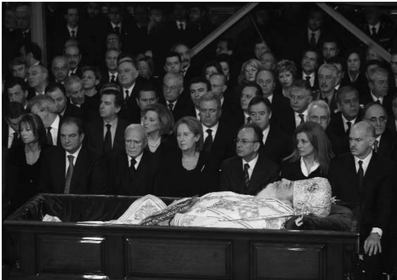
Στιγμιότυπο με την πολιτειακή και πολιτική ηγεσία προΐ της σορού του μακαριστού Ἀρχιεπισκόπου Ἀθηνῶν καὶ πάσης Ἑλλάδος κυροῦ Χριστοδοῦλου, κατὰ τὴν ἐκφώνηση τῶν ἐπικηδεῶν λόγων.

Ἡ ἀφοσίωσή του ἐνδυνάμωνε! Ἡ θέρμη του ζωογονοῦσε! Ἀγαπήθηκε ἀπὸ τὸ Λαό, ἀγαπήθηκε ἀπὸ τὶς νέες καὶ τοὺς νέους μας, πού τόσο ἀγάπησε. Πλησίασε καὶ ἔφερε πιὸ κοντὰ στὴν Ἐκκλησία τὴ νέα γενιά. Ἔφερε τὴν Ἐκκλησία στὴ σύγχρονη ἐποχὴ καὶ τὸ σύγχρονο ἄνθρωπο στὴν Ἐκκλησία. Ἔσκυψε στὰ καθημερινὰ προβλήματα τῆς Κοινωνίας καὶ στὶς ἀγωνίες τῆς νέας γενιᾶς. Τόλμησε νὰ συγκρουστεῖ μὲ τὸν κυνισμό τῆς ἐποχῆς καὶ τὶς ἀντιλήψεις πού ἀπομακρύνουν τὸν ἄνθρωπο ἀπὸ τὸν ἄνθρωπο. Κατήλυθε τὴ θρησκεία πλησιέστερα στὴ ζωὴ τῶν Ἑλλήνων. Πέρασε τὴν Ἐκκλησία τῆς Ἑλλάδος ἀπὸ τὸν 20ὸ στὸν 21ο αἰῶνα,