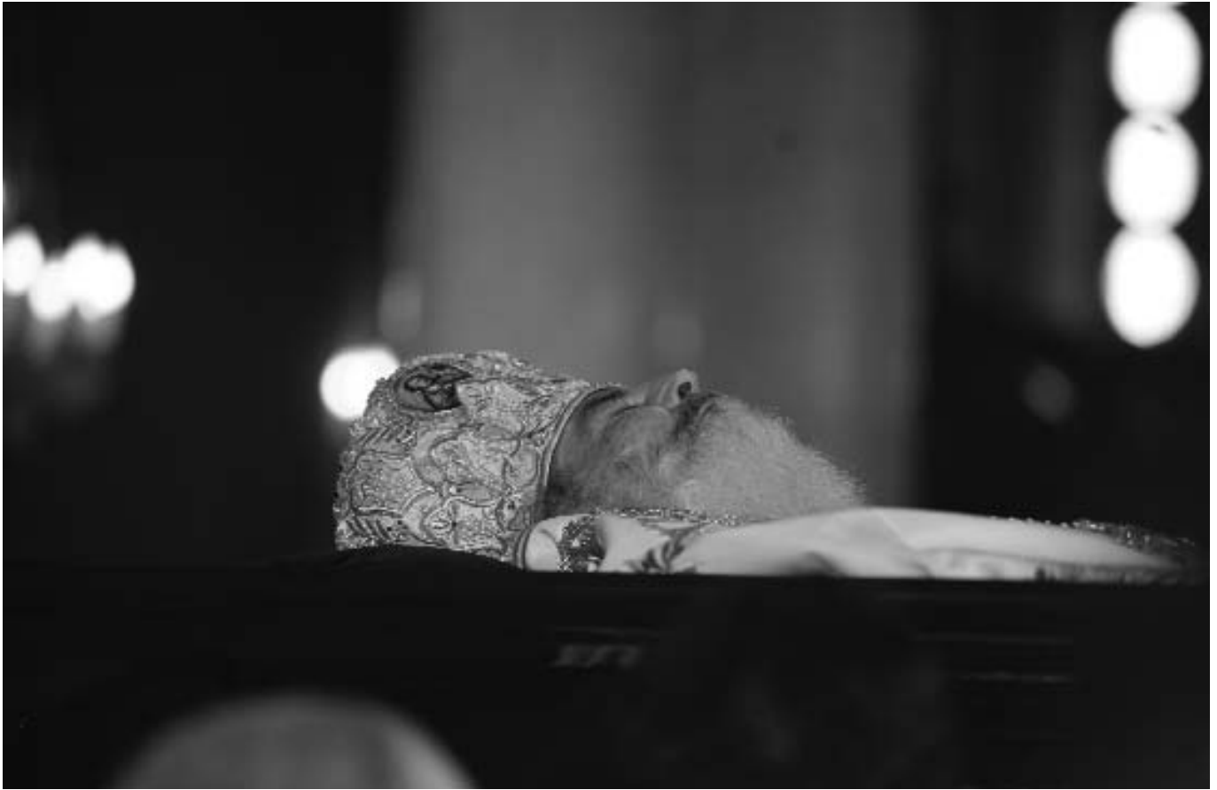
Ὁ Μακαριστὸς Ἀρχιεπίσκοπος Ἀθηνῶν καὶ πάσης Ἑλλάδος κυρὸς Χριστόδουλος.

τόσο στὸ πλαίσιο τῆς Ἱερᾶς Συνόδου τῆς Ἐκκλησίας τῆς Ἑλλάδος. Ἐπὶ τῶν ἡμερῶν του ιδρύθησαν ξενῶνες γιὰ τὴν κακοποιημένη γυναῖκα, ὁργανώθηκαν συσσίτια γιὰ χιλιάδες ἀπόρους ἀσχέτως καταγωγῆς καὶ θρησκείας καὶ ιδρύθηκε ἡ Μ.Κ.Ο. «Ἀλληλεγγύη», ἡ ὁποία ὁργάνωσε ἀνθρωπιστικὲς ἀποστολὲς σὲ παγκόσμια κλίμακα.