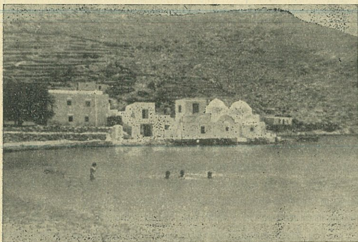
Ὁ Ναὸς τοῦ Ταξιάρχου εἰς τὸν λιμένα τοῦ «Βαθειοῦ».

— «Ν' ἀγαπάτε, παιδιά μου, πάντα σας τὴ δουλειά. Γιατὶ αὐτὴ εἶναι ὁ μοναδικὸς δρόμος πρὸς τὴν προκοπή. Ἐνῶ ἡ τεμπελιά μᾶς φέρνει πάντα στὴ δυστυχία. Καὶ