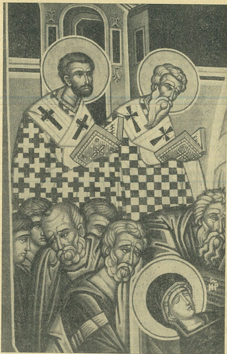
Ἀπόσπασμα ἐξ εἰκόνης τῆς Κοιμήσεως, ὅπου παρίστανται μερικοὶ ἐκ τῶν μαθητῶν περὶ τὸ ἱ. σκῆνος τῆς Θεοτόκου, καὶ ἄνωθεν αὐτῶν οἱ ἱεράρχαι Τιμόθεος καὶ Ἰάκωβος ὁ Ἀδελφόθεος.