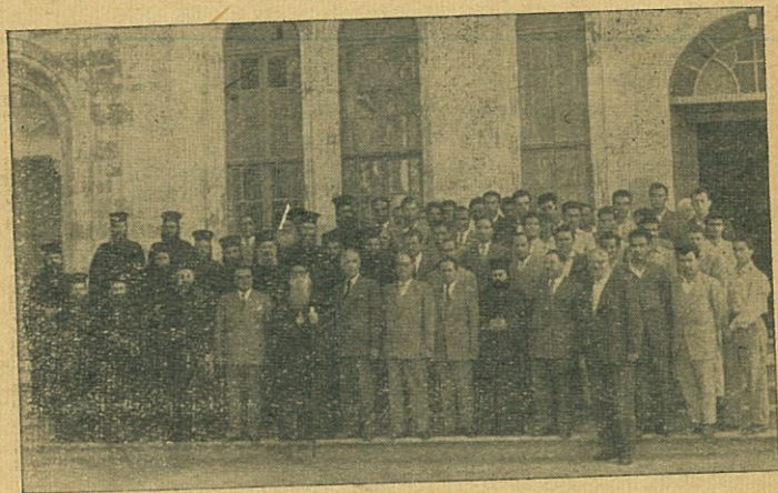
Ἀπὸ τὸ Κατηχητικὸν Συνέδριον τοῦ Βόλου.

Τ. Α. Κ. Ε.: Τρίκκης καὶ Σταγῶν Δωροθέου, Προέδρου τοῦ Τ. Α. Κ. Ε., Ἐγκύκλιος, περὶ τῶν δικαιωμάτων τῶν ἠσφαλισμένων ἐπὶ τοῦ κλάδου ἀσθενείας, σελ. 496. — Εἰδήσεις Τ. Α. Κ. Ε., σελ. 61, 169, 213, 273, 308, 339, 372, 433, 500, 560, 624.