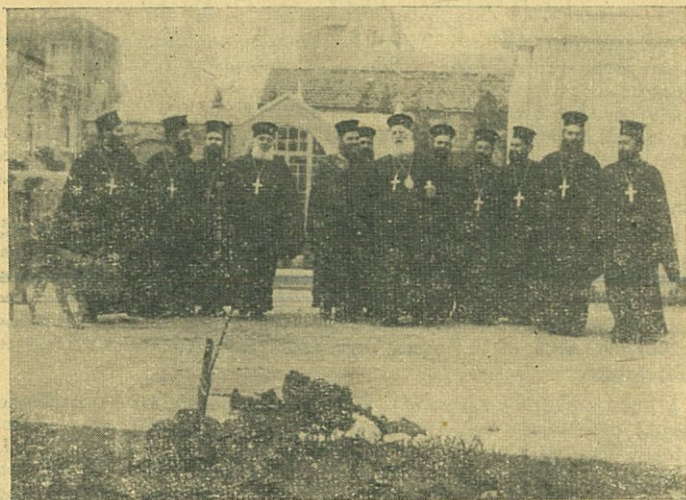
Ὁ Σεβ. Μητροπολίτης Χίου κ. Παντελεήμων ἐπὶ κεφαλῆς τῶν 12 Ἱεροκληρύκων του, εἰς μίαν ἐκκίνησιν διὰ τὴν ἐβδομαδιαίαν ἱεραποστολικὴν των ἐξόρμησιν.