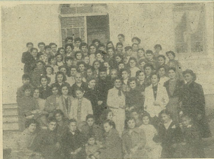
Κατηχητικὸν Σχολεῖον Ἐργαζομένων καὶ Ἐξωσχολικῶν Νεανίδων Νέας Ἀρτάκης.