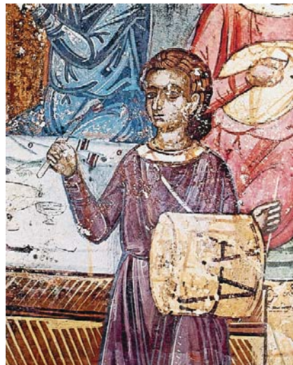
Η παραβολή του πλουσίου, λεπτομέρεια Αγ. Δημήτριος, Χρυσάθα Λακωνίας, 17ος αϊ.

Όλοκληρώνοντας, θά έλεγα νά μη φοβόμαστε τό διαφορετικό και θά κατέφευγα στα λόγια του ποιητή... Κι όμως τό ιδιοφυέστερο προίόν τής φαντασίας είναι ή παραδοχή του παράδοξου, και θά πρόσθετα ότι χρειάζεται πολύ προσοχή στην επιλογή μιās λειτουργικής πολιτικής, αφού οί λάθος ιδέες πληρώνονται πάντα μέ αίμα, μόνο πού πρόκειται για τό αίμα τών άλλων.