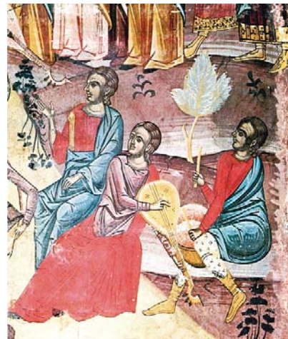
«Αἰνεῖτε τόν Κύριο», λεπτομέρεια Τ. Μ. Τυμ. Προδρόμου, Μακροναρῆξι Σερρών, 17ος αἰ.

Καί ἂν, τέλος, ὁ ναός τῆς Ἱερουσαλήμ ὡς τόπος κατοικίας τοῦ Θεοῦ ἦταν γιά τοὺς Ἰουδαίους ἅγιος, δίκαια ἡ Μαρία ἀποκαλεῖται ἀπό τοὺς χριστιανούς Παναγία. Μέ τήν εἰκόνα τῆς εἰσόδου τῆς Μαρίας στόν ναό τοῦ Θεοῦ δηλώνεται σαφέστατα ἡ κατάργηση τῶν διαχωριστικῶν ὁρίων μεταξύ οὐράνιου καί ἐπίγειου κόσμου πού ἐπιτεύχθηκε μέ τή σταυρική θυσία καί τήν ἀνάσταση τοῦ Χριστοῦ. Τώρα πιά ὅλοι ἔχουν τή δυνατότητα νά γίνουν πολῖτες τοῦ οὐρανοῦ. Ὅμως αὐτή ἡ δυνατότητα, αὐτή ἡ χάρις πού ἔκανε ὁ Θεός στοὺς ἀνθρώπους, δέν εἶναι ἀπαλλαγμένη ἀπό ὑποχρεώσεις. Ἐφ' ὅσον ὅλος ὁ κόσμος, ὅπως ἀναφέρθηκε, ἔγινε ἕνας ναός τοῦ Θεοῦ, δέν εἶναι δυνατόν νά συμπεριφέρεται κανεῖς διαφορετικά στήν καθημερινή του ζωή καί διαφορετικά τίς Κυριακές μέσα στήν ἐκκλησία. Ἐάν στήν ἐκκλησία ἔρχεται κανεῖς γιά νά δοξάσει τόν Θεό, τό ἴδιο ὀφείλει νά κάνει καί μέ ὅλες τίς πράξεις του στήν καθημερινή του ζωή.