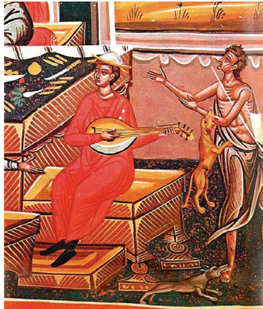
Λεπτομέρεια ἀπό τήν τοιχογραφία μέ τήν παραβολή τοῦ πλουσίου Τ. Μ. Λουκοῦς Κυνουρίας, 16ος / 17ος αἰ.