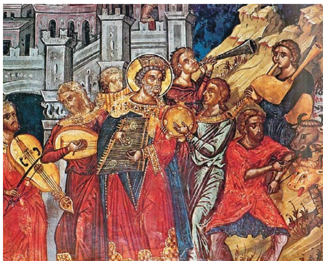
Τοιχογραφία Καθολικοῦ Ἱ. Μ. Βαρλαάμ, Μετέωρα, 16ος αἰ.

Ἡ λιθόστρωτη κεντρική ἐμπορική ὁδός, ἡ «Παλλάδιος», ὁδηγοῦσε στό κέντρο τῆς πόλεως καί ἦταν διακοσμημένη μέ κιονοστοιχία στή μιᾶ πλευρά της. Στό τέλος της ὑπῆρχε ἀρχαῖο ρωμαϊκό θέατρο χωρητικότητας ἕως 7.000 θεατῶν. Ἀργότερα, οἱ ἀνασκαφές ἔφεραν στό φῶς μεγάλο βυζαντινό λουτρό, κοντά στό θέατρο, καί ἕνα μικρό ὠδεῖο.