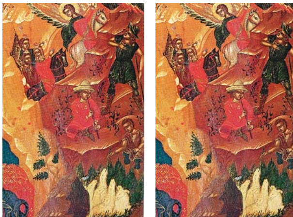
Λεπτομέρεια ἀπό τή Γέννηση, Καθολικό Ἱ. Μ. Μ. Λαύρας, 16ος αἰ.