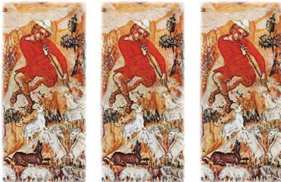
Λεπτομέρεια ἀπό τή Γέννηση, Καθολικό Ἱ. Μ. Βαρλαάμ, Μετέωρα 18ος αἰ.

1. Ἦσ. 9.6. 2. Ἦσ. 1.3. 3. Βαρούχ 3.38. 4. Α' Πέτρο. 2.22. 5. Α' Τιμ. 2.4. 6. Δογματικό Θεοτοκίο Ἀποστίχων Μ. Ἐσπερινοῦ Σαββάτου. Ἦχος πλ. Β', Παρακλητική. 7. Πρβλ. Ἐφεσ. 5.23. 8. Ἐβρ. 2.17. 9. Ἐβρ. 7.7. 10. Ματθ. 2.3-18. 11. Ἐφύμνιο τροπαρίου Ἐσπερινοῦ Χριστουγέννων. Πρβλ. Ματθ. 2.1-12. 12. Λουκ. 2.13-14. 13. «Λάμψας ἐν τῇ Αἰγύπτῳ φωτισμόν ἀληθείας, ἐδίωξας τοῦ ψεύδους τό σκότος· τά γάρ εἰδῶλα ταύτης Σωτήρ μὴ ἐνέγκαντά σου τήν ἰσχύν, πέπτωκεν» (Ἀκάθιστος Ὑμνος). 14. Λουκ. 2.22-32. 15. Λουκ. 2.36-38. 16. Ἱερεμ. 38.15. Ματθ. 2.18. 17. Λουκ. 2.40. 18. Λουκ. 2.51. 19. Ἀκάθιστος Ὑμνος (Ν). 20. Ἦσ. 9.6. 21. Δανιήλ 7.22. 22. Ἱερεμ. 27.34. 23. Ἦσ. 11.1. 24. Ἦσ. 9.2. 25. Ζαχ. 6.12. 26. Ζαχ. 9.9. 27. Ἀββακ. 3.3. 28. Ἐβρ. 1.1-3. 29. Εἰς τό Γενέθλιον τοῦ Σωτήρος ἡμῶν Ἰησοῦ Χριστοῦ, Λόγος Β' παρ. 2. ΕΠΕ 35.4726-20 (PG 56.389). 30. Κοντάκιο Χριστουγέννων.