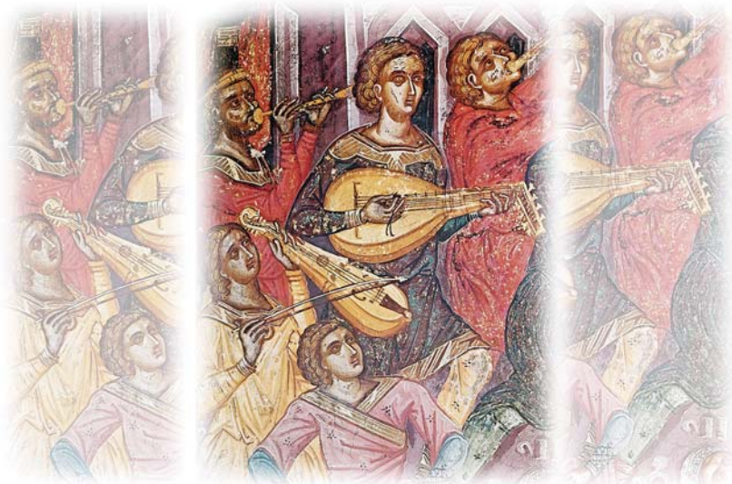
Καθολικό Ἱ. Μ. Βαρλαάμ, Μετέωρα, 16ος αἰ.