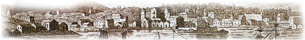
Πρέβεζα (A.G. Saint - Sauveur)

Γιά τόν ἀπόστολο Παῦλο, ὁ Θεός γίνε- ται παρών ἄλλοτε ὡς «ὁ ἐνεργῶν ἐν ἡμῖν [...] ὑπέρ τῆς εὐδοκίας» (Φιλ. 2,13), καί ἄλλοτε ὡς «ἡ ἐνέργεια αὐτοῦ ἢ ἐνεργουμένη ἐν ἐμοί ἐν δυνάμει» (Κολ. 1,29). Κυρίως ὁμως, γιά τόν Παῦλο, ὁ Χριστός εἶναι αὐτός πού συγκεφαλαιώνει τήν παρουσία τοῦ Θεοῦ ὡς δύναμη καί σοφία: «Χριστός Θεοῦ δυνάμεις καί Θεοῦ σοφία» (Α' Κορ. 1,24).