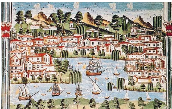
Ἀμπελάκια (τιμῆμα τοιχογραφίας ἀπό τό σπίτι τοῦ Γ. Σβάρτζ)