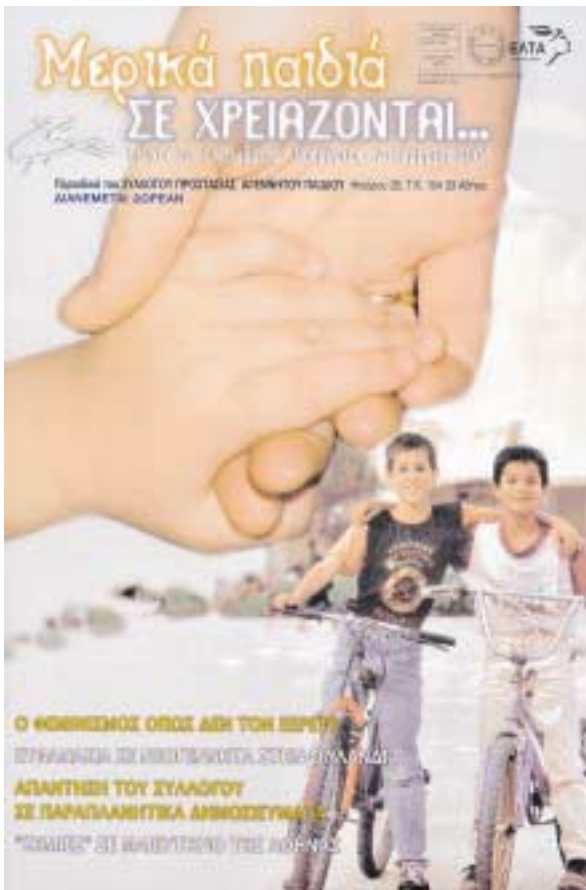
Καλόγουστο, προσεγμένο, μεστό, άποκαλυπτικό. Μια άκόμη συστηματική και σεμνή δραστηριότητα του Συλλόγου Προστασίας Άγέννητου Παιδιού.

Ή έξόδιος Άκολουθία έψάλη στο Καθολικό τής Μονής προεξάρχοντος του Σεβ. Μητροπολίτου Μαντινείας κ. Άλεξάνδρου. Συμμετείχαν ό Άρχιγραμματεὺς τής Ί. Συνόδου και προηγούμενος τής Μονής, σήμερα Σεβ. Μητροπολίτης Πατρῶν κ. Χρυσόστομος, ό Έγούμενος τής Μονής Άρχιμ. Μελχισεδέκ, οι άδελφοί τής Μονής, πολλοί κληρικοί τής Ί. Μητροπόλεως και πλήθος κόσμου.