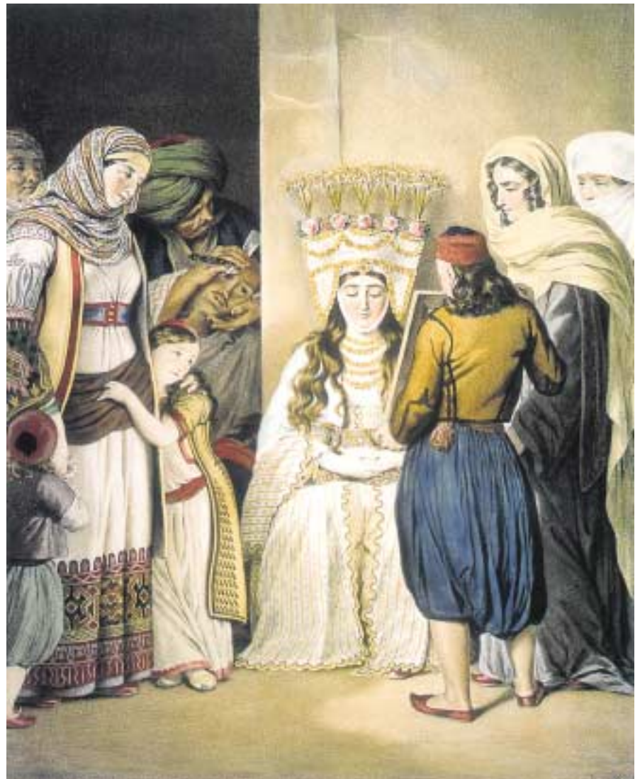
Γάμος στην Αθήνα του 19ου αιώνα. Χαλκογραφία του L. Dupré (1825).

Οι άνδρες κατέγραψαν τα εξής: Οικονομικό πρόβλημα , πρόβλημα εργασίας , δεν υπήρχε άνθρωπος να τον νοιάζεται και να τον κάνει να πιστέψει στο γάμο , συμβίωση , έλλειψη χρόνου , απώλεια γονιών , δημιουργία σπιτιού , διάφορα έξοδα. [Συνοπτικά: