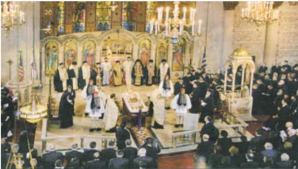
Στιγμότυπο από την Εξόδιο Ακολουθία του μακαριστού Αρχιεπισκόπου Αμερικής Ιακώβου στην οποία παρέστη και ό Μακ. κ. Χριστόδουλος.