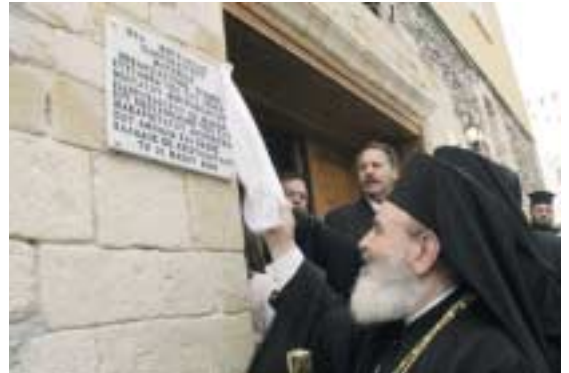
Ὁ Μακαριώτατος ἀποκαλύπτει τὴν ἀναμνηστικὴ πλάκα στὸ Ἐπισκοπεῖο τῆς Ἱ. Μ. Σιδηροκάστρου.

Ἀπευθυνόμενος στὸ ἐκκλησίασμα, τόνισε: «Ὅλοι ἔχουμε στραμμένο τὸ βλέμμα τῆς ψυχῆς μας σ' αὐτὲς τὶς ἀκριτικές περιοχές, οἱ ὁποῖες εἶναι βαμμένες μὲ τὸ αἷμα ἐκείνων οἱ ὁποῖοι ἀγωνίστηκαν γιὰ νὰ παραμείνουν τὰ ἐδάφη αὐτὰ ἑλληνικά». «Ἐχουμε ὅλοι ἱερὴ ὑποχρέωση», ὑπογράμμισε, «νὰ ἀγωνιζόμαστε γιὰ τὰ ἰδανικά τῆς Πίστης καὶ τῆς Πατρίδας μας».