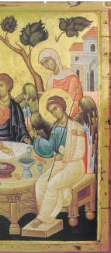
Ἁγία Τριάς, εἰκόνα

Τὸ Ἅγιο Πνεῦμα εἶναι τὸ δῶρο τοῦ Θεοῦ. Καὶ τὰ δῶρα δίδονται πάντοτε ἀπρόοπτα· τότε πού θέλει Ἐκεῖνος πού τὰ δίνει. Καὶ τὰ δίνει σὲ ὅποιον θέλει. Κάνουν μεγάλο λάθος ἐκεῖνοι πού περιμένουν νὰ λάβουν τὸ Ἅγιο Πνεῦμα μετὰ τὸν τάδε ἢ στὴν τάδε ὥρα. Ἐκεῖνοι πού ἐφευρίσκουν μέσα των ἐπινοήσεων τους γιὰ νὰ λάβουν τὸ Ἅγιο Πνεῦμα, ὄχι μόνον δὲν θὰ τὸ εὔρουν πούθεν ἀλλὰ παίρνουν ἐπάνω τους καὶ μιὰ βαρεῖα ἁμαρτία.