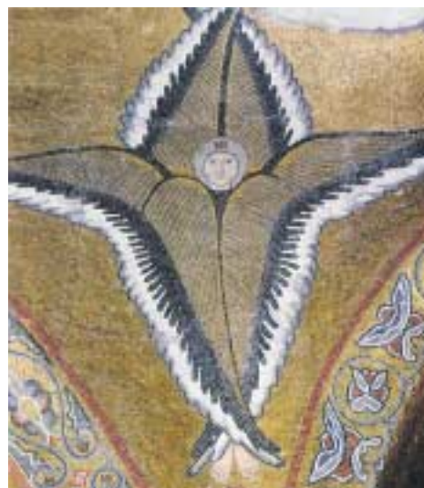
Ἐξαπτέρυγο, 1042 - 1056. Χίος, Νέα Μονή, καθολικό.

σελ. 259, 20-22), δεδομένου ὅτι ὁ Ψαλμωδὸς ἀναφέρει ὅτι «καὶ ἐπείρασαν καὶ παρεπίκραναν τὸν Θεὸν τὸν Ὑψιστον (Ψαλμ. 77, 56). Συνεπὸς εἶναι ἀναπολόγητοι ὅλοι οἱ Πνευματομάχοι, οἱ ὁποῖοι ἀρνοῦνται τὴν Θεότητα τοῦ Ἁγίου Πνεύματος, ἐφ' ὅσον καὶ ὁ συγγραφέας τῆς πρὸς Ἑβραίους ἐπιστολῆς καὶ ὁ Ψαλμωδὸς τὴν τονίζουν, κατὰ τὰ προαναφερθέντα. Αὐτοὶ δὲν μποροῦν νὰ κατανοήσουν τὶς πύρινες γλῶσσες, οἱ ὁποῖες κάθισαν στους Ἀποστόλους τὴν ἡμέρα τῆς ἔλευσης τοῦ Ἁγίου Πνεύματος (πρβλ. Πράξ. 2, 3), οἱ ὁποῖες φωτίζουν γιὰ τὴν ἀναζήτηση βαθύτερου νοήματος τῆς Βίβλου (πρβλ. ΒΕΠΕΣ τ. 69, σελ. 259, 30-32) καὶ εἶναι σὰν νὰ πιστεύουν ὅτι οἱ Ἀπόστολοι «γλεύκους μεμεστωμένοι εἰσὶ» (Πράξ. 2, 13). Ἄλλὰ καὶ ἂν οἱ αἰρετικοὶ διδάσκουν ὅλες τὶς κακοδοξίες τους, οἱ ὀρθόδοξοι πρέπει νὰ μὴ φοβοῦνται τὶς βλεδυρὲς διδασκαλίες τους. Εὐχῆς ἔργον θὰ ἦταν νὰ γευτοῦν καὶ ἐκεῖνοι τὸ γλεύκος αὐτό, τὸ ὁποῖο «ἐπάτησε διὰ τοῦ Εὐαγγελίου ὁ Κύριος» (ΒΕΠΕΣ τ. 69, σελ. 259, 37, πρβλ. Ἦσ. 63, 3), προκειμένου νὰ καταστήσει πόσιμο τὸ δικό του αἷμα. Δυστυχῶς ὅμως ὅλοι οἱ πεπλανημένοι δὲν μποροῦν νὰ δεχτοῦν αὐτὸ τὸ γλεύκος, ἐπειδὴ διατηροῦν τὸν παλαιὸ ἀσκό, ὁ ὁποῖος δὲν μπορεῖ νὰ συγκρατήσῃ τὸ καινούργιο γλεύκος. Ὁ ἅγιος Γρηγόριος Νύσσης καταλήγει τὴν ὁμιλία του μὲ δοξολογία πρὸς τὸν Ἰησοῦ Χριστό (ἔ.ἀ., σελ. 260, 11-12).