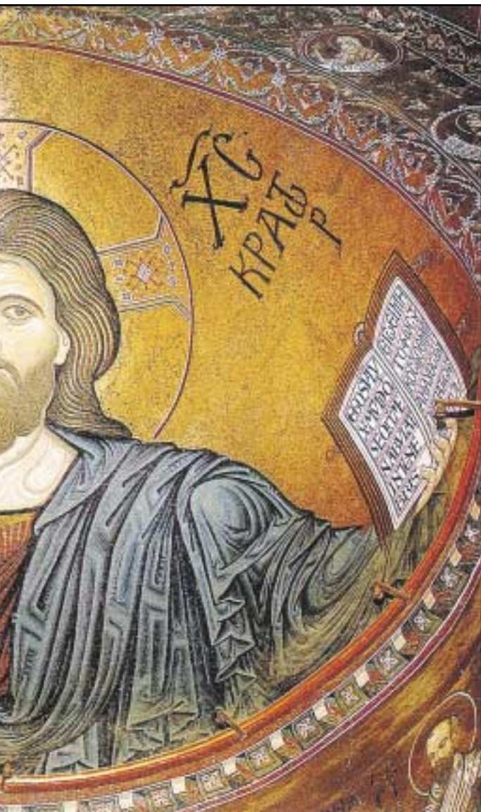
Σικελία, Μονρεάλε, Μητρόπολη

Ἡ μέση ὁδὸς βρίσκεται στὸ δρόμο τῆς Ἐκκλησίας, ὄχι γιατί ἡ Ἐκκλησία προσπάθησε νὰ συμβιβάσει τὶς ἀποκλίνουσες ἀπόψεις, ἀλλὰ γιατί αὐτὴ εἶναι ἡ ἀποκάλυψη τῆς ἀλήθειας. Καὶ πρέπει νὰ σημειωθῆ ὅτι μὲ πάθος ἀγωνίσθηκε ἡ Ἐκκλησία ἐπὶ αἰῶνες πολλοὺς γιὰ νὰ διαμορφώσει τὰ χριστολογικὰ δόγματα, ἀλλὰ καὶ νὰ ἐπιλύσει καὶ πολλὰ ἄλλα συναφῆ χρονίζοντα προβλήματα. Ἔτσι μὲ τὶς Γ, Δ, ΣΤ καὶ Ζ' Οἰκουμεικὲς τῆς Συνόδου ἡ Ἐκκλησία κατόρθωσε νὰ σώσει τὴν ἀλήθεια τῆς σάρκωσης τοῦ Θεοῦ ἀπὸ τὸν κίνδυνο τῆς ἀλλοίωσης τῆς μὲ βάση τὸν φιλοσοφικὸ στοχασμὸ. Ὁ Χριστὸς τῶν αἱρέσεων –ὅπως παρατηρεῖ ὁ Χρ. Γιανναράς– «ἦταν ἓνα ἠθικὸ ὑπόδειγμα τέλειου ἀνθρώπου ἢ μιὰ ἀφηρημένη ἰδέα ἄσαρκου Θεοῦ. Καὶ στὶς δύο περιπτώσεις ἡ ζωὴ τῶν ἀνθρώπων δὲν ἀλλάζει οὐσιαστικὰ σὲ τίποτε, τὸ ζω-