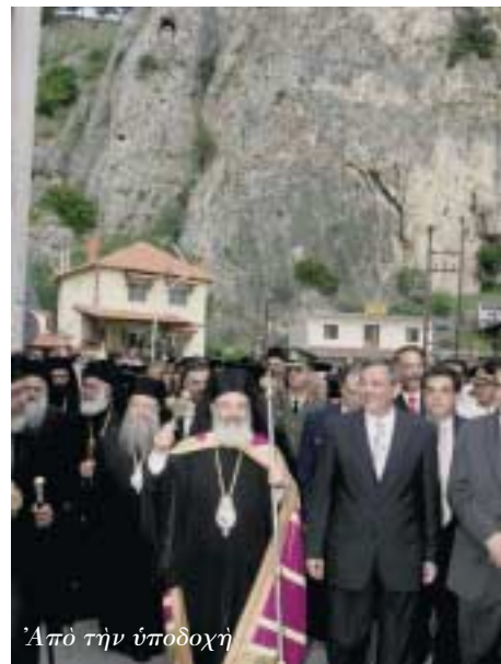
Ἀπὸ τὴν ὑπόδοχῃ