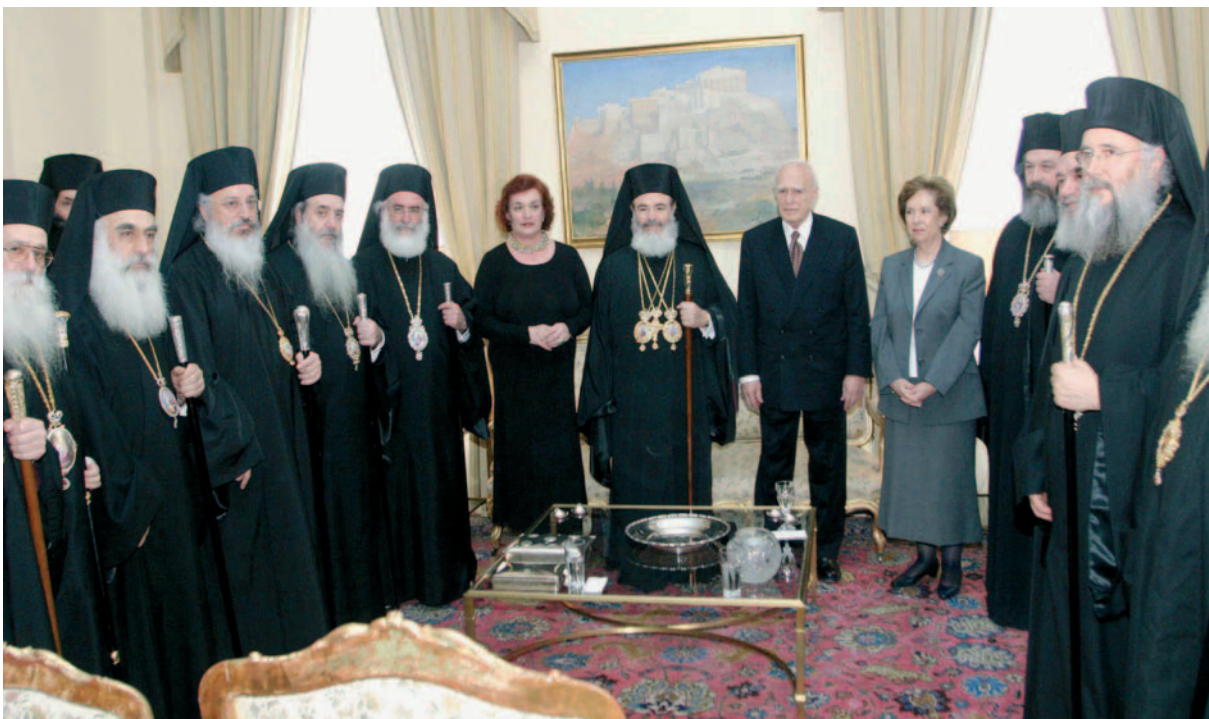
Ὁ Μακαριώτατος καὶ μέλη τῆς Ἱ. Συνόδου μὲ τὸν Πρόεδρο τῆς Δημοκρατίας, τὴν Πρόεδρο τῆς Βουλῆς καὶ τὴν Ὑπουργὸ Παιδείας κατὰ τὸ ἐπίσημο γεῦμα γιὰ τὴν Ἡμέρα τῆς Ὁρθοδοξίας (20 Μαρτίου 2005).

5. Τὸ ζήτημα τῆς τακτικῆς καὶ συνεποῦς ἐπιτελέσεως τῶν λειτουργικῶν, ἀγιαστικῶν καὶ ἱεροποστολικῶν καθηκόντων σας εἶναι καιρίας σημασίας. Δὲν εἶσθε ὑπάλληλοι, ὥστε νὰ ἐργάζεσθε μὲ ὠράριον ἐργασίας ἢ ὅταν δὲν ἔχετε ἐφημερίαν νὰ λείπετε ἀπὸ τὸν Ναὸν σας καὶ νὰ ἐμφανίζεσθε μόνον κατὰ τὴν ἐβδομάδα σας.