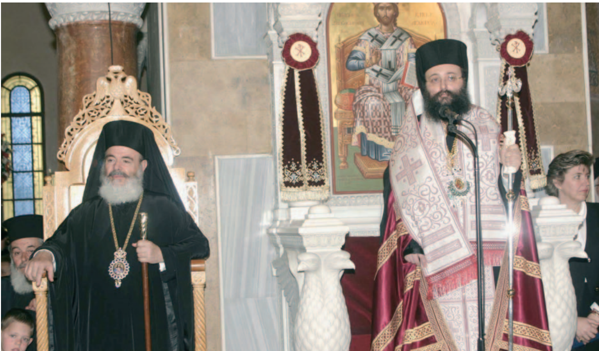
Στιγμιότυπο ἀπὸ τὴν ἐνθρόνιση τοῦ Σεβ. Μητροπολίτη Πατρῶν (2 Ἀπριλίου 2005).

ὄρκους ἐνώπιον τῆς Ἐκκλησίας, ὅτι θὰ τηρήσετε ἀκτημοσύνη σὲ ὅλη σας τὴ ζωὴ, καὶ ὑπακοή καὶ παρθενία. Γιατί λοιπὸν ἐπιδίδεσθε πολλοὶ ἀπὸ σᾶς στὸν ἀδικαιολόγητο πλουτισμό; Γιατί σκανδαλίζετε τὸ λαὸ μὲ τὶς κοσμικὲς σας ἐπιδόσεις; Γιατί ὠρισμένοι συμπεριφέρεθε πρὸς τοὺς πρεσβυτέρους σὲ ἡλικία συναδέλφους σας μὲ ἐγωισμό καὶ ἔπαρση; Γιατί κάνετε παρές πού δὲν σᾶς συνιστοῦν; Γιατί δὲν παραμένετε προσηλωμένοι ἀποκλειστικὰ στὰ πνευματικὰ σας ἔργα; μὲ αὐτὰ πού γράφω ἐδῶ δὲν θέλω νὰ ἐξαιρέσω καὶ τοὺς ἐγγάμους, πολλοὶ τῶν ὁποίων φανερόνουν παρεμφερῆ συμπτώματα. Ξέρω ὅτι οἱ περισσότεροι ἀπὸ σᾶς προσφέρετε στὴν Ἑνορία σας πολὺτιμες ὑπηρεσίες σὲ ὅλους τοὺς τομεῖς. Καὶ ὅτι ἔχετε ἀνεπίληπτον βίο. Γι' αὐτὸ καὶ σᾶς ἔχω κατ' ἐπανάληψη ἐπαινέσει γι' αὐτὰ. Ὁμιλῶ ἐδῶ γιὰ ἐκείνους, τοὺς ὀλίγους, πού ἔχουν λησμονήσει τὴν ἀποστολὴν των, πού τοὺς ἐνδιαφέρει μόνον ἢ ἐπίδειξη, τὰ φανταχτερὰ ἄμφια, ἢ κομπορρημοσύνη. Ποῦ εἶναι ἡ ταπείνωση πού ὑψώνει τὸν ἄνθρωπο; Τὰ ἀξιώματα παντοῦ, ἀλλὰ καὶ στὴν Ἐκκλησία, ὅταν δίδονται σὲ ἀνώριμους ἀνθρώπους, γεννοῦν τύφωση καὶ ἀλαζονεία. Ἀντίθετα ὅταν τὰ ἀξιώματα κατέχουν σοβαροί, ὑπεύθυνοι καὶ μετρη-