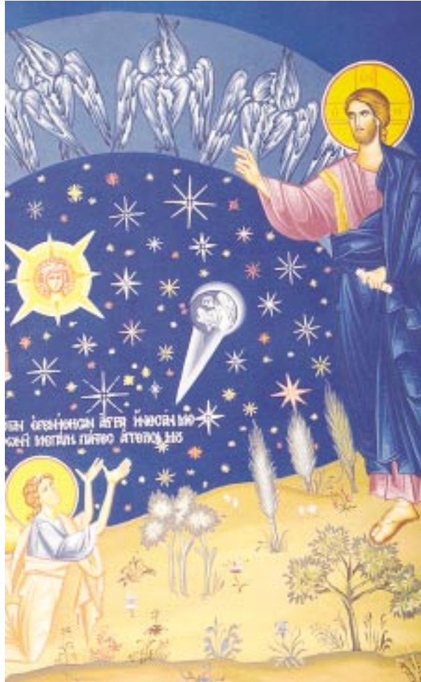
Ἡ Δημιουργία τῶν ἄστρον. Τοιχογραφία I.M. Ἁγίου Ἰωάννου Προδρόμου Μακρυνοῦ Μεγάρων

Ἡ Ἐκκλησία, λοιπόν, στηριζόμενη στὴν ἀποκάλυψη τοῦ Θεοῦ, μᾶς λέει ὅτι ὁ κόσμος εἶναι ἀποτέλεσμα τῶν ἐνεργειῶν τοῦ Θεοῦ, μέσα ἀπὸ οὐσίες ἑτερογενεῖς πρὸς τὴν Οὐσία τοῦ Θεοῦ. Ὁ κόσμος εἶναι κατὰ τὴν οὐσία του διαφορετικὸς ἀπὸ τὴν οὐσία τοῦ Θεοῦ, ὅπως π.χ. ἓνα ποίημα πού ἔγραψε ἓνας ποιητὴς εἶναι μὲν δικό του, φανερώνει ἔμμεσα τὸ πρόσωπό του, δὲν εἶναι ὅμως ὁ ἴδιος ὁ ποιητὴς. Μέσα ἀπὸ τὸ ποί-