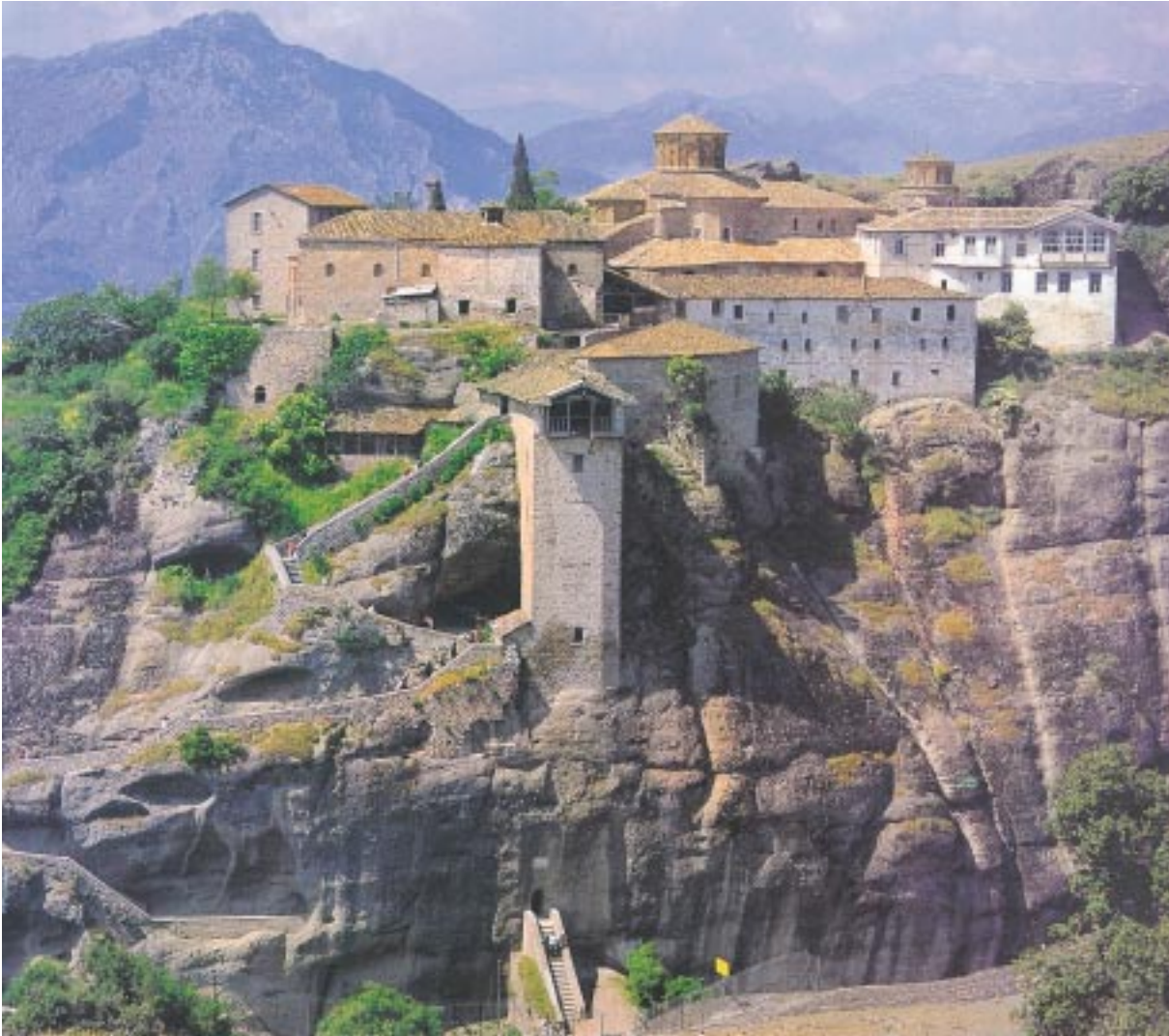
Ἡ Ἱερά Μονή Μεταμορφώσεως Μετεώρων