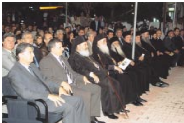
Ὁ Μακαριώτατος, οἱ Σεβ. Μητροπολίτες Σταγῶν καὶ Μετεώρων καὶ Γλυφάδας καὶ πολλοὶ ἐπίσημοι σὲ στιγμιότυπο ἀπὸ τὴν ἐκδήλωση.