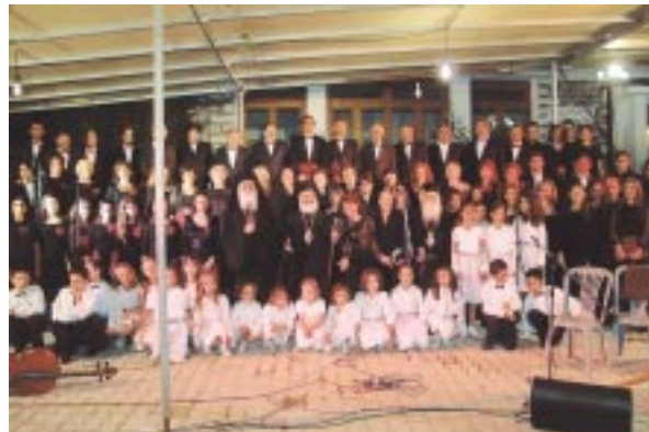
Ἡ χορωδία Τρικάλων μετὰ τὴν ἐκδήλωση στοὺς Σταγιάδες.

Ἐν ὅλα αὐτὰ συντελοῦν στὴ συνέχιση τῆς πορείας τῶν Ἀδελφῶν κατὰ τὴ γνωστὴ παραγγελία τοῦ ἀποστόλου Παύλου: «Ἀδιαλείπτως προσεύχεσθε» (Α΄ Θεσσαλ. 5, 17) καὶ κατὰ τὴν ἔκφραση τοῦ Ὁσίου Ἰωάννου τοῦ ἀσκητοῦ: « Διακονεῖν ἔστι, σώματι μὲν ἀνθρώπους παρεστῶς, νοῦ δὲ ἐν οὐρανοῖς διὰ προσευχῆς κρούων ».