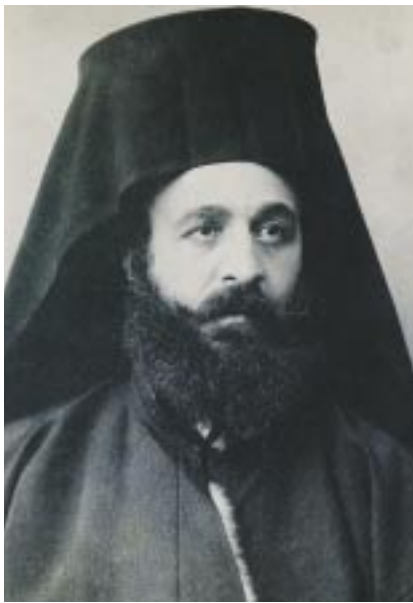
Ὁ Γερμανὸς Καραβαγγέλης

Ὁ ναύαρχος, σπουδαία μορφή καὶ στὰ μετέπειτα ἱστορικὰ γεγονότα, τὴ συμβούλεψε νὰ συναντήσῃ τὸν Γερμανὸ Καραβαγγέλη, μητροπολίτη Καστοριάς κατὰ τὰ γεγονότα τοῦ Μακεδονικοῦ, πού τότε βρισκόταν στὴν Ἀθήνα. Χαρακτηριστικὰ εἶναι τὰ λιτὰ λόγια της μὲ τὰ ὁποία κάνει μιὰ πρώτη περιγραφή του: «Γιὰ κείνον πού θέλει νὰ μελετήσῃ τὴν ἱστορία τοῦ Μακεδονικοῦ Ἄγωνα καὶ ἰδίως τοῦ Ἄγωνα τῆς δυτικῆς Μακεδονίας εἶναι ἀπαραίτητο νὰ γνωρίσῃ τὴν ἐξαιρετικὴ φυσιογνωμία τοῦ τότε μητροπολίτη Καστοριάς Γερμανοῦ, καὶ τὴν ἐπικὴ, ἀλήθεια,