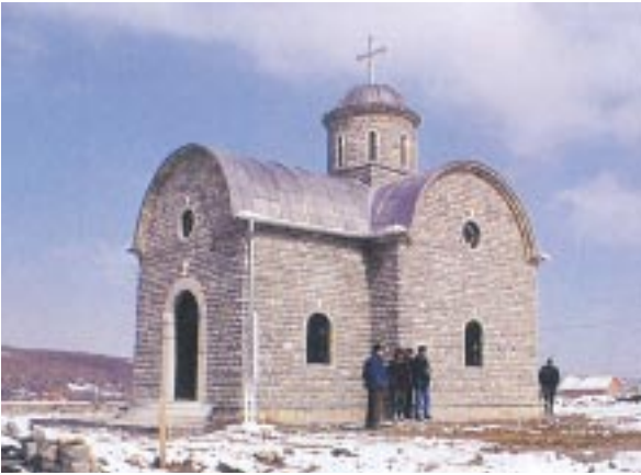
Άνοικοδόμηση ναών στο Κόσοβο.

ναι ή κοινωνική και οικονομική ενίσχυση των λιγότερο εύνοουμένων κοινωνικών ομάδων και ή βελτίωση των συνθηκών διαβιώσεώς τους, μέσω της παροχής κάθε δυνατής βοήθειας. Ειδικότερα, άποστολή της «Άλληλεγγύης» είναι: