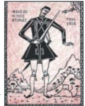
ΕΞΟΦΥΛΛΟ: Παῦλος Μελάς (Φ. Κόντογλου)