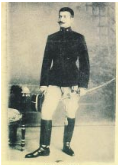
Ὁ Καπετὰν Φούφας

Πολεμώντας μαζὶ μὲ τὸν καπετὰν Ζάκα στὸ Παλαιοχώρι Καστανοχωριῶν σκοτώθηκε