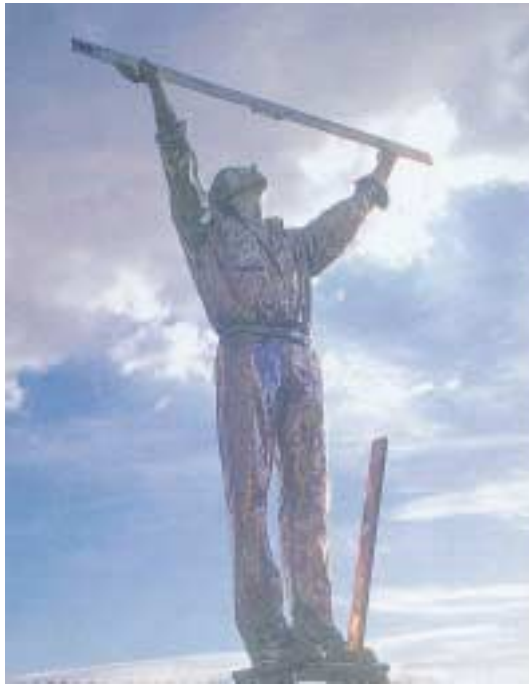
Γιάν Φάμπρ, «Ὁ ἄνθρωπος πού μετράει τὰ σύννεφα». Ἀπὸ τὴν ἔκθεση «Outlook» στὸ Ἐργοστάσιο τῆς Ἀνωτάτης Σχολῆς Καλῶν Τεχνῶν (Α.Σ.Κ.Τ.).

Ἀπ' ἀρχῆς ὁ ἄνθρωπος ἄνω θρώσκει καὶ κυτᾶει τὸν οὐρανὸ προσπαθώντας νὰ μετρήσει τ' ἄστρα. Γιατί ὄχι καὶ τὰ σύννεφα; Χαρακτηριστικὸς ἦταν ὁ πίνακας πού παρουσιάσθηκε στὴν πολυσυζητημένη μεγάλη ἔκθεση σύγχρονης τέχνης «Outlook» στὴν Ἀθήνα, στὰ πλαίσια τῆς Πολιτιστικῆς