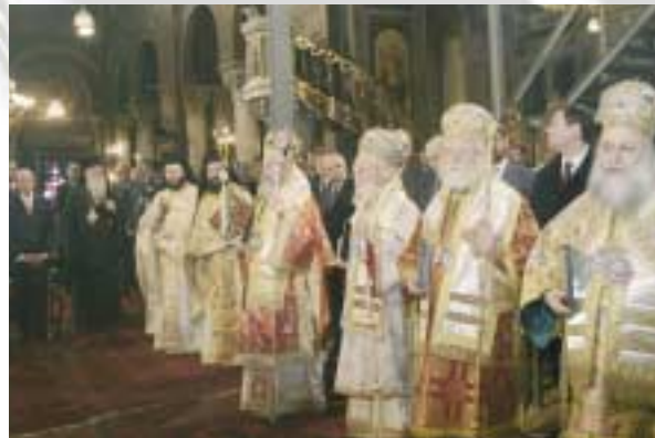
Άπο τὸν πανηγυρικὸ ἑορτασμὸ τῆς Κυριακῆς τῆς Ὀρθοδοξίας στὸ Μητροπολιτικὸ Ναὸ Ἀθηνῶν (29-2-2004).