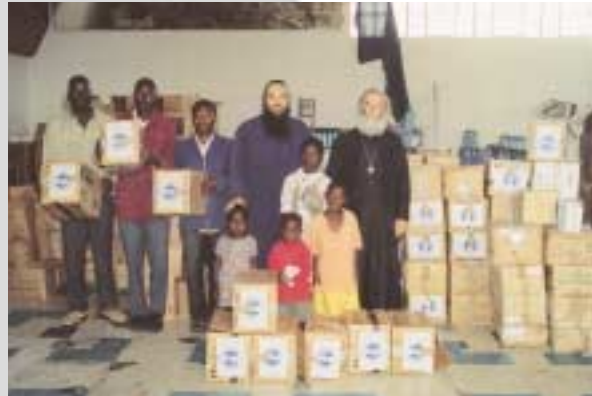
Ἡ μὴ Κυβερνητικὴ Ὀργάνωση ΑΛΛΗΛΕΓΓΥΗ τῆς Ἐκκλησίας τῆς Ἑλλάδος ἀπέστειλε τρόφιμα πρὸς τοὺς Ὀρθοδόξους Ἀφρικανοὺς ἀδελφοὺς μας τῆς Ἱερᾶς Μητροπόλεως Ζιμπάμπουε (Φεβρ. 2004).