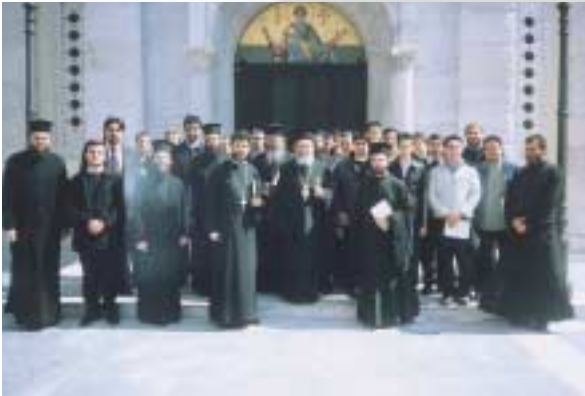
Άπο τήν σύναξη Άναγνωστών καί Υποψηφίων Κληρικῶν τῆς Ἱερᾶς Μητροπόλεως Χαλκίδος (14-3-2004).