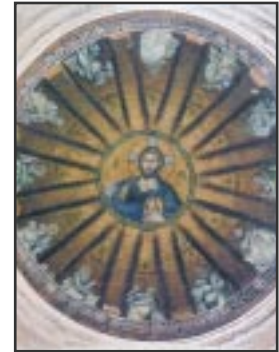
Ἐξώφυλλο: Ὁ Παντοκράτωρ. (Παρεκκλήσιο τῆς Ἱ. Μονῆς Παμμακαρίστου, Κων/λη)